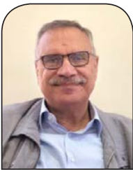
معين الطاهر العربي الجديد

تجاوزت مسألة التطبيع على المستوى الرسمي بعدئها الأخلاقي والمعنوي، وقياساتها بمفاهيم العدالة والتمسك بالرواية التاريخية، والجدل يدور حول الصعوبات التي تعترض طريقها، وسبل تذليلها، معتمدا على حسابات التكيّف مع الواقع الراهن المستندة إلى الربح والخسارة والمصالح الآتية. كما أن المدى الزمني لإنجاز الاتفاق لا يزال موضع خلاف المحليين؛ بين من يعتبره قاب قوسين أو أدنى، ولا ينقضه غير تفاصيل صغيرة، ومن يؤجّله إلى ما بعد الانتخابات الأميركية، ومن يحذّر من المماطلة التي ستعني تفويت الفرصة وتعثر المشروع، في منطقة، بل في عالم مضطرب، يحمل كل يوم جديدا، وربّ حدث صغير يحمل، في طياته، متغيّرات كبرى تقلب موازين سادت. الولايات المتحدة وإدارة بايدن أول الرابحين، هم أصحاب الفكرة والعاملون عليها والساعون إلى نجاحها، ولعل أهم ما يقصر الحرص الأميركي على إنجاز التطبيع السعودي - الإسرائيلي رغبة الولايات المتحدة في هندسة السياسة الإسرائيلية، التي تراجعت في ظل حكومة نتنياهو، إنقاذاً (لإسرائيل) من نفسها، وكي تحافظ على دورها بوصفها اللاعب الأقوى في المنطقة. يضاف إلى ذلك قلق إدارة بايدن من انفتاح السياسة السعودية على الصين وروسيا وإيران، وانضمامها إلى تجمع بريكس، وموقفها في منظمة أوبك، وتحكمها في إنتاج النفط وتحديد أسعاره وسلسلة توريده، ورغبتها في التأثير في هذه المسارات وتعديلها وفقاً للمصالح الأميركية.