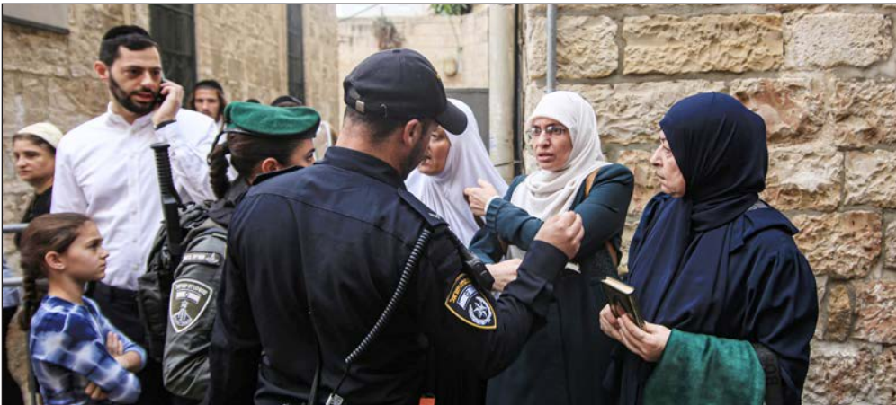
قوات الاحتلال تعتدي على المrapبات وتعتقل عدداً منهن (Apa)

القدس المحتلة-عواصم/ محمد القوقا: قوبل الاعتداء الوحشي الذي تعرضت له المrapبات في المسجد الأقصى واعتقال بعضهن، صباح أمس، بغضب فلسطيني واسع، وسط تشديد على ضرورة تصعيد المقاومة نصرة للمسجد المبارك. وأظهرت مقاطع فيديو نشرها نشطاء لحظة اعتداء قوات الاحتلال على المrapبات في البلدة القديمة بالقدس المحتلة بالضرب والتنكيل والدفع والاعتقال أثناء تواجدهن عند باب السلسلة بالبلدة القديمة.