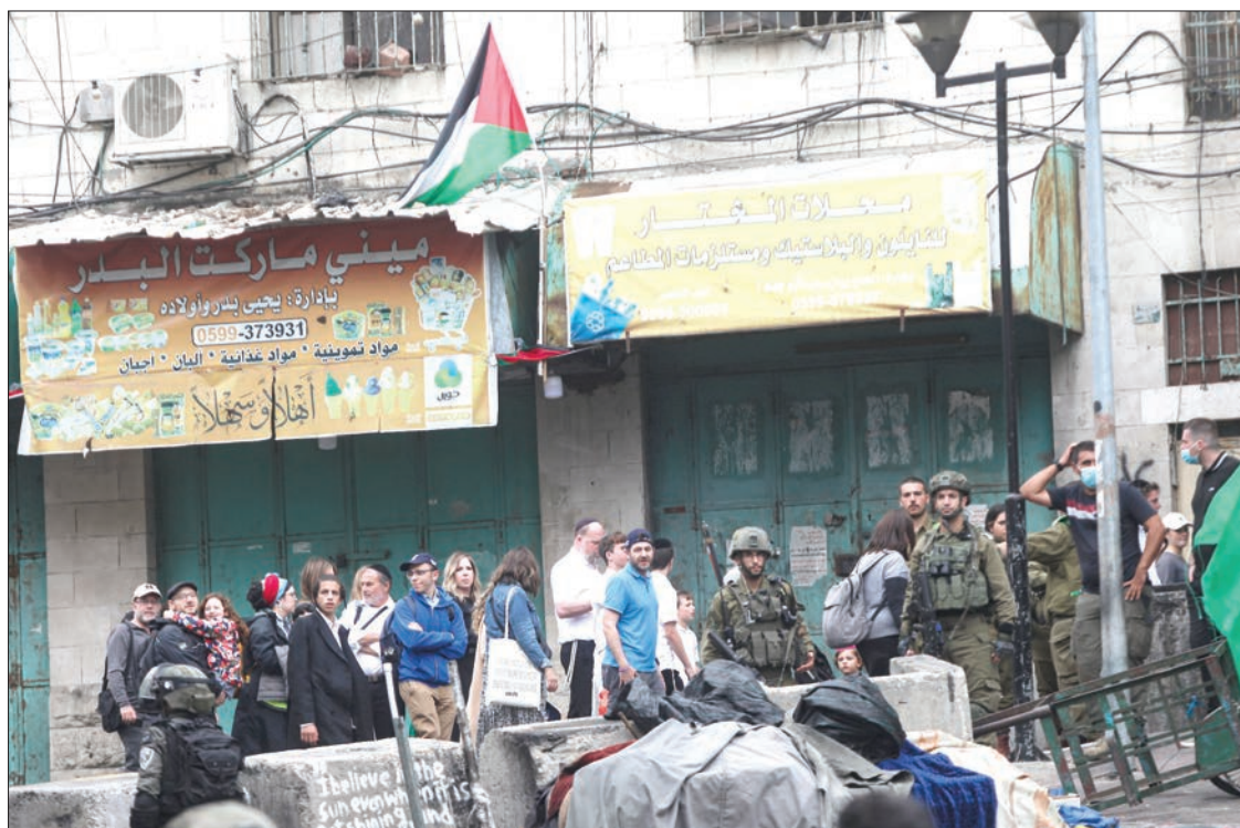
جنود الاحتلال تؤمن اقتحام المستوطنين مدينة الخليل أمس

بعد إغلاقه أمام المصلين الفلسطينيين النائب الرجوب يدعو لحماية المسجد الإبراهيمي من عريضة المستوطنين