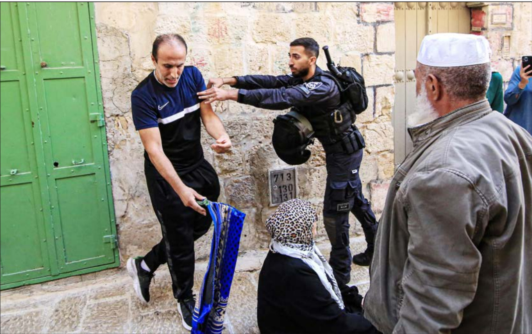
قوات الاحتلال تعتدي على المرابطين في طريق باب السلسلة بالقدس المحتلة

وزعمت الصحيفة أن هناك طموحا لدى السعوديين للاستفادة من نافذة الفرصة في ولاية الرئيس الأمريكي جو بايدن، من أجل الحصول على ضمانات أمنية ومساعدات في مشروع نووي سلمي.