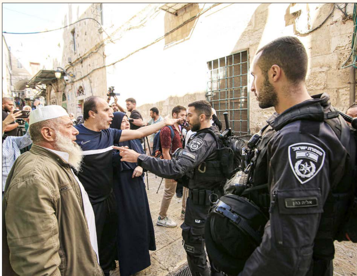
تصدي المراهبين المقدسيين لاعتداءات المستوطنين عند باب السلسلة في القدس المحتلة أمس