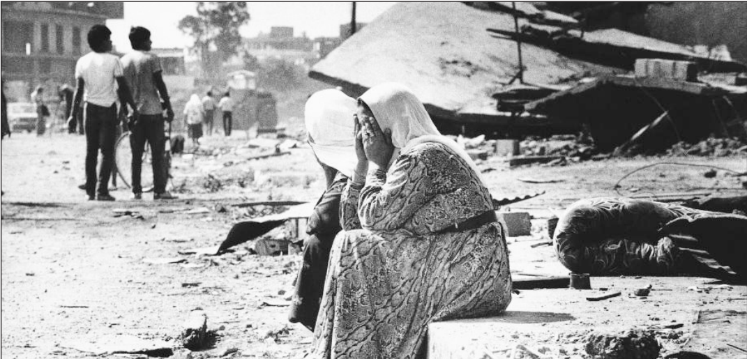
امراتان تبيكان ضحايا المجزرة

وتابع هويدي: "الكيان الصهيوني أقيم على أطلال قرى الفلسطينيين بعد أن نفذ جرائم كبيرة بحقهم، لذلك فإن تفعيل ذلك قضائياً يجب أن يسبقه وعي فلسطيني