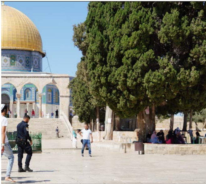
مستوطنون يقتحمون باحات المسجد الأقصى المبارك أمس

بحر: اقتحامات الأقصى تصعيد خطير يتحمل الاحتلال مسؤوليته