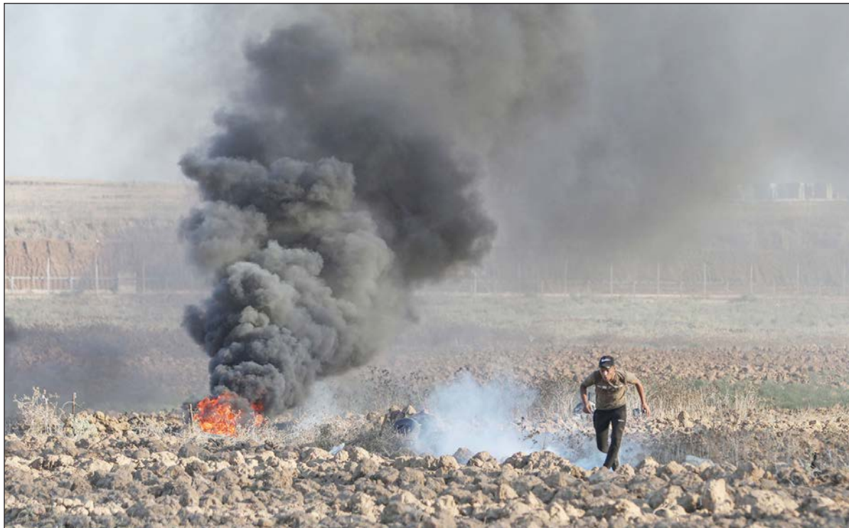
إشعال الإطارات المطاطية عقب مواجهات مع قوات الاحتلال الإسرائيلي شرق القطاع أمس