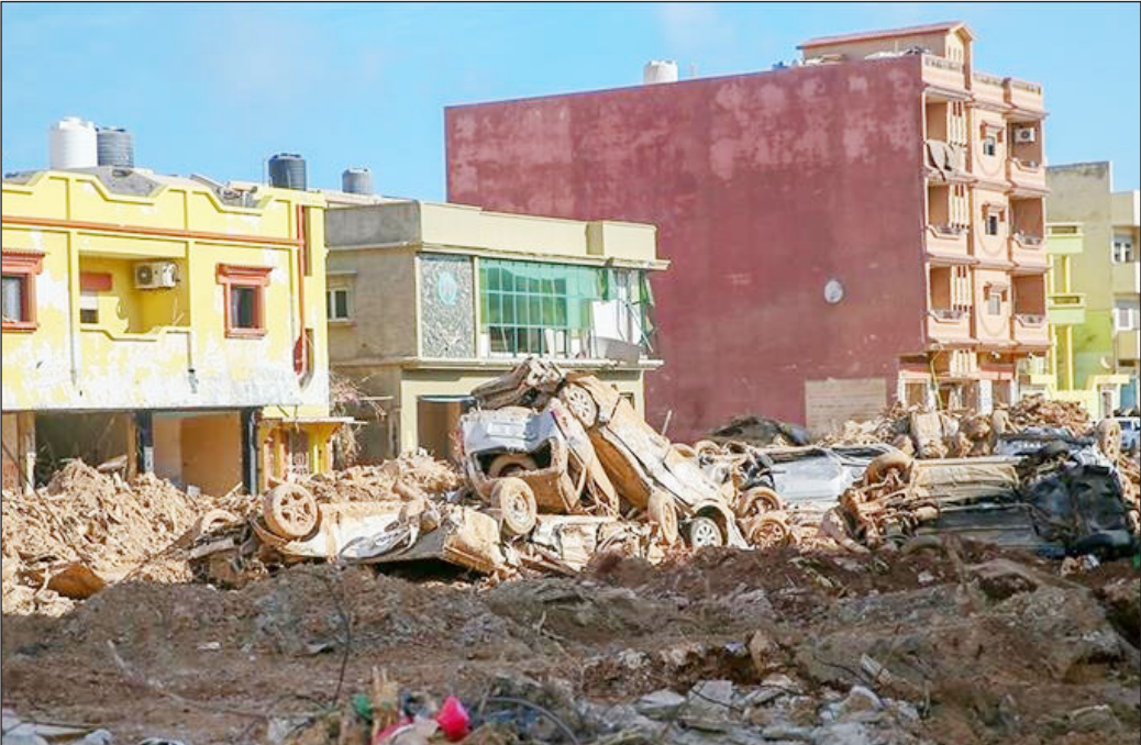
من آثار الدمار الذي خلفه الإعصار في مدينة درنة

طرابلس/ الأناضول: أعلنت الحكومة المكلفة من مجلس النواب الليبي، أمس، تنظيم مؤتمر دولي في مدينة درنة في 10 أكتوبر/ تشرين الأول المقبل، لإعادة إعمار المدينة والمناطق المجاورة التي دمرها إعصار "دانيال" قبل نحو أسبوعين. جاء ذلك في بيان لرئيس الحكومة المكلفة من البرلمان الليبي أسامة حماد نشر، أمس، عبر الصفحة الرسمية للحكومة على فيسبوك. وقال البيان، إن حماد "يدعو المجتمع الدولي للمشاركة في فاعليات مؤتمر إعادة إعمار درنة والمدن والمناطق المتضررة من إعصار (دانيال) الذي سيتم تنظيمه يوم الثلاثاء، الموافق 10 أكتوبر 2023 في مدينة درنة". وفي 10 سبتمبر/ أيلول الجاري اجتاحت الإعصار المتوسطي "دانيال" عدة مناطق شرقي ليبيا أبرزها مدن بنغازي والبيضاء والمرج وسوسة بالإضافة إلى مناطق أخرى بينها درنة التي كانت المتضرر الأكبر. ويهدف المؤتمر وفق البيان "لتقديم الرؤى الحديثة والسريعة لإعادة إعمار المدينة والمدن والمناطق