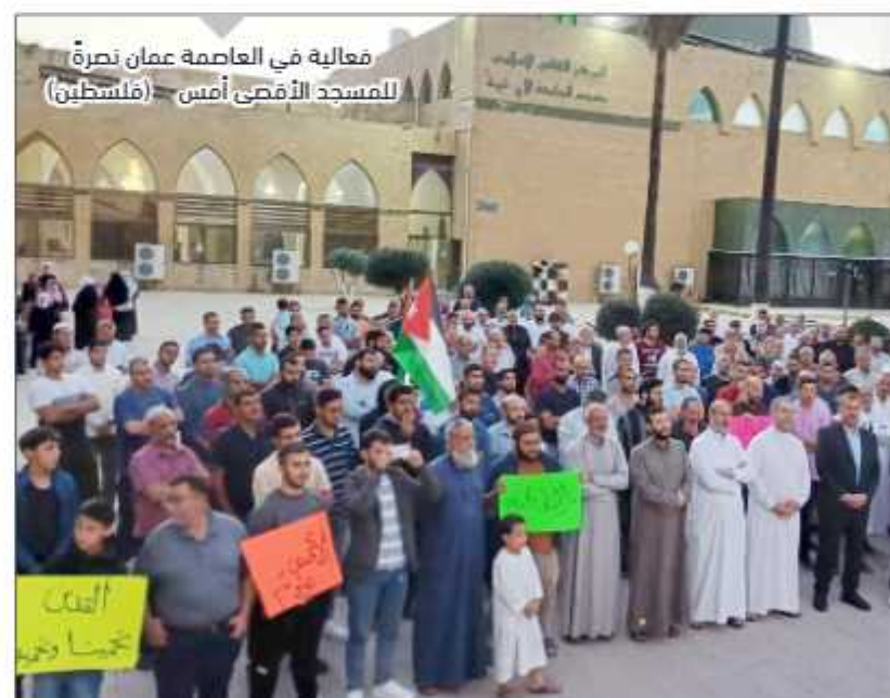
فعالية في العاصمة عمان نصرّة للمسجد الأقصى أمس (فلسطين)