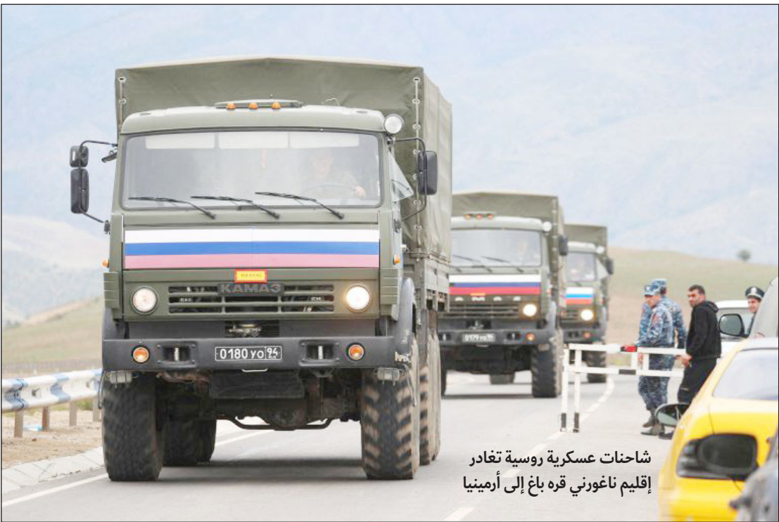
شاحنات عسكرية روسية تغادر إقليم ناغورني قره باغ إلى أرمينيا

موسكو/ وكالات: أعلنت وزارة الدفاع الروسية أمس، أن الانفصاليين الأرمن في إقليم ناغورني قره باغ بدؤوا تسليم الأسلحة والمعدات العسكرية تحت إشراف قوات حفظ السلام الروسية تنفيذًا لاتفاق وقف إطلاق النار بعد العملية العسكرية التي أعلنت على إثرها أذربيجان استعادة السيادة على الإقليم. وقالت وزارة الدفاع الروسية في بيان إن الانفصاليين سلموا 6 وحدات من المركبات المدرعة، وصواريخ مضادة للدروع، ومنظومات دفاع جوي محمولة، وأكثر من 800 سلاح ناري ونحو 5 آلاف من الذخيرة. وأضافت أن المسلحين بدؤوا مغادرة مواقعهم تنفيذًا لاتفاق وقف الأعمال العدائية والتفاهات التي تم التوصل إليها أمس خلال اجتماع بين ممثلي الأرمن والسلطات الأذرية في مدينة يفلاخ. وكانت أذربيجان قدرت أن هناك نحو 10 آلاف مسلح أرميني في قره باغ يمتلكون نحو 100 دبابة ومدعة. وفي وقت سابق، أعلن ممثلو الأرمن في بيان، أن المفاوضات جارية مع الجانب الأذربيجاني برعاية قوات حفظ السلام الروسية التي تنظم عملية انسحاب القوات وضمان عودة المواطنين الذين شردهم "العدوان العسكري" إلى منازلهم. وأضاف البيان أن الطرفين يناقشان إجراءات دخول وخروج المواطنين من الإقليم. وبموجب اتفاق وقف النار، وافق