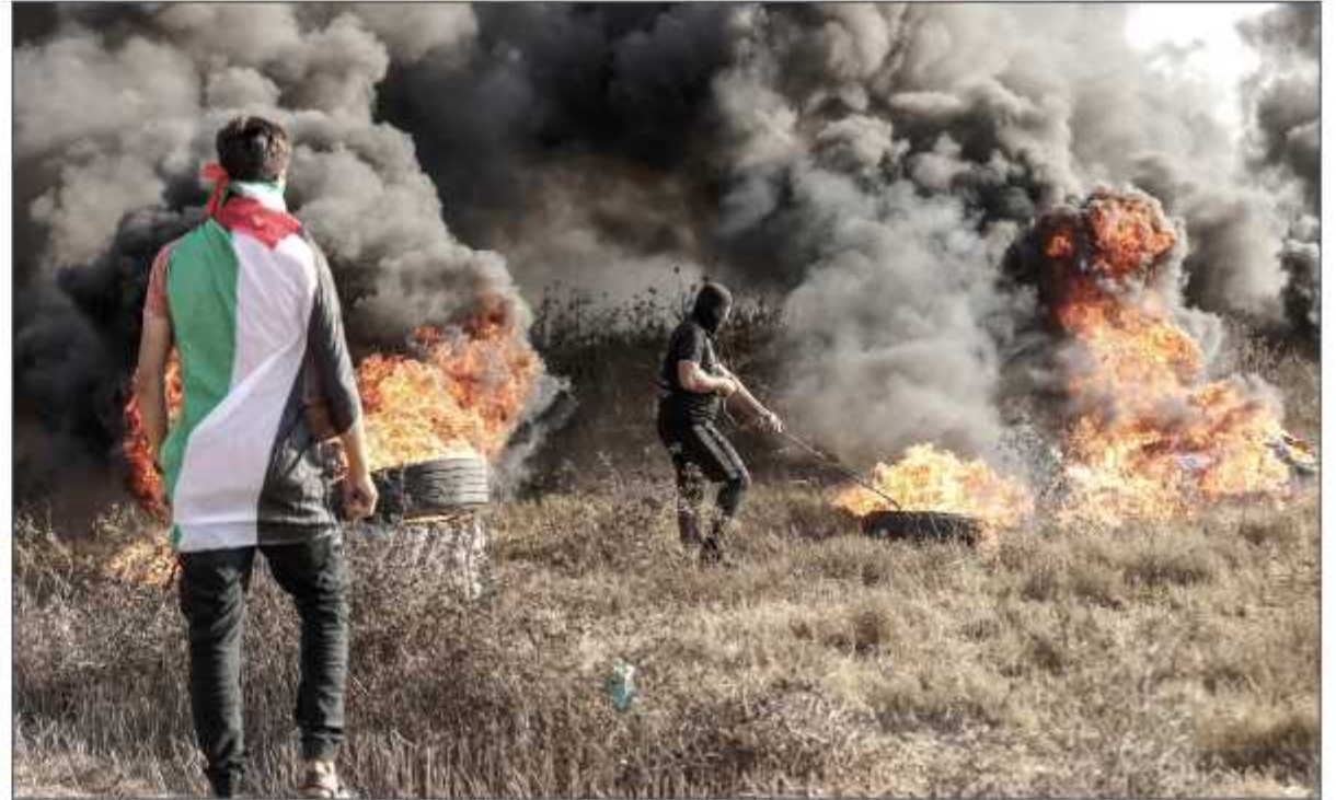
شبان فلسطينيون يشعلون الإطارات المطاطية في أثناء مواجهات مع قوات الاحتلال شرقي القطاع أمس