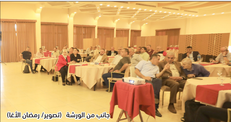
جانب من الورشة

وأوصى المتحدثون بتوسيع فرص الوصول إلى الأسواق الإقليمية، وتعزيز التصدير، وتعزيز التعاون مع الدول المجاورة، وإقامة اتفاقيات تبادل تجاري، وتعاون الحكومة والقطاع الخاص والمؤسسات الدولية لحل المشكلات والعقبات التي تواجه القطاع الصناعي، وتحسين البيئة التشريعية والتنظيمية. وأكدوا أيضاً أهمية تقديم برامج تعليمية متخصصة لتطوير مهارات العمال والمختصين في الصناعة، بحيث يتناسب