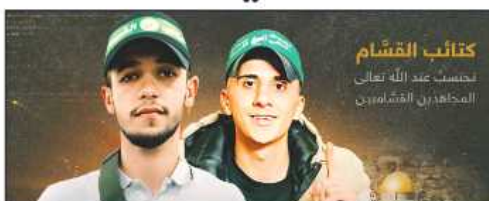
كتائب القسام نحسب عند الله تعالى المجاهدين القساميين

بين مواقف يسار الوسط واليمين المعقول، فإن التسوية التي يقدمها هرتسوغ تبدو معقولة لمختلف الإسرائيليين، لأنها توقف الحرب المندلعة بين السلطات الحاكمة، وتضع حدًا لتضارب الصلاحيات، وتحول دون تفكك جيش الاحتلال، وتعطي المجتمع الإسرائيلي فرصة للاسترخاء بدلاً من حالة الشد والجذب التي يعيشها منذ تسعة أشهر. في الوقت ذاته، فإن لدى غانتس ما يكفي من أسباب وجيهة للشك في نوايا نتانياهو، لأنه عندما خاطر حين كان زعيم "أزرق أبيض" بكل شيء من أجل تشكيل حكومة وحدة معه، رماه الأخير "للكلاب"، في هذه الأزمة الحالية لا يتردد نتانياهو مرة أخرى في إثارة شكوك خصومه. أيًا كانت مآلات التسوية التي يعرضها هرتسوغ على الائتلاف والمعارضة لحل هذا الاشتباك القائم، فمن الواضح أن الإسرائيليين على مسافة قريبة من أزمة رهيبه، ورغم أنهم قد لا يترون حجراً على حجر لمنع حدوث ذلك، لكن ليس بالضرورة أن ينجحوا في ذلك، والنتيجة أن تزداد الأزمة استحكاماً وانغلاقاً.