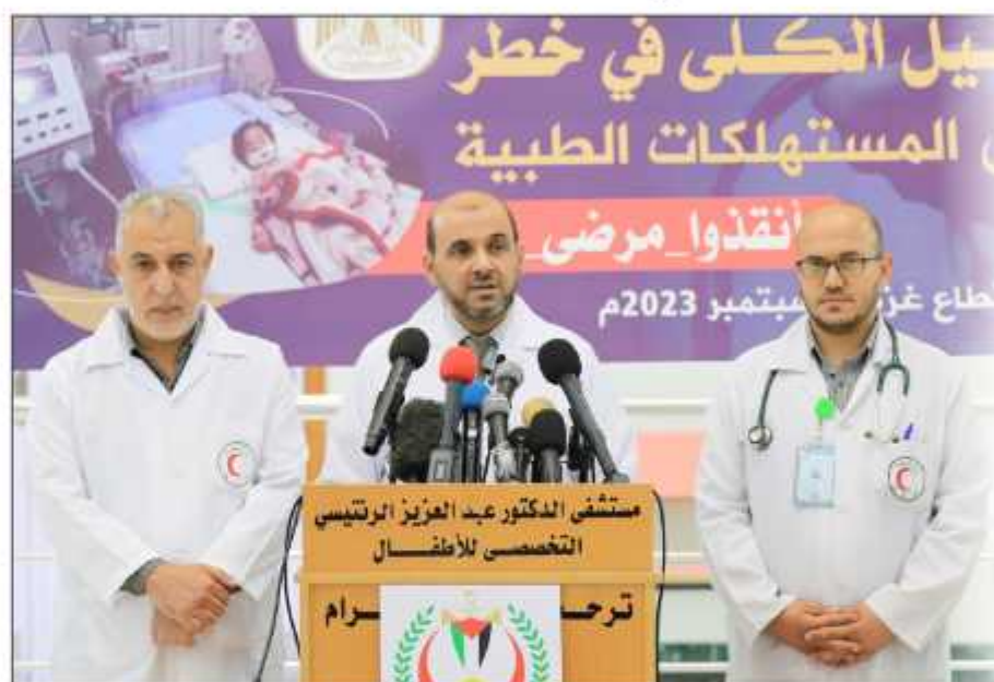
مؤتمر لوزارة الصحة حول نقص المستلزمات الطبية