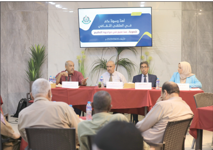
جانب من الندوة

السياسية مع الإدارة الأمريكية. وأشار العف إلى أن موجة التطبيع الحالية ستكون "حركة طارئة" وستفشل بؤاد التأييد العربي للقضية الفلسطينية. ورأى صيام أن الإدارة الأمريكية والاحتلال يحاولان عقد اتفاقيات جديدة في محاولة للالتفاف على تأييد الشعوب العربية والإسلامية للقضية الفلسطينية. وأوضح صيام أن مواجهة الكيان المحتل لمصادر القوة العربية والفلسطينية عبر وسطاء يعكس ذات الإستراتيجية