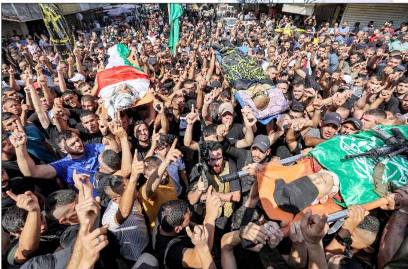
مواطنون يشيعون شهداء جنين أمس