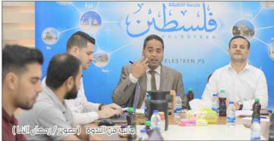
قائمين بالندوة

بالقدس المحتلة - رام الله/ فلسطين: قالت مؤسسة القدس الدولية: إن "نفخ البوق" داخل المسجد الأقصى يمثل إعلاناً للسيادة المزعومة، ويستحضر الأسطورة التوراتية والممارسة الإسرائيلية في سيناء عام 1956، والقدس عام 1967.