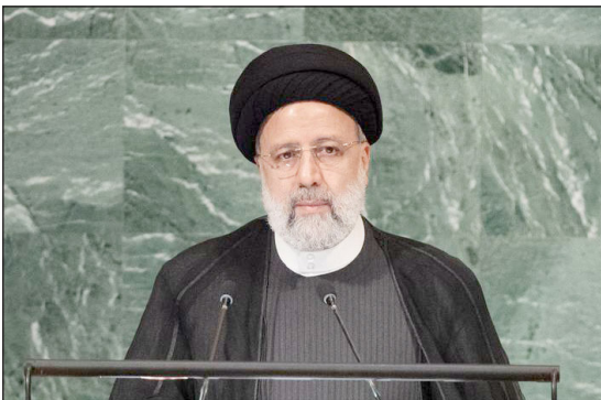
الرئيس الإيراني إبراهيم رئيسي