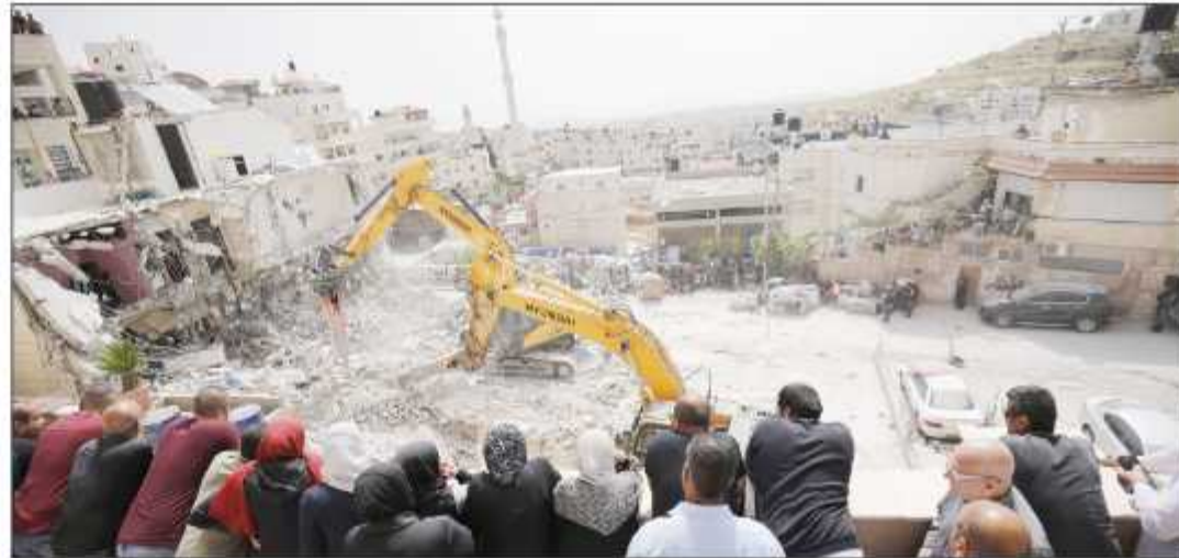
قوات الاحتلال تهدم منزلاً في القدس المحتلة

شرق قرية مخماس. وخلال هذا الشهر، شارك 3787 مستوطناً وعشرات الآلاف تحت مسمى سانح في اقتحام المسجد الأقصى، الذي تكرر على مدار 19 يوماً، وفق التقرير. كما وثق 8 اعتداءات، بارزة تمثلت في اقتحام المسجد الأقصى ومصلى باب الرحمة، والاعتداء على المصلين، واعتقال