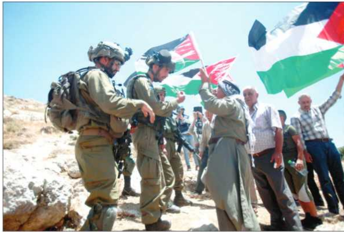
قوات الاحتلال تقمع مسيرة مناهضة للاستيطان في نابلس

خلف: الفلسطينيون يواجهون حكومة إرهابية بامتياز