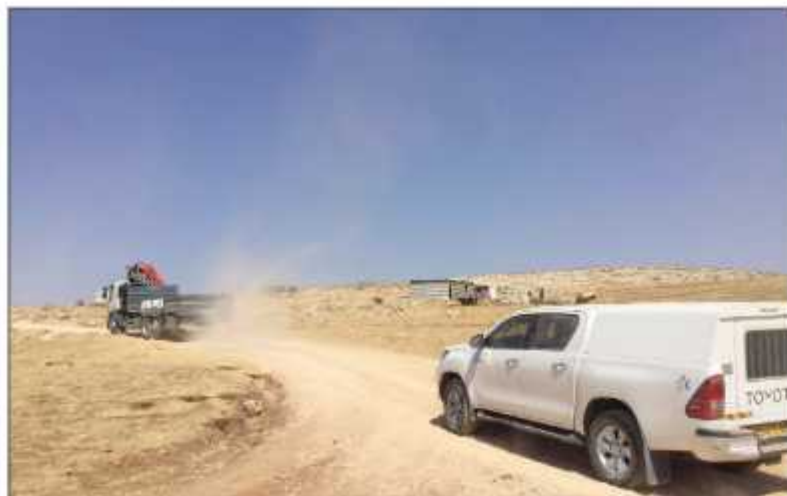
قوات الاحتلال تفتح وادي السيق (أرشيف)

رام الله- غزة/ نور الدين صالح: صعدت سلطات الاحتلال الإسرائيلي في المدة الأخيرة ممارساتها العنصرية ضد تجمع "وادي السيق" البدوي