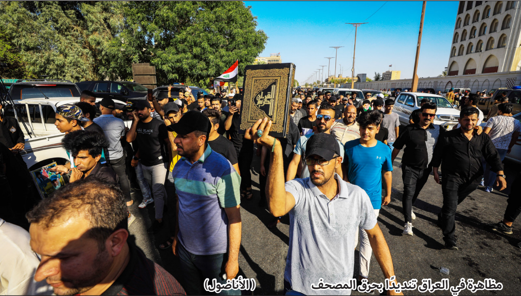
مظاهرة في العراق تهنئاً بحرق المصحف

موسكو/وكالات: أعلنت الدفاع الروسية، أمس، عن توجيه ضربة لمواقع القيادة الأوكرانية العملياتية والتكتيكية لـ"مجموعة دونيتسك". وقالت الوزارة في بيان إن "القوات الروسية دمرت بأسلحة بحرية وبرية عالية الدقة، مواقع قيادة مجموعة دونيتسك العملياتية والتكتيكية الأوكرانية". وأضاف البيان أنه "خلال الـ24 ساعة الماضية، واصلت القوات الأوكرانية شن محاولات الهجومية الفاشلة في محاور دونيتسك وكراسنى ليمانسك وجنوب دونيتسك"، بحسب ما نقلت قناة "روسيا اليوم". وجاء في البيان أن القوات الروسية صدت في محور دونيتسك 15 هجوماً أوكرانياً، وبلغت خسائرهم أكثر من 265 جندياً أوكرانياً. وأوضح أنه تم تدمير مدفعين من طراز Msta-B ومدفع D-20، كما تم تدمير مستودع ذخيرة للواء الآلي 54 الأوكراني. وفي 8 يونيو/حزيران، بدأت أوكرانيا هجوماً مضاداً لاستعادة الأراضي التي سيطرت عليها روسيا، بالاستفادة من الدعم العسكري المتقدم من الدول الغربية. وكانت روسيا أطلقت في 24 فبراير/ شباط 2022 عملية عسكرية في أوكرانيا وتشترط لإنهائها "تخلي" كييف عن خطط الانضمام إلى كيانات عسكرية، وهو ما تعدده الأخيرة "تدخلا" في سيادتها.