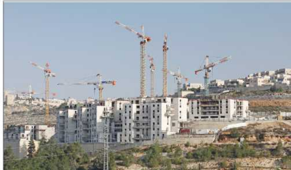
قوات الاحتلال تواصل أعمال البناء الاستيطاني في الضفة الغربية (أرشيف)

أراضي المقدسين ومصالحهم. وأوضح التقرير أن خطورة المشروع - في حال تنفيذه - لكونه يقع في المنطقة بين حي الشيخ جراح والبلدة القديمة، حيث تنتشر البؤر الاستيطانية التي قد تتوسع لتمتد داخل الأحياء الفلسطينية. يشار إلى أن "اللجنة اللوائية الإسرائيلية" رفقت الأسبوع الماضي الاعتراضات التي تقدم بها المالكون والمستأجرون في المنطقة الصناعية في وادي الجوز في شرقي القدس على المشروع الإسرائيلي المسمى "وادي السيلكون"، وفي السياق، رصد التقرير الأسبوعي جرائم منظمة للمستوطنين ضد القرى والمواطنين الفلسطينيين، وذلك بدعم من نواب الكنيست ووزراء الحكومة المتطرفة. وأوضح أن هذه المجموعات المنظمة لم تعد تعبر اهتماما كبيرا بانتقادات تصرفاتها وممارساتها الإجرامية بعد أن انتقلت من العمل في خلايا سرية إلى العمل بمجموعات منظمة تدعو لقتل الفلسطينيين والهجوم على قراهم ومنازلهم.