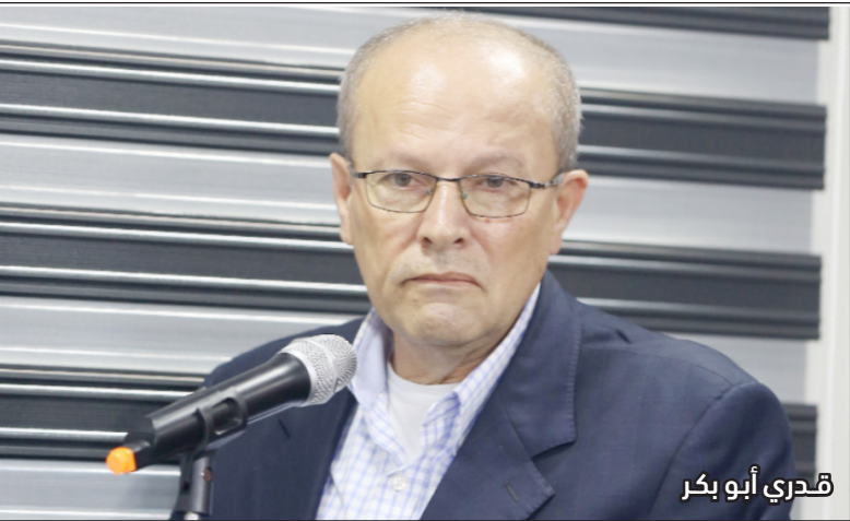
قدري أبو بكر

ثلاثة مواطنين؛ بينهم وزير الأسرى اللواء قدري أبو بكر، قد توفوا وأصيب آخرون، في حادث سير على الطريق الواقع شمال شرق مدينة سلفيت.