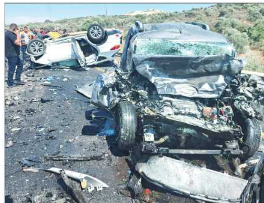
من مكان الحادث أمس