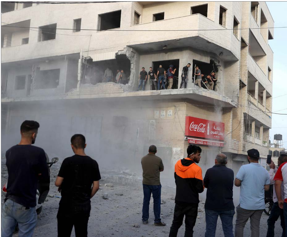
منزل الأسير فروخ بعد تفجيره برام الله

حماس: حكومة الاحتلال لن تنجح في تمرير مخططاتها لتقسيم المسجد