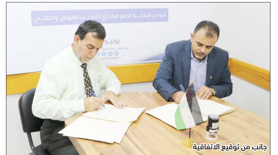
جانب من توقيع الاتفاقية

وأفادت وزيرة الخزانة الأميركية جانيت يلين بأن الاقتصاد الأميركي قوي في ظل إنفاق استهلاكي نشط لكن بعض المجالات تشهد تباطؤاً، مضيفاً أنها تتوقع مواصلة إحراز تحسن في خفض التضخم خلال العامين المقبلين. وقالت يلين في مقابلة مع شبكة "سي إن بي سي" (CNBC) إن البنوك قد تواجه صعوبات في مجال العقارات التجارية وقد تشهد اندماجات، لكن هناك سيولة وفيرة في النظام والبنوك ستتمكن عموماً من تحمل أي ضغوط. وأضافت يلين أن التضخم قد يتراجع مع بقاء سوق عمل قوية، وبطالة تبلغ نحو 4% بارتفاع طفيف عن نسبة 3.7% سجلتها في مايو/أيار الماضي. وتابعت أن الاقتصاد تباطأ إلى حد ما، مخففاً الضغوط على سوق العمل، لكن "ما زال لدينا سوق عمل صحي بشدة، فالمكاسب في الأجور كبيرة". وقالت يلين: إن التشريع الخاص برفع سقف الدين وخفض العجز التجاري أكثر من تريليون دولار على مدى عقد سيدعم جهود المجلس الاحتياطي الفدرالي (البنك المركزي) لخفض التضخم.