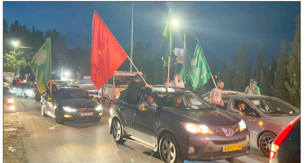
احتفالات في رام الله بفوز الكتلة الإسلامية

بيرزيت، بتقدمها على حركة الشبيبة الفتاوية في كبرى الجامعات الفلسطينية، وذلك بعد أيام من فوز مماثل في جامعة النجاح الوطنية في نابلس، وهي نتائج عدتها