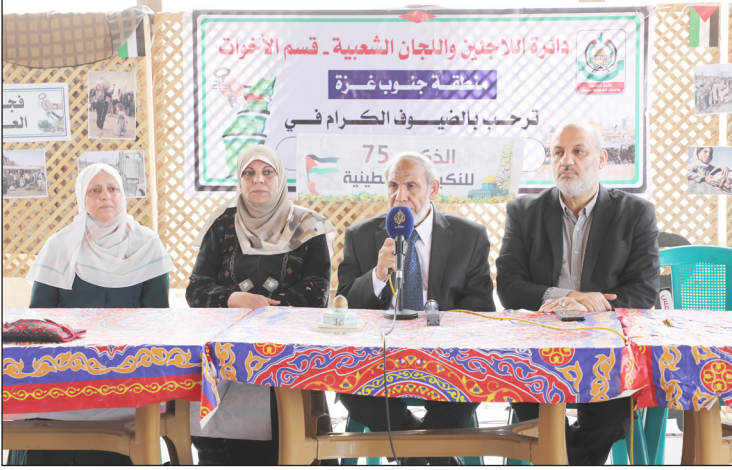
جانب من الفعالية بمدينة غزة