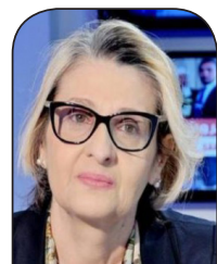
آسيا العتروس رأي اليوم

هذه الرسائل المتواترة لسلطة الاحتلال تأتي أيضاً على وقع مسيرة حملة الأعلام التي يراد من خلالها إفاذ مشروع يمنع العلم الفلسطيني، وتجريم من يقدم على ذلك داخل خط 48 وهي خطوة غير مسبوقه تعكس القضية الفلسطينية، ولكنها تكشف في الوقت ذاته رعباً داخلياً من أسلحة فلسطينية رمزية ممثلة في العلم الفلسطيني الذي يفترض أنه المظلة والعنوان الذي يتسع لكل الفصائل الفلسطينية في هذه المرحلة التاريخية التي تمر بها القضية الفلسطينية التي تتعرض للتصفية العلنية ومحاولات قهرها وإلغائها من التاريخ والجغرافيا،