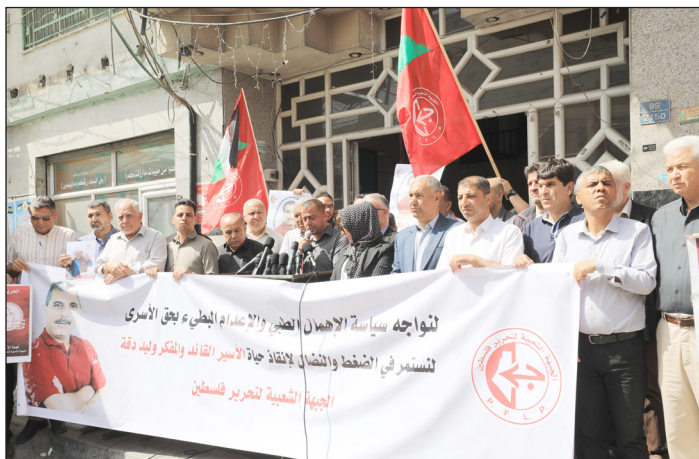
جانب من الوقفة بغزة أمس

وباستخدام كل الخيارات الفعالة لإنقاذ الأسرى.