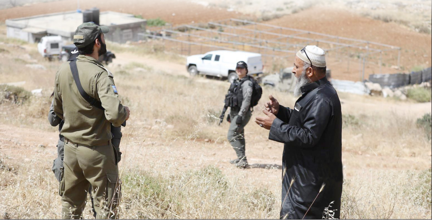
مسن يدافع عن أرضه في وجه الاحتلال شرق مدينة الخليل

محافظات/ فلسطين: أصابت قوات الاحتلال الإسرائيلي مساء أمس عددًا من المواطنين عقب محاصرتها منزلًا في مخيم عقبة جبر جنوب مدينة أريحا. وقالت مصادر محلية إن مواجهات واشتباكات