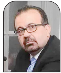
جوزيف مسعد عرب 21