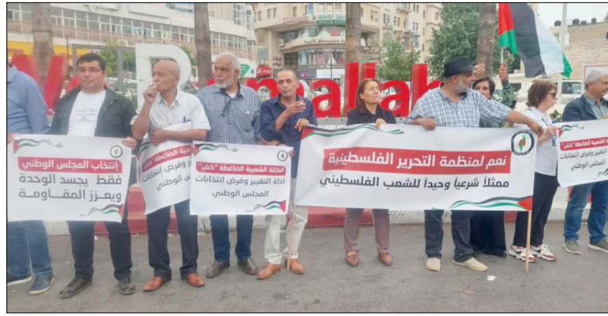
جانب من الوقفة

المسيطرة، للاستجابة إلى الإرادة الشعبية وإجراء انتخابات للمجلس الوطني، من أجل استعادة منظمة التحرير لدورها الوطني.