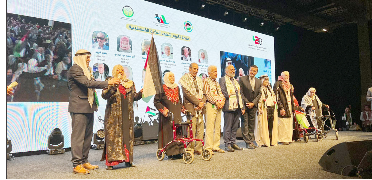
جانب من المؤتمر

يذكر أن أول مؤتمر فلسطيني أوروباً عقد عام 2003، وهو مناسبة سنوية دائمة، يعقد بالتعاون مع الجمعيات الفلسطينية الموجودة في الدول الأوروبية، لتأكيد حق الفلسطينيين في العودة إلى ديارهم وأراضيهم، وأن الفلسطينيين في أوروبا جزء أصيل من الشعب الفلسطيني الواحد.