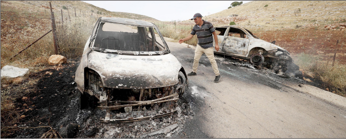
مستوطنون يحرقون مركبات المواطنين في بلدة المغير