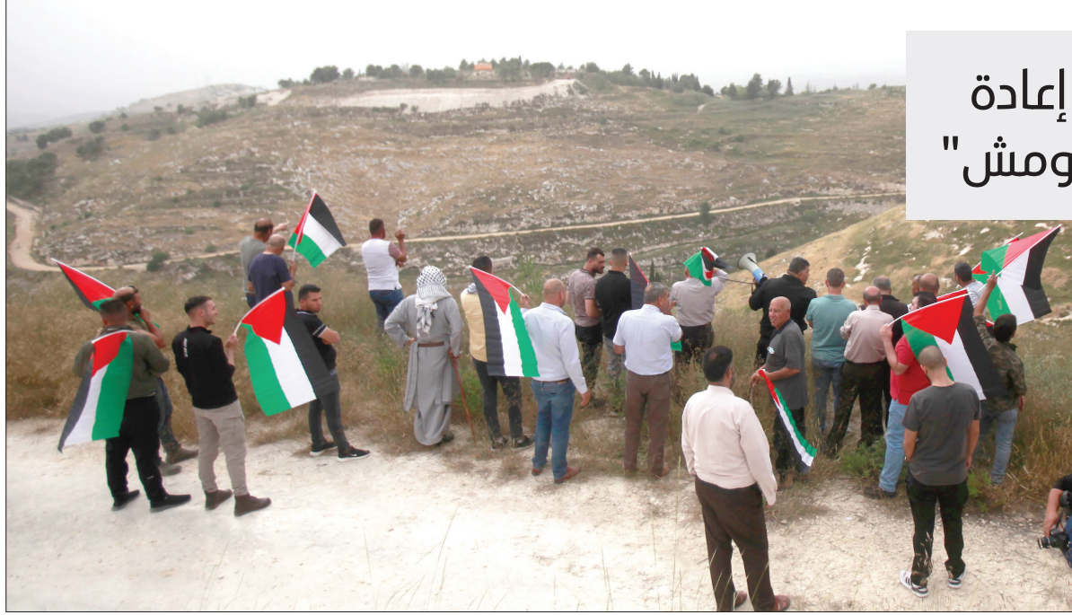
فلسطينيون ينظمون فعالية رافضة لإعادة المستوطنين لمستوطنة "حومش" شمال غرب الضفة أمس (Apa)