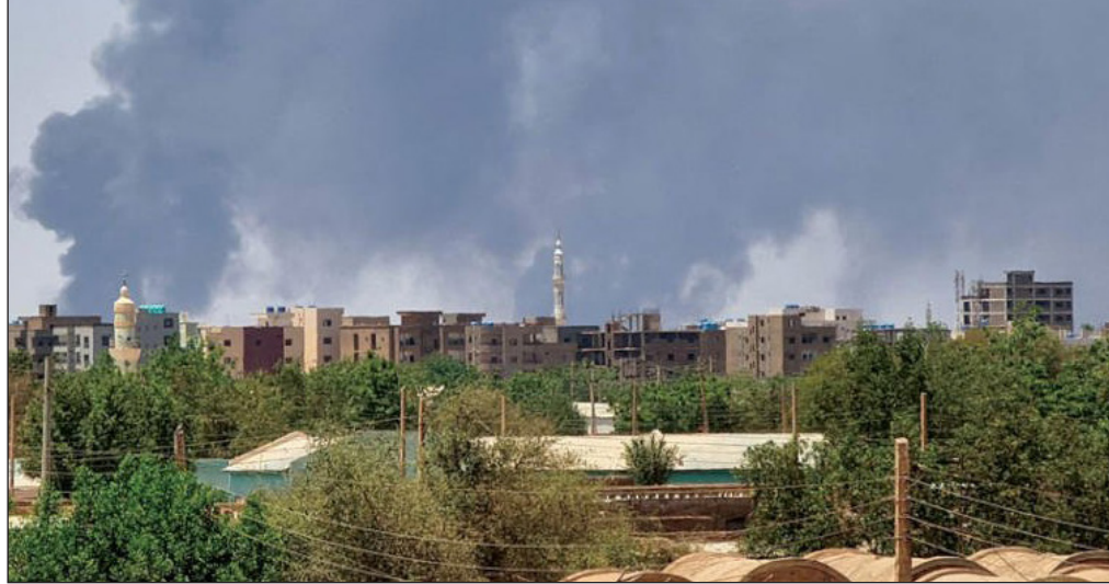
رغم الهدنة.. تصاعد أسنة النار من جراء الاشتباكات بين الجيش وقوات الدعم

الخرطوم/ وكالات: شهدت العاصمة السودانية بعض الهدوء صباح أمس في ظل هدنة تستمر سبعة أيام أدت على ما يبدو إلى تقليل الاشتباكات بين الجيش وقوات الدعم السريع، غير أنها لم تقدم بعد المساعدات الإنسانية المنتظرة لملايين المحاصرين في العاصمة. وتهدف الهدنة التي وقعها طرفا الصراع يوم الاثنين لضمان ممر آمن للمساعدات الإنسانية والتمهيد لمبادرات أوسع نطاقا برعاية الولايات المتحدة والسعودية. وقال شهود أمس إن الخرطوم تشهد بعض الهدوء، بالرغم من ورود أنباء عن اشتباكات متفرقة خلال الليل. وتحدثت قناة العربية عن وقوع اشتباكات في شمال غرب الخرطوم وجنوب مدينة أم درمان المجاورة لها. واتهمت قوات الدعم السريع في