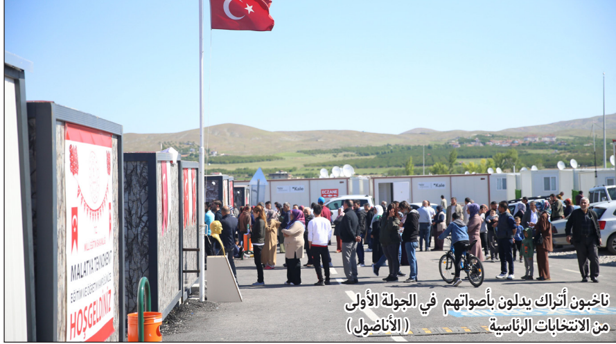
ناخبون أتراك يدلون بأصواتهم في الجولة الأولى من الانتخابات الرئاسية

أنقرة/ وكالات: يدلي الناخبون الأتراك بأصواتهم اليوم الأحد في جولة الإعادة للانتخابات الرئاسية بين الرئيس رجب طيب أردوغان ومناقسه كمال كليجدار أوغلو. وينتخب الأتراك رئيساً يتولى المنصب لولاية مدتها 5 سنوات. وفي جولة الانتخابات الأولى يوم 14 مايو/ أيار، حصل أردوغان على 49.5% من الأصوات، وهي نسبة تقل قليلاً عن الأغلبية اللازمة للحسم من الجولة الأولى. وحصل كليجدار أوغلو -وهو مرشح تحالف المعارضة يضم 6 أحزاب- على تأييد 44.9% من الناخبين. بينما حل المرشح القومي سنان أوغان ثالثاً بحصوله على نسبة 5.2% من الأصوات ليتم استبعاده. وتلقى أردوغان قبل أيام دعماً من المرشح القومي سنان أوغان، مما عزز موقفه وزاد من التحديات التي يواجهها كليجدار أوغلو في جولة الإعادة. ولا يحدد التصويت فقط من سيقود تركيا، العضو في حلف شمال الأطلسي والتي يبلغ عدد سكانها نحو 85 مليون نسمة، ولكن أيضاً كيف ستتم إدارتها وإلى أين يتجه اقتصادها وسط أزمة غلاء المعيشة، كما سيحدد مسار سياساتها الخارجية. ويحق لأكثر من 64 مليون تركي التصويت في حوالي 192 ألف مركز اقتراع. وهناك 3.4 ملايين ناخب في الخارج صوتوا في الفترة من 20 إلى 24 مايو/ أيار الجاري. وتفتح مراكز الاقتراع أبوابها في الساعة الثامنة صباحاً (5:00 بالتوقيت العالمي) وتغلق في الخامسة مساءً (14:00 بالتوقيت العالمي) اليوم الأحد.