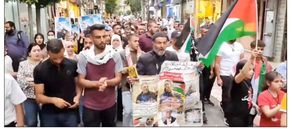
جانب من المسيرة برام الله

دقة، وأهمية اجتماعه بعائلته محرراً. والأسير وليد دقة من بلدة باقة الغربية معتقل منذ 25 من آذار/ مارس 1986، وهو أحد أبرز الأسرى وأقدمهم في سجون الاحتلال، وساهم في العديد من المسارات في حياة الأسرى، فقد أنتج العديد من الكتب والدراسات والمقالات، وساهم معرفياً في فهم تجربة السجن ومقاومته.