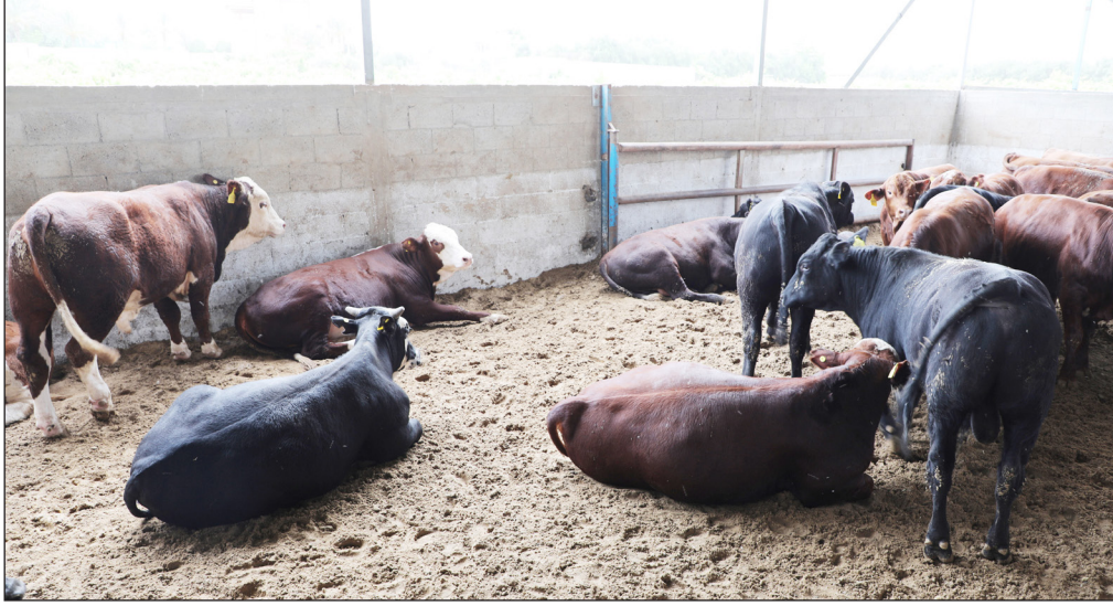
إحدى مزارع المواشي في غزة