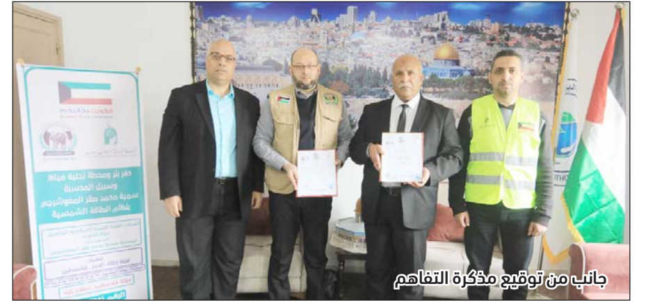
جانب من توقيع مذكرة التفاهم

أقر المجلس التشريعي قانون الموازنة العامة لعام 2023، خلال جلسة خاصة لمناقشة تقرير لجنة الموازنة العامة والشؤون المالية. وقال رئيس المجلس التشريعي بالإجابة د. أحمد بحر: إن قانون الموازنة العامة يشكل أداة أساسية وفاعلة في متابعة أداء السلطة التنفيذية وسياساتها المالية والاقتصادية والاجتماعية والرقابة عليها ومساءلتها، للتحقق من مدى التزام الحكومة بقانون الموازنة العامة. وأضاف بحر خلال إقرار القانون أمس، أن المجلس التشريعي يحرس على إجراء الدراسة التحليلية لمشروع الموازنة المقدمة من الحكومة وتسجيل الملاحظات التطويرية والتصويبية وعقد جلسات نقاش مع وزارة المالية وصولا لصياغة الموازنة السنوية التي تلبى الاحتياجات العامة وتخدم أبناء شعبنا في مختلف المجالات. وأوضح أن رئيس لجنة متابعة العمل الحكومي تقدم لإقرار مشروع قانون الموازنة العامة لعام 2023، وعملت لجنة الموازنة العامة والشؤون المالية بالتشريعي على دراسة المشروع من كل الجوانب القانونية والمالية والاقتصادية، وعقدت جلسة أمس استناداً للبند (2) من المادة (61) من القانون الأساسي المعدل لسنة 2003. من جهته، قال رئيس لجنة الموازنة والشؤون المالية النائب يحيى العبادسة: إنه استناداً إلى أحكام المادة (3) من قانون الموازنة العامة والشؤون المالية رقم (7) لسنة 1998، تقدم اللجنة تقريرها حول مشروع قانون الموازنة العامة للسنة المالية 2023. وأشار العبادسة خلال تلاوته تقرير لجنته، إلى أن