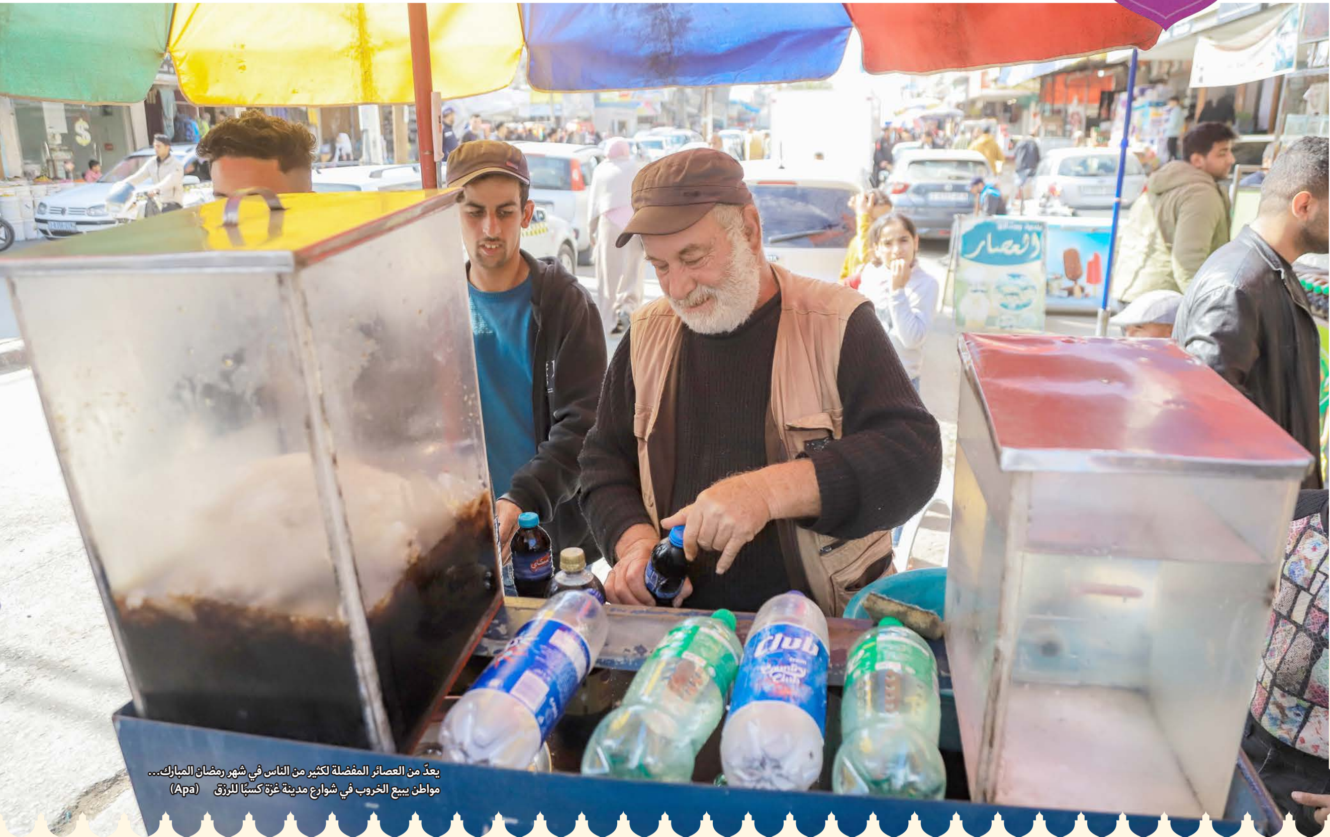
يعدّ من العصائر المفضلة لكثير من الناس في شهر رمضان المبارك... مواطن يبيع الخروب في شوارع مدينة غزة كسباً للرزق