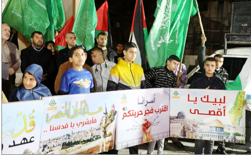
جانب من الوقفة

ووجه رسالة لأهل الضفة والداخل المحتل: "أنتم حراس العقيدة