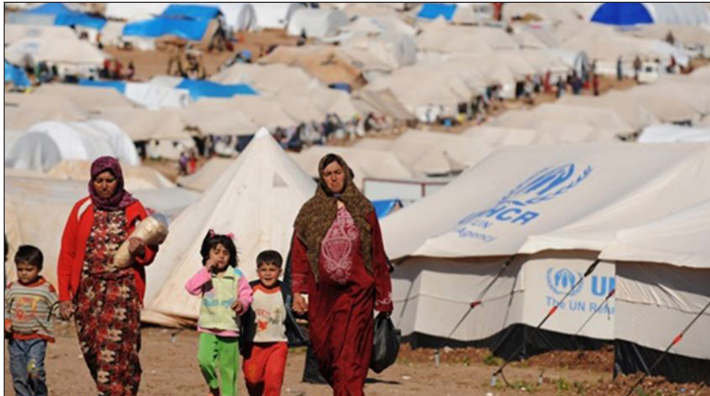
أحد مخيمات اللاجئين الفلسطينيين في سوريا