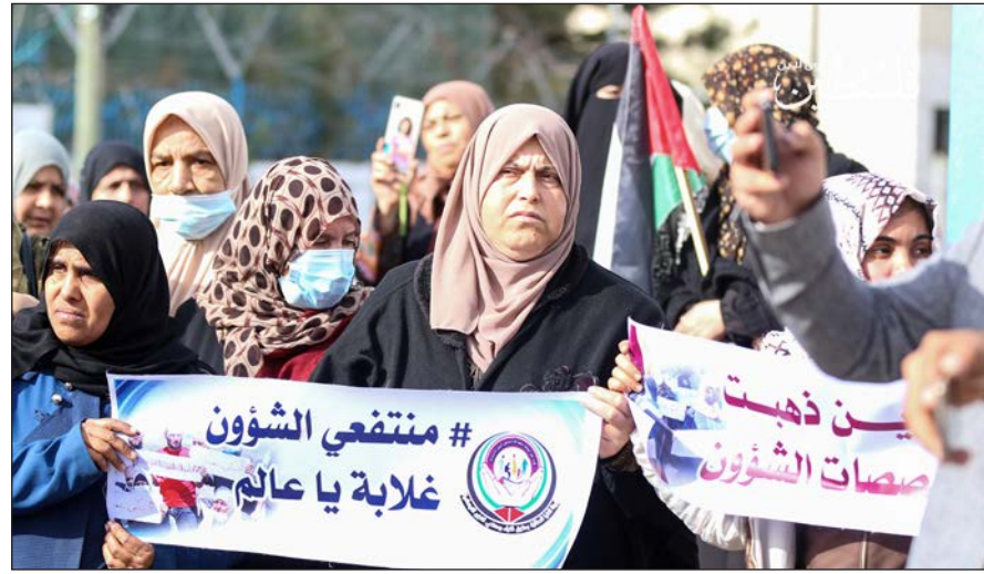
وقفة سابقة لمنتفعي الشؤون في غزة

وأضافت إن إصرارها على عدم صرف مستحقات منتفعي الشؤون الاجتماعية منذ شهر طويلة، بالرغم من توفر جزء من الموازنة المخصصة للتنمية الاجتماعية، "معانٍ في التهرب من المسؤولية إزاء احتياجات الفقراء، وتعد واضح ومكشوف منها على الحقوق العادلة والمستحقة لهم ولأسرهم المعدبة بنيران الأوضاع