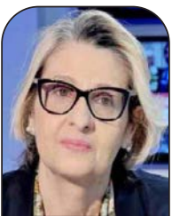
آسيا العتروس رأي اليوم

التي وحدت بغائها المفرط وعنصريتها التي تجاوزت كل الحدود واستخفافها بكل القوانين والأعراف الدولية بخطواتها وممارساتها الفاشية العالم ودفعت المجتمع الدولي والعواصم الدولية المؤثرة تخرج عن صمتها وتندد بقرار الكنيست المصادقة على عودة المستوطنين إلى أربع مستوطنات في الضفة الغربية سبق الاتفاق بشأن انسحاب المستوطنين منها قبل ثمانية عشرة عاماً برعاية دولية الرد الكفيل بردح الاحتلال وإيقاف مسلسل الجرائم اليومية في حق الشعب الفلسطيني يجب أن تبدأ من تعليق التطبيع.