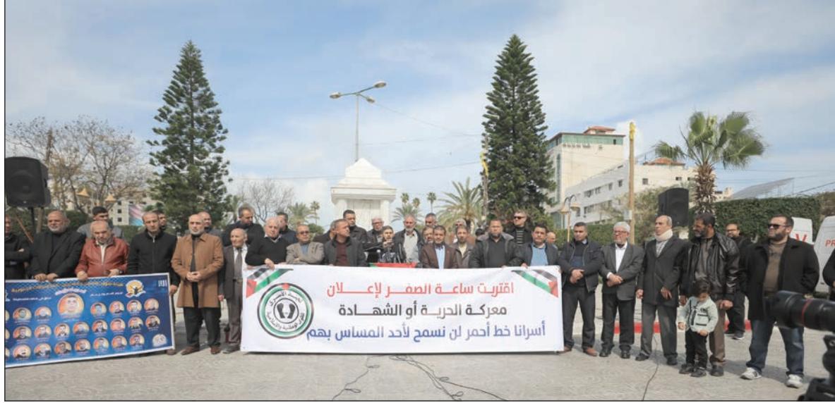
فعالية تضامنية مع الأسرى في غزة أمس

وجاء في وصية أحد أبرز قيادات الأسرى قوله: "يا أبناء شعبي، ويا إخواني، ويا أبناء المقاومة، وصييتي لكم إن كنت لن أعود، خرجنا يوم أن خرجنا متوكلين على الله، سائرين في طريق الجهاد والاستشهاد؛ من أجلكم، ومن أجل رفع الظلم عنكم، نبغي تحريركم، ودرحر