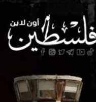
ياسمين شعبان (جون محاكمة)