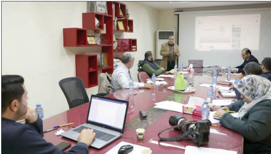
جانب من الندوة في غزة أمس

البلدان التي تقع على البحار والمحيطات، وهي "طبيعية" وليست مستحدثة"، وأسبابها هي المد والجزر واندفاع الأمواج بسرعة.