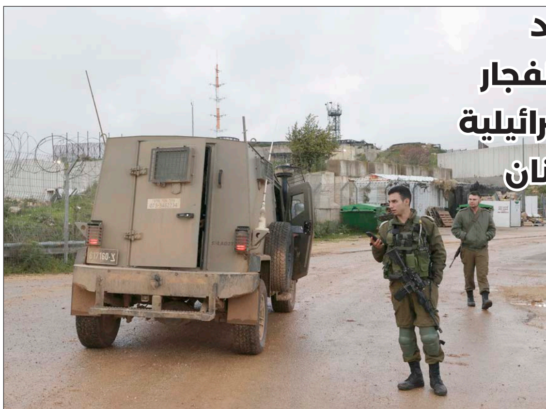
جنود من جيش الاحتلال بالقرب من مكان انفجار «اللغم» على حدود لبنان