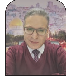
المستشار أسامة سعد