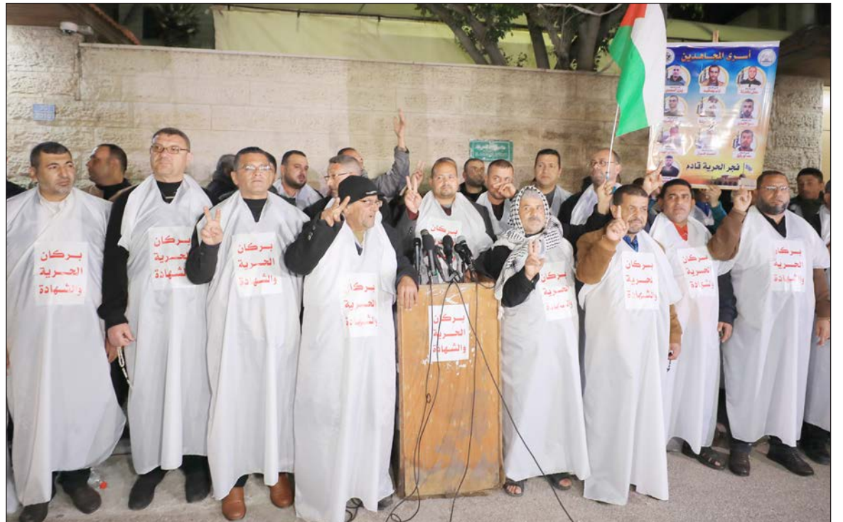
مواطنون يرتدون الأُكفان في وقفة تضامنية مع الأسرى بغزة أمس