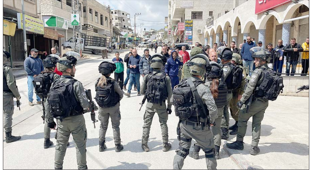
جنود الاحتلال يضيقون على أهالي حوارة في نابلس