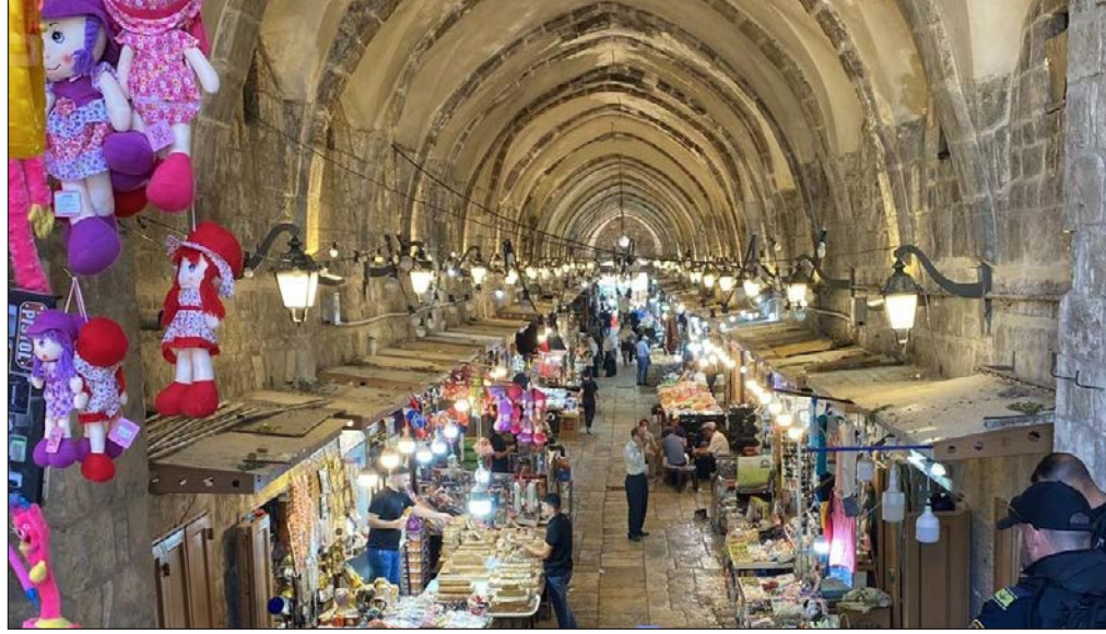
أسواق مدينة القدس