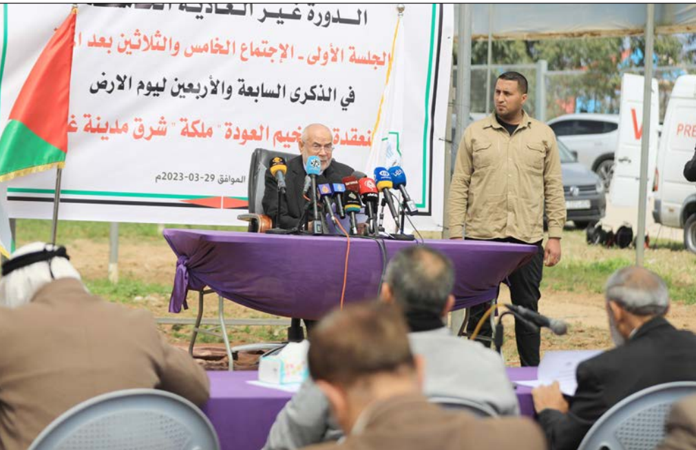
نواب التشريعي في أثناء الجلسة شرق غزة