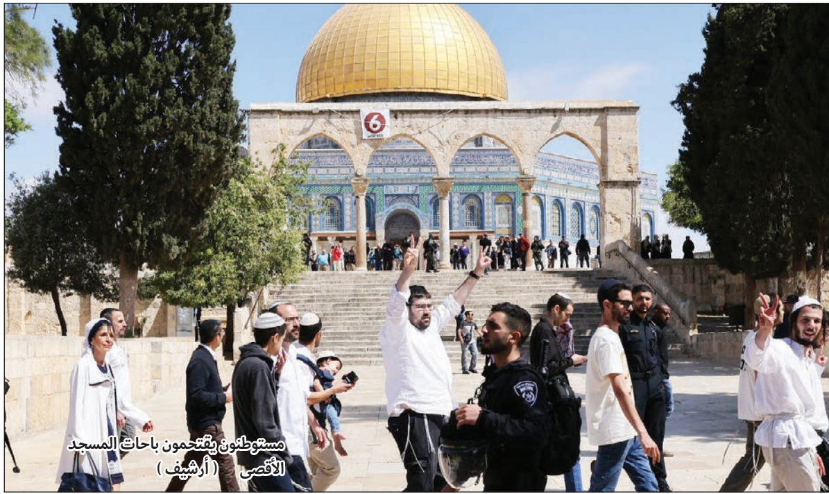
مستوطنون يتجمعون باحات المسجد الأقصى (أرشيف)

لاقترامات قوات الاحتلال المتكررة واعتداءاتها المتصاعدة ضد الفلسطينيين.