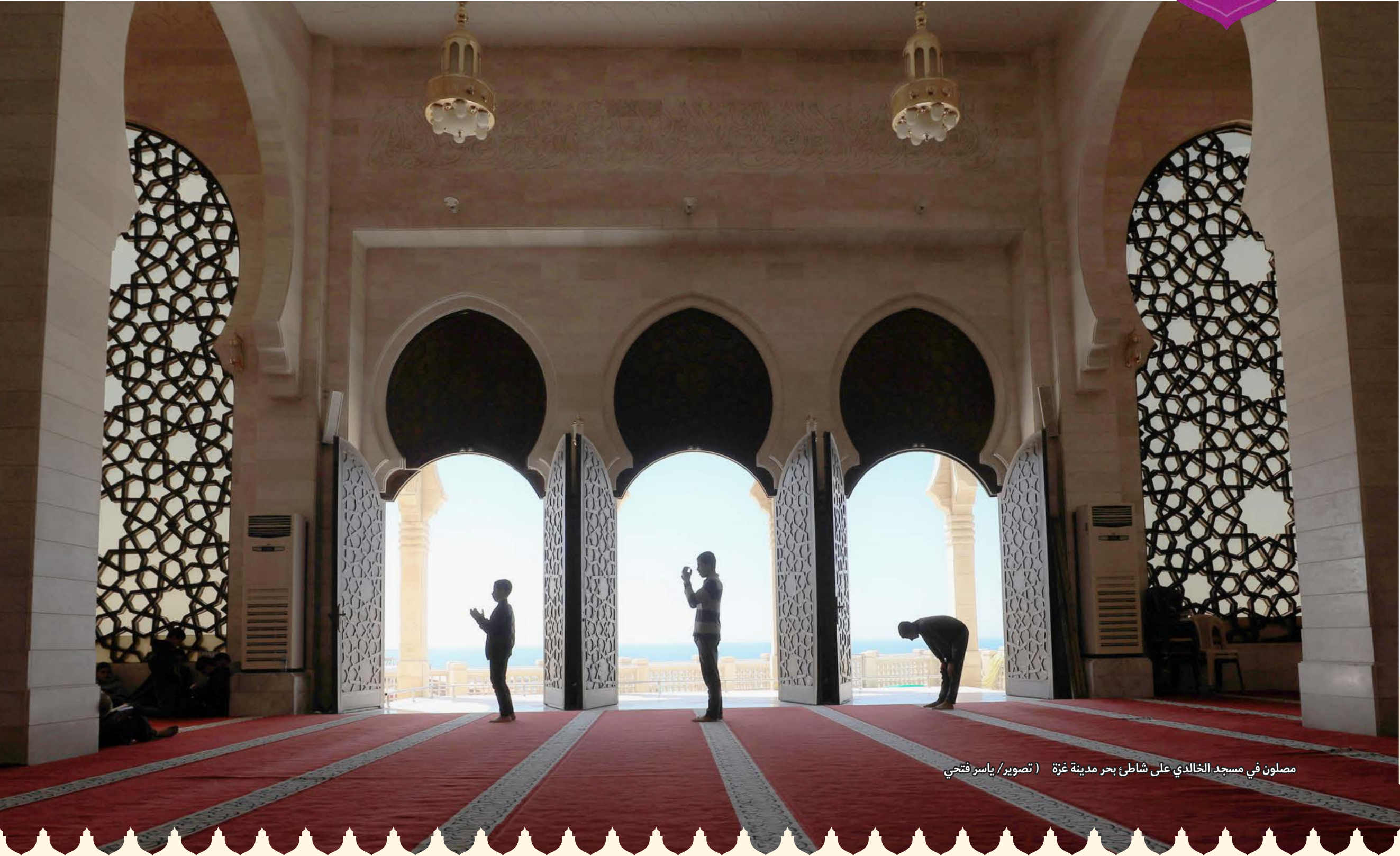
مصلون في مسجد الخالدي على شاطئ بحر مدينة غزة