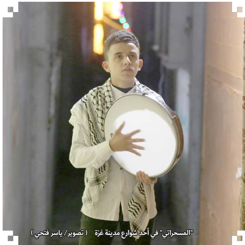
"المسحراتي" في أحد شوارع مدينة غزة

بهذه التجربة يستنتج "باريت" أن الأطفال، في سن مبكرة، لا يكونوا قادرين فقط على تمييز العوامل الفاعلة وعاتيتها، بل إنهم يعتبرون العلامات الملموسة -الصوت والضوء المتزامنين للكرة- دليلاً على وجود شيء يستدعي الاهتمام، ما يعني أن العامل الفاعل لا ينحصر في البشر المرئيين فقط، وأن ثمّ دلالات تنبّهنا لوجود فاعل غير مرئي قادر على صنع الأحداث، قد تبدو هذه الخاصية الفطرية كافية للتفكير في الإله، بالتأمل في الخلق، غير أن ميرة أخرى تجعل من الإيمان أكثر قرباً من فطرتنا، وهي إصرارنا -منذ الطفولة- على اكتشاف الغاية والتصميم في العالم المحيط.