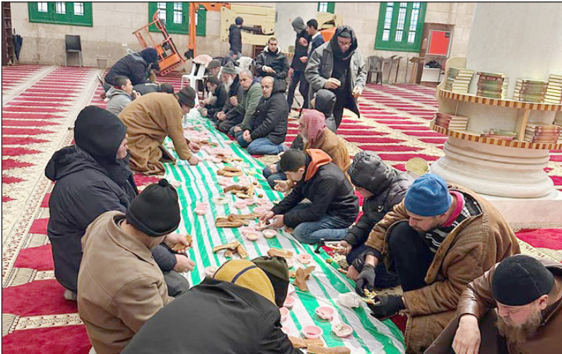
مواطنون يتناولون طعام الإفطار في المسجد الأقصى المبارك

المخططات الصهيونية في أخطر مرحلة منذ بداية الاحتلال، ويشكلون خندق الدفاع الأول عن كرامة الأمة وعزتها وشرفها، فلا بد للأمة الإسلامية من الانتصار لهم، وإسنادهم بالمهج والأرواح وكل غالٍ ونفيس".