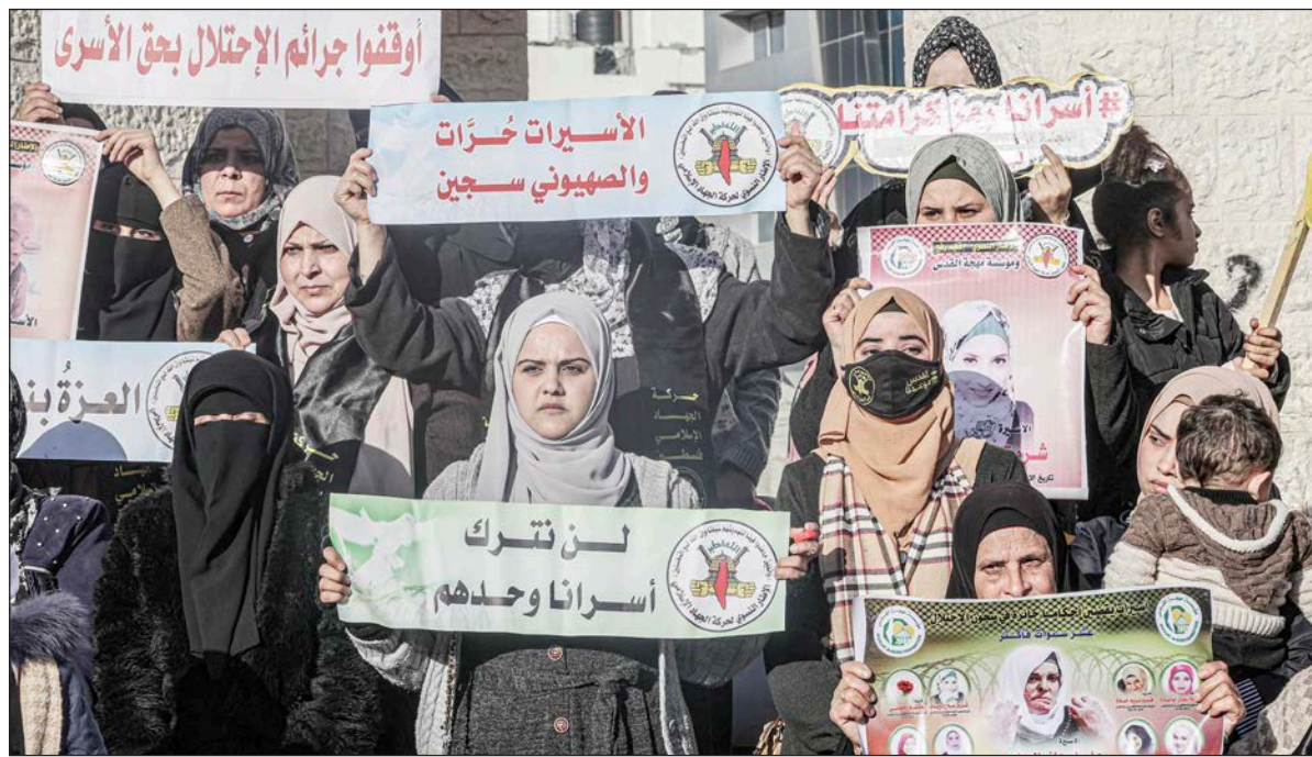
مشاركات في وقفة بمدينة رفح تضامناً مع الأسيرات في سجون الاحتلال أمس