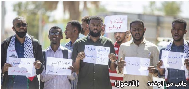
جانب من الوقفة (الأنافول)

ودعت الخوالة "أونروا" لإنهاء معاناتهم، وإعادة صرف بدل الإيجار التي أوقفتها عنهم، وتوفير سكن ضمن المشاريع التي يتم إقامتها بالقطاع، وتوفير فرص عمل لهم.