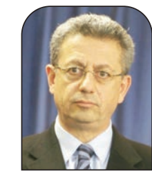
مصطفى البرغوثي العربي الجديد

ولأن هذا الصعود عدّ ذروة القوة بالنسبة للمشروع الاحتلالي والاستيطاني، خاصة وأن رموزه لم يكفوا عن وعودهم لأصاغرهم ووعيدهم للفلسطينيين، فقد جاء العمل الفدائي الأخير في الذروة المكافئة ليفكت الحلم الكاذب، ويخرس الخطاب الاستيطاني المتبجح، فالأمن الموعود بواسطة قبضة أمنية أشدّ، واقتطاع متواصل للقدس عن محيطها، لم يكن إلا بناء واهما على مقدمات خاطئة أولها: الاعتقاد