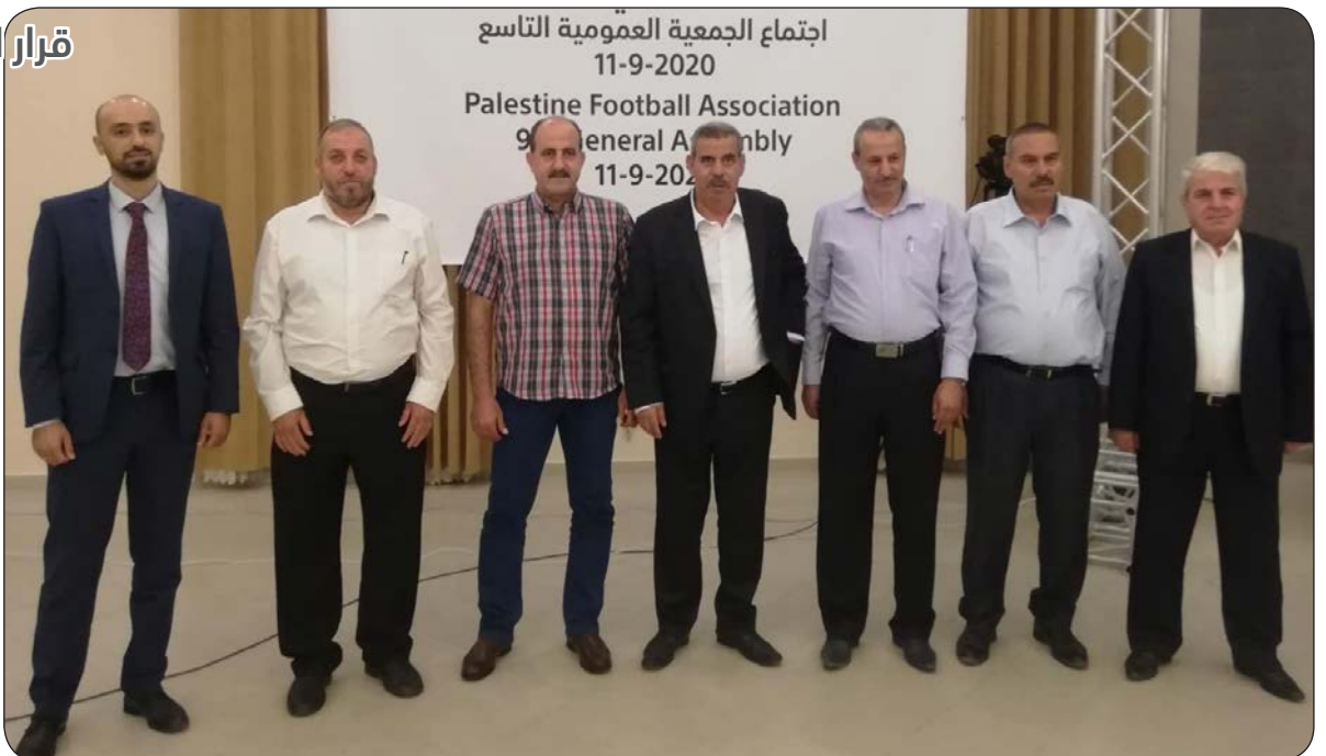
قرار استكمال الدوري دون جمهور

وأشار هنية خلال الاجتماع إلى أن حالة التوافق الرياضي التي تعيشها الأندية في ظل الانقسام السياسي هي إنجاز مهم يجب التمسك به من أجل حماية الرياضة، مشدداً على أن الأندية هي الملاذ الآمن للشباب بعيداً