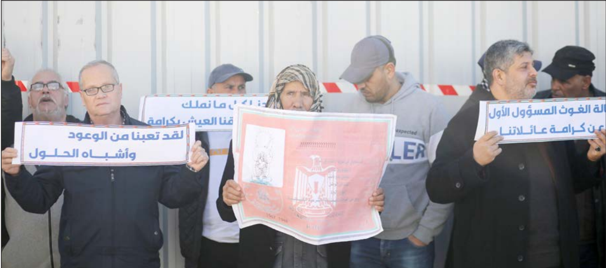
جانب من وقفة للاجئين الفلسطينيين القادمين من سوريا إلى قطاع غزة أمام مقر أونروا