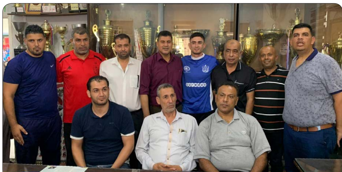
قرار استكمال الدوري دون جمهور

وقال اتحاد الكرة إن مجلس إدارته سيقى في حالة انعقاد دائم لمتابعة وتقييم الحالة الميدانية لتداعيات الأزمة في الفترة الحالية. وفي نفس السياق أعلن الاتحاد إعفاء لجنة الحكام من مهامها على أن يتولى المكتب التنفيذي للاتحاد مهمة الإشراف على الحكام، وذلك على ضوء