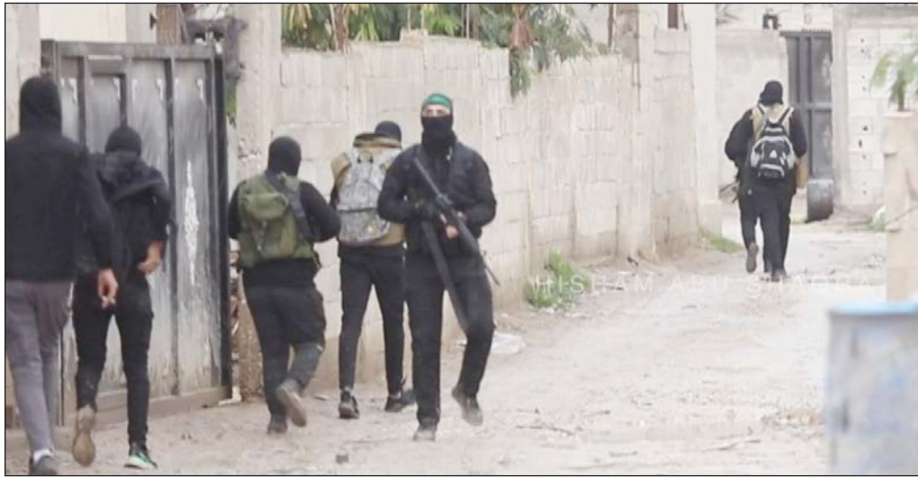
مقاومون في عقبة جبر يتصدون لاقتحام قوات الاحتلال

ودعت الأهالي بالقرى المجاورة إلى "صب جام غضبهم على الاحتلال، وإشغال نقاط التماس".