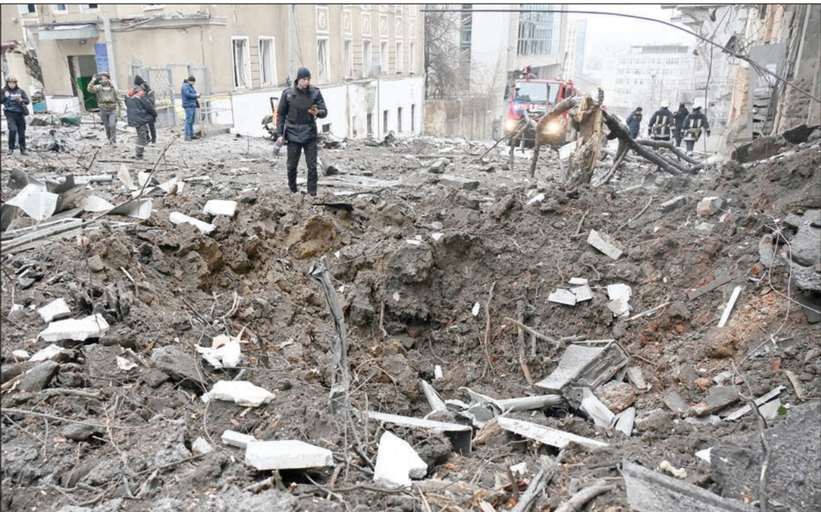
آثار قصف صاروخي روسي على خاركييف أمس

أطلقت روسيا عملية عسكرية في أوكرانيا، تبعتها ردود فعل دولية غاضبة وفرض عقوبات اقتصادية ومالية "مشددة" على موسكو. وتتشترط روسيا لإنهاء العملية بينها حلف شمال الأطلسي