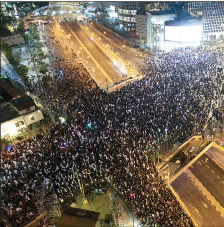
جانب من التظاهرات أمس

غزة/ فلسطين: أفادت الهيئة العامة للمعابر والحدود في وزارة الداخلية والأمن الوطني، بمغادرة 13073 شخصاً ووصول 12107 وافدين عبر حاجز بيت حانون الأسبوع الماضي. وأوضحت الهيئة العامة، في إحصائياتها، أمس، أن المغادرين توزعوا إلى 12885 مواطناً، و111 أجنبي و77 من فلسطيني الداخل. وذكرت أن أعداد الوافدين إلى غزة توزعت بين 11930 مواطناً، و123 أجنبياً، و47 من فلسطيني الداخل، و7 وفيات ممن كانوا يتعالجون في الضفة والداخل المحتل.