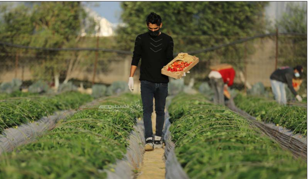
مزارع يحصد ثمار الفراولة ( فلسطين )

وأضاف مي لصحيفة "فلسطين" أن الجمعية تتابع عملية النمو مع المزارع وتساعد على بيع إنتاجه في السوق المحلي بغزة وفي أسواق الضفة الغربية، مشيراً إلى أن الفراولة كانت تصل في سنوات سابقة إلى أسواق