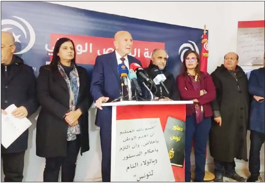
مؤتمر جبهة الخلاص في تونس

بوغوتا/ وكالات: ضرب زلزال بقوة 6.4 درجات على مقياس ريختر شمال الأرجنتين. وأوضح مركز المسح الجيولوجي الأمريكي في بيان أمس، أن مركز الزلزال يبعد عن مدينة سانتياغو ديل استيرو 116 كيلومترا. وأضاف البيان أن عمق الزلزال بلغ 589