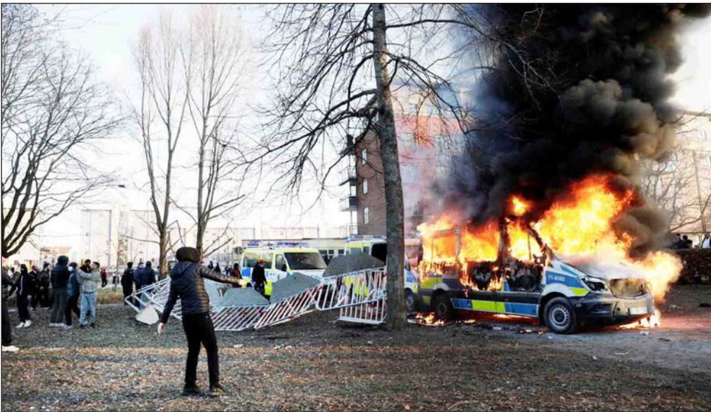
متظاهرون يحرقون سيارات الشرطة ردًا على حرق المصحف في السويد

نسخة من المصحف الشريف أمام مبنى سفارة الجمهورية التركية في العاصمة ستوكهولم. وقال المتحدث باسم حماس حازم قاسم: إن هذا الفعل استفزاز لمشاعر كل المسلمين، وعدوان سافر على عقيدتهم. وأضاف قاسم في تصريح صحفي: إنه سلوك متطرف من شأنه نشر الكراهية والتحريض على العنف وإيجاد بيئة خصبة للتشدد. وطلب المتحدث باسم حماس المجتمع الدولي بتحمّل مسؤولياته لوقف مثل هذه الأعمال المستنكرة ونبذ جميع أشكال الكراهية والتطرف ومحاسبة مرتكبيها، داعياً السويد لتقديم الاعتذار للمسلمين على هذه الجريمة. في غضون ذلك أدانت الكويت، إقدام متطرف على حرق نسخة من القرآن الكريم في السويد. جاء ذلك في تصريح لوزير الخارجية الكويتي الشيخ سالم عبد الله الجابر الصباح، نقلته وكالة الأنباء الكويتية (كونا). وبحسب الوكالة الكويتية، عبّر وزير الخارجية الكويتي عن "إدائه واستنكاره الشديد لقيام أحد المتطرفين بحرق نسخة من المصحف الشريف أمام مبنى سفارة الجمهورية التركية في العاصمة