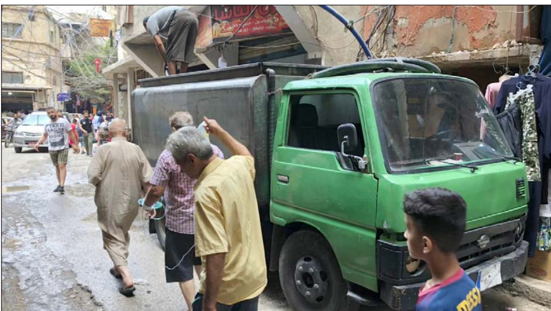
فلسطينيون يقومون بنقل المياه إلى منازلهم في مخيمات لبنان (أرشيف)

ويعيش 174 ألفاً و422 لاجئاً فلسطينياً، في 12 مخيماً و156 تجمعاً في محافظات لبنان، وفق إحصاء أجرته إدارة (الإحصاء المركزي اللبناني) عام 2017.