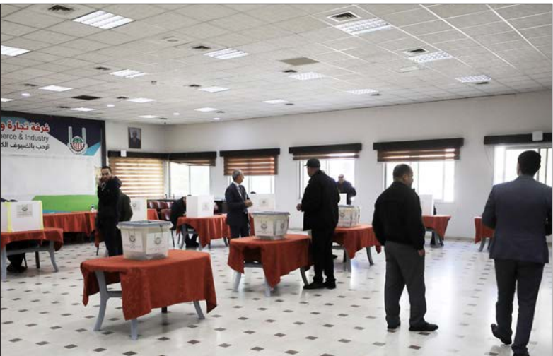
جانب من سير العملية الانتخابية

وعبر الزريعي خلال تفقده سير العملية الانتخابية في غرفة تجارة وصناعة محافظة غزة، عن سعادته لحالة التوافق بين الوزارة