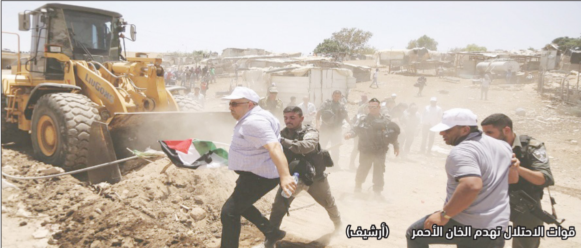
قوات الاحتلال تهدم الخان الأحمر (أرشيف)

مرور 30 يومًا على وفاة الزعيم الروحي لتيار الصهيونية الدينية الحاخام حاييم دروكمان. ومن المتوقع أن تُنفذ حكومة الاحتلال قرار هدم القرية في المدة القريبة المقبلة، بعد أن وافقت محكمة الاحتلال "العليا" بناءً على طلب من منظمة "ريغافيم" الاستيطانية، التي يرأسها رئيس "حزب الصهيونية الدينية"، وزير المالية يتسئيل سموريتش.