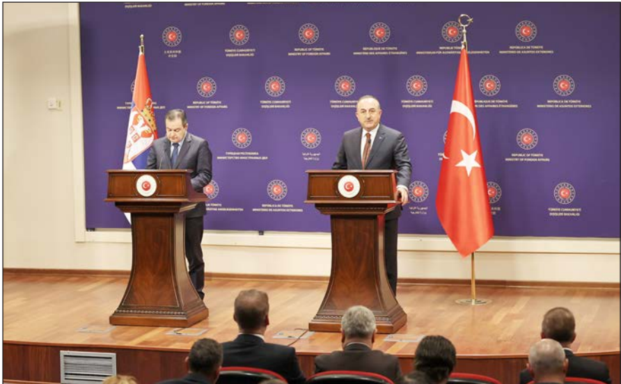
جانب من المؤتمر في العاصمة أنقرة أمس (الأناضول)

أنقرة/ الأناضول: قال وزير الخارجية التركي مولود تشاوش أوغلو، إن الحكومة السويدية تعد شريكة في حادثة حرق نسخة من القرآن الكريم لسماعها بهذا العمل الدنيء. جاء ذلك في مؤتمر صحفي مشترك مع نظيره الصربي إيفيكا داتشيتش، بالعاصمة أنقرة أمس. وأفاد تشاوش أوغلو أن هذه الحادثة تعد جريمة كراهية وفعلا عنصريا، وليست حرية تعبير كما يريد البعض أن يفسرها. وأضاف: "إذا كانت السويد تقول 'أنا الآن دولة عنصرية راديكالية. لذلك غدوت دولة معادية للإسلام، الإسلاموفوبيا والعنصرية مسموحة' فهذا شأنها، لكنه أيضا مخالف لاتفاقيات المجلس الأوروبي". وأوضح أن حادثة حرق المصحف تخالف أيضا معايير الاتحاد الأوروبي.