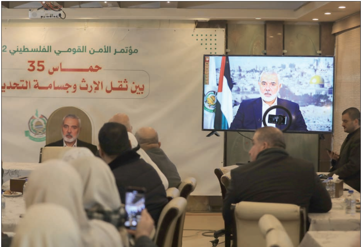
جانب من المؤتمر في غزة أمس

مستوى المنطقة، إذ إن "ما بين بؤر التوتر والصراع وما بين سياسة التسويات بين الدول العربية والإسلامية يوشّر في أن المنطقة ذاهبة لتموضعات جديدة".