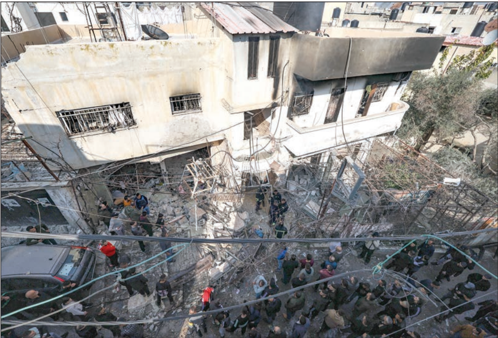
الدمار الذي حلّ بالمنزل الذي حاصره الاحتلال وغارتل فيه بعد اقتحام مخيم جنين أمس

قطر تدعو لمحاسبة قادة الاحتلال على جرائمهم