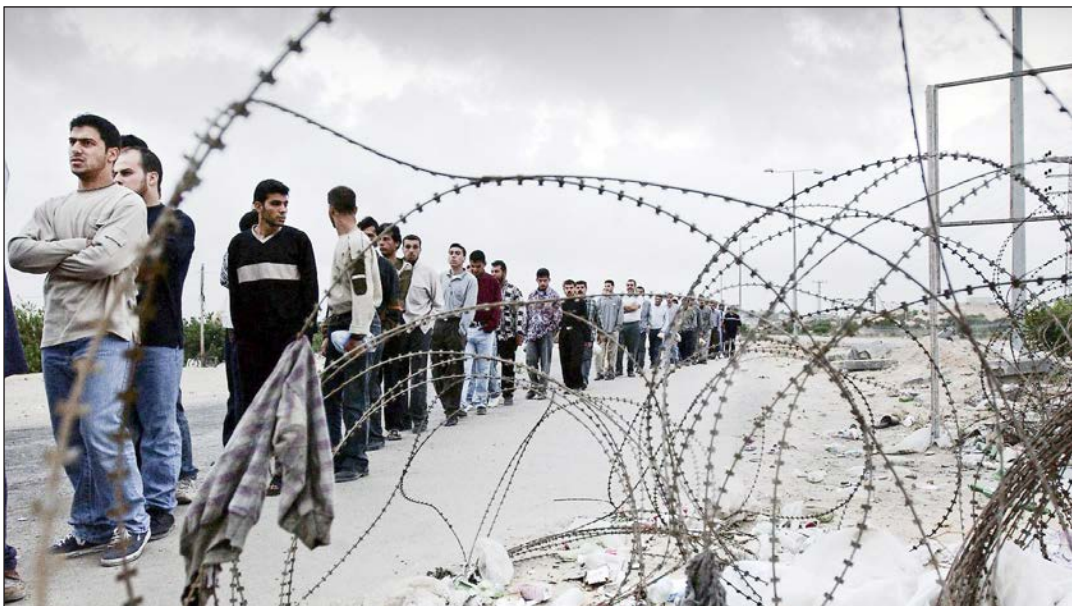
عمال من قطاع غزة في أثناء توجيههم للعمل في الداخل المحتل