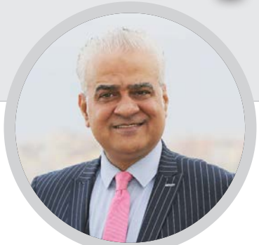
كُتب/ خالد أبو زاهر:

كلما أحاول عدم معرفة ما يدور في اجتماعات الهيئات الرياضية الرسمية لقناعة بأننا لن نرى تطوراً أو تقدماً في ظل العقلية والفكر المتمرس عند نقطة الآن ومن بعدي الطوفان، التي ينتهجها رئيس الكل الرياضي الفلسطيني الفريق جبريل الرجوب، أجد أنه من الضرورة وضع الشارع في صورة الاستخفاف الجديد أو الاستخفاف المتكرر من الفريق وفريقه بالشارع الرياضي والكادر الرياضي الفلسطيني.