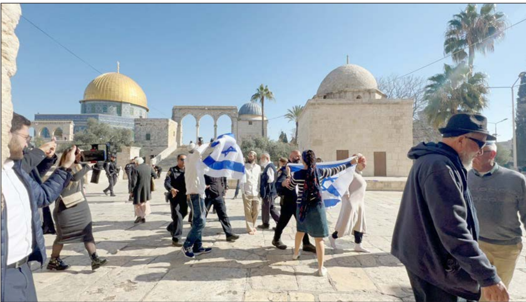
مستوطنون يرفعون أعلام الاحتلال في باحات المسجد الأقصى أمس

الشيخ صلاح: جهود الاحتلال لفرض واقع جديد في المسجد مصيرها الفشل