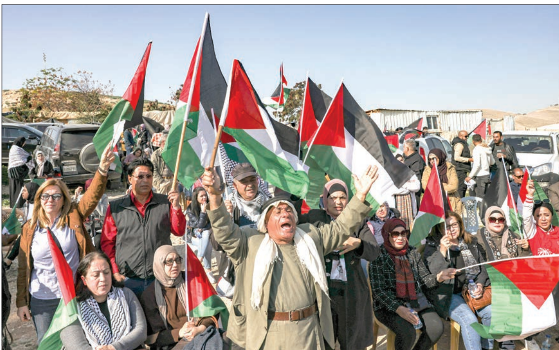
مواطنون ونشطاء يحتشدون في الخان الأحمر أمس دعماً لأهله ورفضاً لتجديدهم وهمدمه