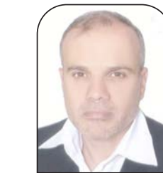
حازم عياد السبيل الأردنية

أفادت مصادر إخبارية بتقديم حزب "الليكود" الفاشي شكوى قضائية ضد مظاهرة يسارية، ادعى أنها حرضت على اغتيال رئيس وزراء الاحتلال بنيامين نتنياهو، وشبهته بهتلر. جاء ذلك على خلفية التظاهرة التي شارك فيها أكثر من 100 ألف من المحتجين على حكومة نتنياهو الفاشية العنصرية، ومشروع قانون وزير القضاء ياريف ليفين لإضعاف الجهاز القضائي، وتعهد نتنياهو التأخر أربعة أيام في إقالة وزير الصحة والداخلية أرييه درعي زعيم حزب شاس؛ استجابة لقرار المحكمة العليا، الأمر الذي استجاب له نتنياهو ظهيرة يوم الأحد 22 كانون الثاني، على أمل التخفيف من الأزمة المرذوجة داخليًا في حكومته، وخارجيًا مع أقطاب المعارضة التي لجأت إلى الشارع لإسقاطه. حرب الشوارع والساحات العامة التي انتشرت في جميع أرجاء فلسطين المحتلة، من تل الربيع (تل أبيب) إلى بئر السبع، وحيفا والقدس المحتلة بالقرب من مقر إقامة نتنياهو -تطور يومًا بعد الآخر، وتزداد سخونة مع إصرار المتظاهرين على الاحتشاد يوم السبت.