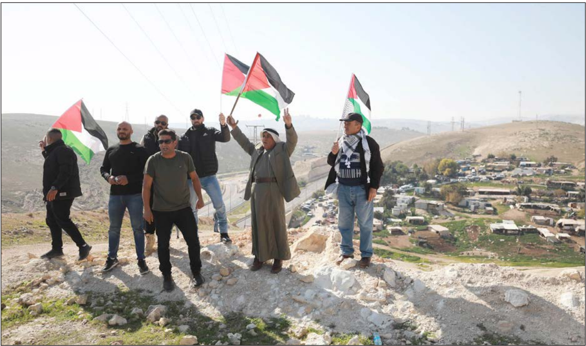
مواطنون يشاركون في وقفة بالخان الأحمر رفضاً لهدمه أمس

القدس المحتلة-غزة/ فلسطين: دعت شخصيات وفصائل، أمس، إلى حشد جماهيري مكثف وواسع، وإلى الرباط في تجمع "الخان الأحمر" البدوي شرق القدس المحتلة، للذود عنه والحوّل دون تنفيذ مخططات الاحتلال ومستوطنيه بهدم القرية وترحيل سكانها قسراً.