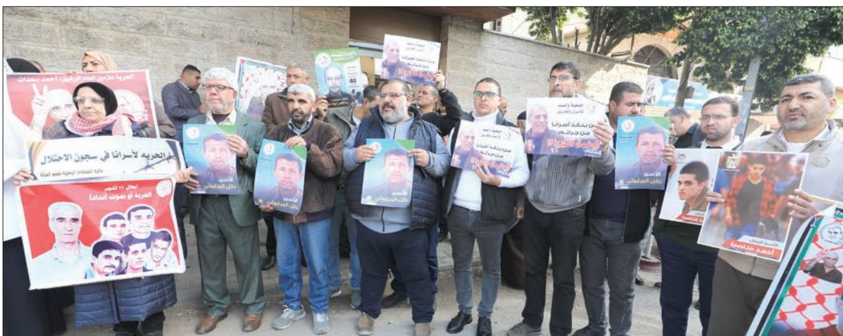
فعالية تضامنية مع الأسرى في غزة أمس