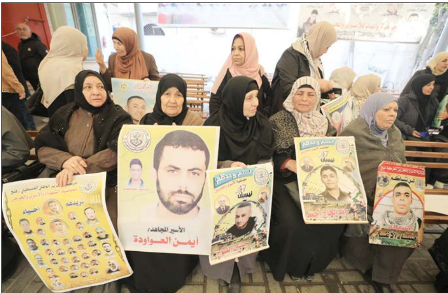
جانب من الاعتصام الأسبوعي لأهالي الأسرى

القوانين التي تجاوزها المحتل وانتهكها بصلفه وعدوانه. ودعت إلى تجريم المحتل دولياً، مبيّنة أن قضية الأسرى والمسجد الأقصى بحاجة ماسة إلى دعم العرب والمسلمين مادياً ومعنوياً، باعتبارهم امتداداً للدم والهوية. وأشادت القيادية في حماس بدور المقاومة وجهودها الهادفة إلى تحرير الأسرى من خلف قضبان السجون، مضيفة: إن المقاومة بجميع أطيافها تتخندق في خندق واحد لتبييض السجون، وفي أيديها أوراق ضغط تجعل المحتل يركع لتنفيذ شروطها صاغراً"، في إشارة إلى 4 من جنود جيش