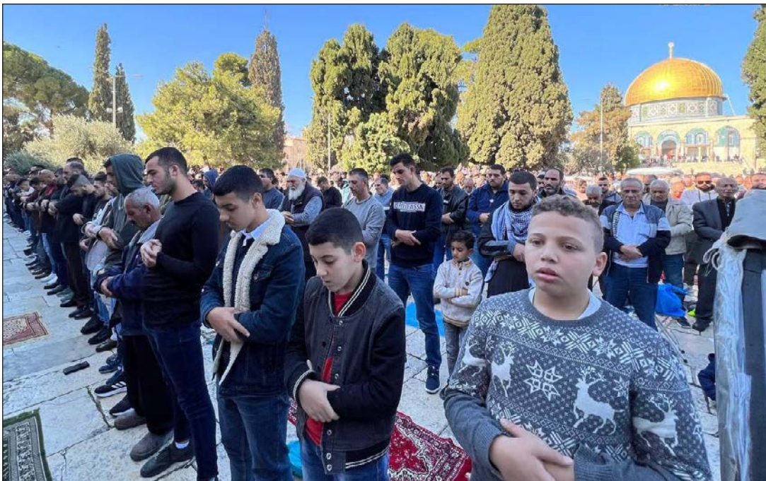
مصلون يؤدون الجمعة في باحات المسجد الأقصى أمس (فلسطين)

وتابع: "لقد قالوا كلمتهم الإيمانية الموحدة في قطر التي تضم ممثلي العالم في إطار مباريات كأس العالم". وكان عرب ومسلمون ومحبون للقضية الفلسطينية رفعوا العلم الفلسطيني في أكثر من مناسبة خلال متابعتهم مباريات كأس العالم في العاصمة القطرية الدوحة، كما رفعوا العلم في الشوارع وهتفوا لفلسطين والقدس في العديد من المناسبات. وعد الشيخ صبري أنه بذلك، "تبخر