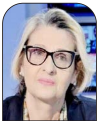
آسيا العزروس رأي اليوم

ولا شك أنه عندما تعتبر ليندا توماس غرينفيلد، مندوبة أمريكا لدى الأمم المتحدة، إن العام الجاري هو الأكثر دموية بالضفة الغربية منذ العام 2004 فهذه حقيقة لا غبار عليها، لكن أن تنجبه المسؤولية الأمريكية الى المطالبة "بالاقتصاد بعدل من كل من يرتكب أعمال عنف، سواء أكان فلسطينيا أم إسرائيليا على اعتبار أنه لا أحد من مجموعة فوق القانون" فهو بالتأكيد اصرار على إنكار الحقائق ومجانبة للصواب وتوجه نحو المساواة بين الضحية والجالد وإقرار بمبدأ العدالة العرجاء وسياسة المكيالين التي توجب الأوضاع و تدفع الى مزيد العنف و تشجع الالة العسكرية للاحتلال على مزيد الانتهاكات والجرائم ...لقد كان التصويت لصالح إقرار، وتحديد يوم 29 من نوفمبر 1977، يوما للتضامن العالمي مع فلسطين وشعبها، في ذكرى قرار التقسيم 1948، خطوة بالاتجاه الصحيح، ولكنه بقي مبتورا ...لقد شكل قرار التضامن العالمي مع الشعب العربي الفلسطيني صخرة أممية متأخرة.. لكنها خطوة هامة، و قد أن الألوان للمنظومة العالمية الاندفاع لترجمة وتنفيذ قرار التقسيم الدولي 1948 ولو بعد عقود من إقراره.