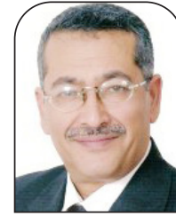
حمي الأسمر عربي 21

كيان العدو اليوم مأزوم وأزمته تفوق ربما ما تعانيه أمة العرب، ولكن هذا لا يعني أن ننتظر حتى ينفجر الكيان من الداخل، ربما تكون هذه فرصة تاريخية للمقاومة الفلسطينية، فلا حل مع هؤلاء الفاشيين إلا بتدفيعهم ثمن هذا الإجرام، وسقيهم من الكأس نفسها التي شربها أبناء فلسطين والأمة بأسرها.