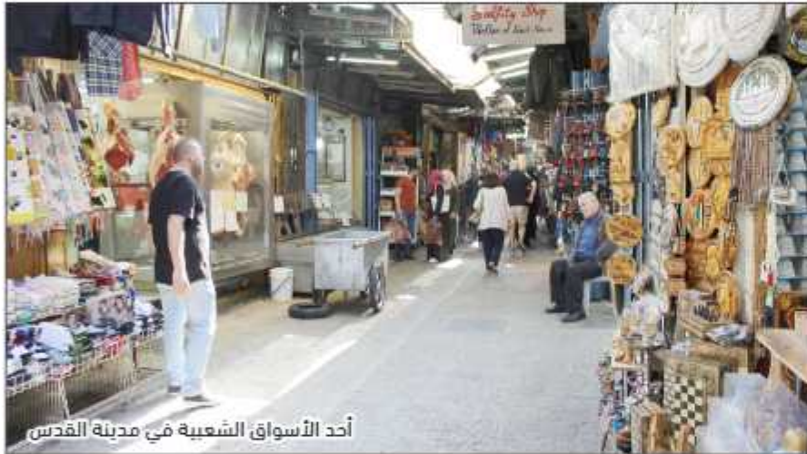
أحد الأسواق الشعبية في مدينة القدس

الفصل العنصري بخلاف اقتضائه من أراضي المواطنين وضمها للمستوطنات، عمق أيضاً من عزلة مدينة القدس عن المدن الفلسطينية الأخرى.