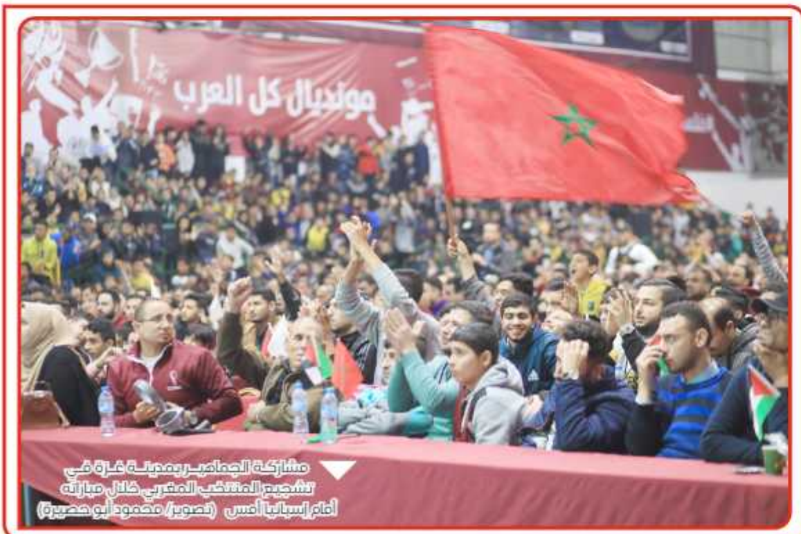
مشاركة الجماهير بمدينة غزة في تشييع النائب المغربي خلال جنازته أمام إسبانيا أمس