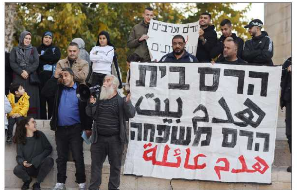
مقدسيون يشاركون في وقفة رفضاً لهدم المنازل