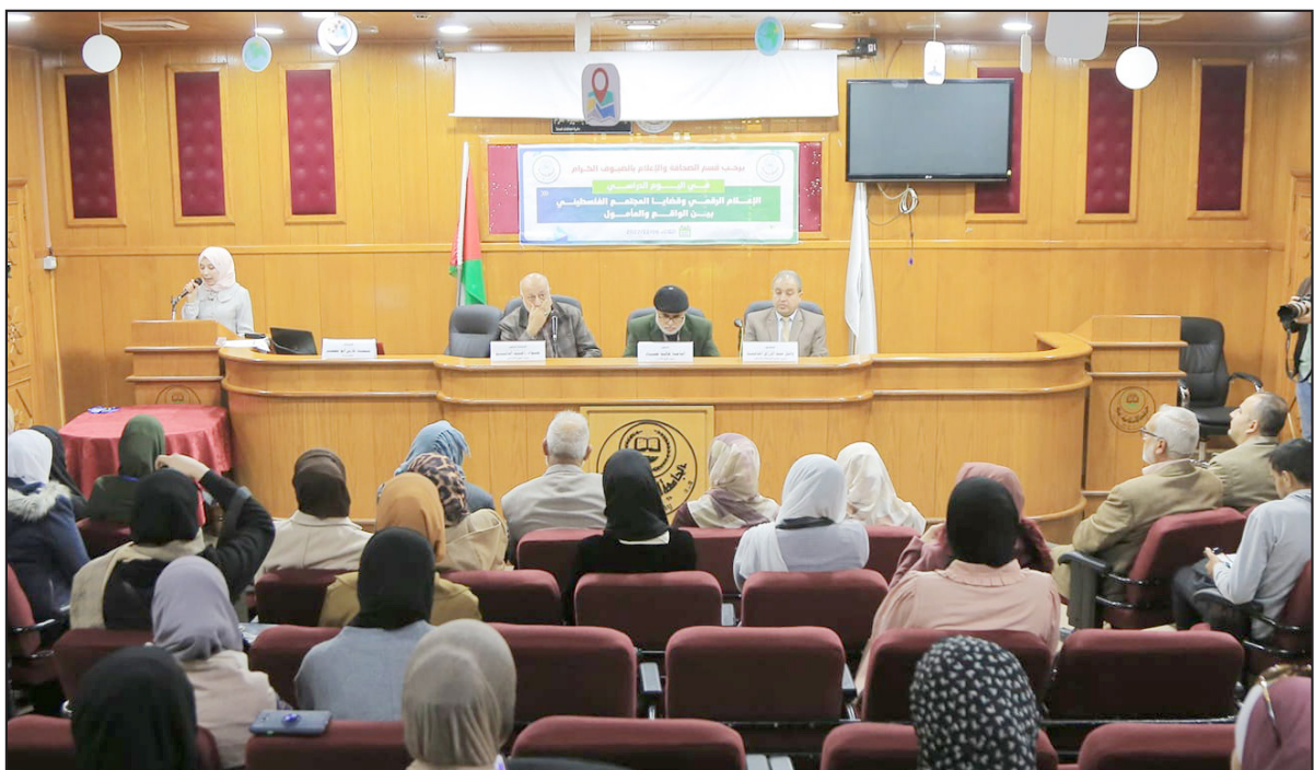
جانب من فعاليات اليوم الدراسي في الجامعة الإسلامية بغزة أمس

كما بينت أن خطابات الكراهية الأكثر رواجًا عبر وسائل الإعلام الرقمي، تتعلق بالأراء السياسية بنسبة 82.4 ٪، وبالمناطقية بنسبة 30.9 ٪، وبالسلوك الشخصي بنسبة 25.5 ٪، وباللأصل بنسبة 21.1 ٪. وأظهرت الدراسة أن غياب القوانين والتشريعات بشأن خطاب الكراهية، وتأثير الأحداث السياسية والانقسام الفلسطيني، وضعف الوعي المجتمعي بخطورة خطاب الكراهية، وضعف دور الصحفيين وقادة الرأي وتأثيرهم على جمهور وسائل الإعلام الرقمي، عززت انتشار خطاب الكراهية. وتضمنت الدراسة جملة من التوصيات للجهات الرسمية ولأقسام الإعلام الأكاديمية، ولنقابة الصحفيين وهيئات المجتمع المدني، ولوسائل الإعلام والصحفيين والمؤثرين. وأوصت الجهات الرسمية بسن قوانين وتشريعات محدثة للحد من خطاب الكراهية، والعمل على إدراج ملاحق تعليمية في المناهج الدراسية في المدارس للتوعية بخطاب الكراهية والحد منه. كما أوصت أقسام الإعلام الأكاديمية بإجراء مزيد من الدراسات لفهم مستويات خطاب الكراهية ومدى انتشارها، وتحليل مضامينها، والعمل أيضًا على اعتماد مفهوم وتعريف دقيق وواضح لخطاب الكراهية يراعي الخصوصية الفلسطينية.