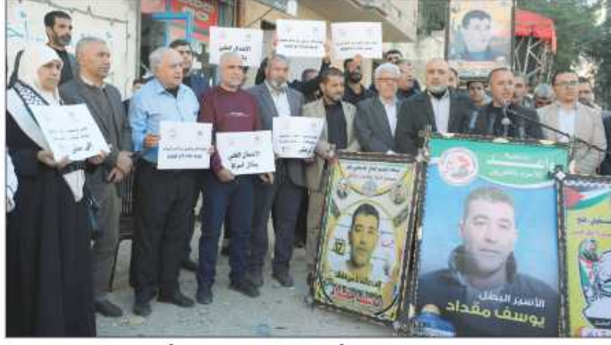
جانب من الوقفة في غزة أمس

لمستشفى الذي يرقد فيه الأسير يوسف للإطلاع على وضعه الصحي ومتابعة ملفه. ودعا جماهير الشعب الفلسطيني في الوطن والشتات للالتفاف حول قضية الأسرى وتفعيلها وخاصة المرضى الذين يعانون الأمرين داخل سجون الاحتلال.