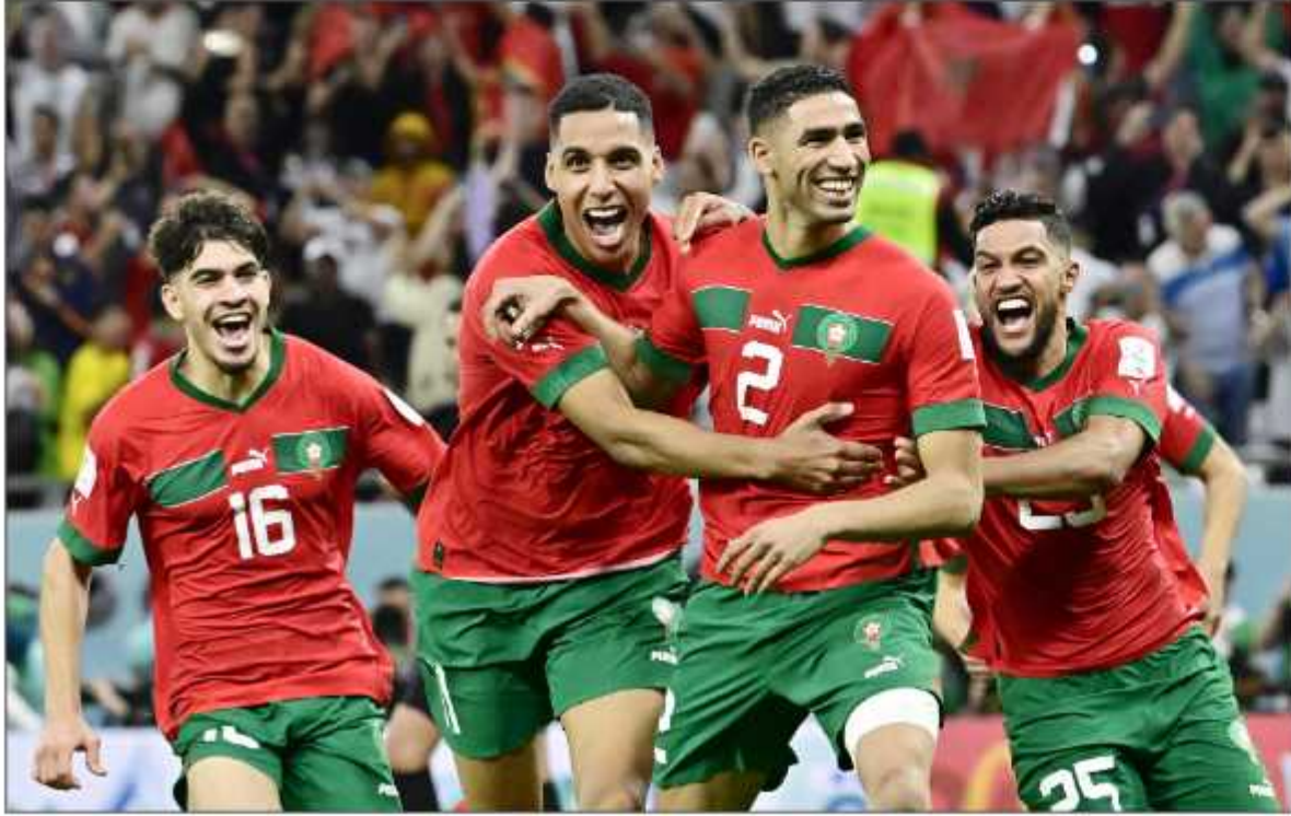
لاعبو منتخب المغرب يحتفلون بالفوز على إسبانيا

والسنغال (2002) وغانا (2010)، وذلك على حساب إسبانيا بطل كأس العالم (2010)، بعد تغلبه عليها أمس في دور الـ16 بركلات الترجيح (3-0) بعد انتهاء الوقت الأصلي للمباراة بالتعادل السلبي. وهذه أفضل نتيجة لمنتخب عربي في تاريخ المونديال، بعد بلوغ المغرب (1986) والسعودية (1994) والجزائر (2014) ثمن النهائي سابقاً. وهي المرة الثالثة التي تودع فيها