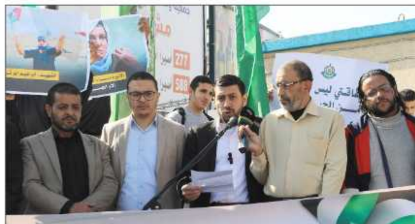
مواطنون يشاركون في الوقفة