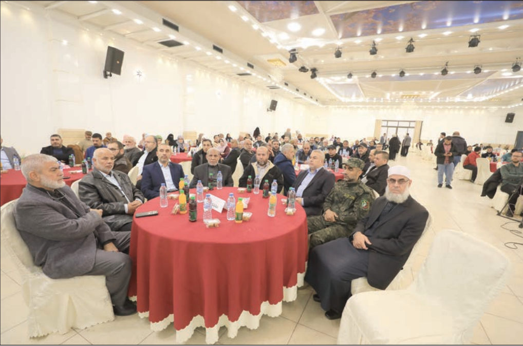
جانب من الحفل في غزة أمس