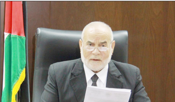
د. أحمد بحر

وشدد بحر في رسائل بعث بها لرؤساء البرلمانات والاتحادات البرلمانية الدولية، أمس، على أهمية إمداد غزة بمقومات الحياة الأساسية، والعمل على عزل الاحتلال وتجريمه على حصاره لغزة في جميع المحافل