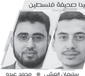
شهادا صحفية فلسطين

مجلس الخدمات المشترك لإدارة النفايات الصلبة في محافظات وسط وجنوب قطاع غزة