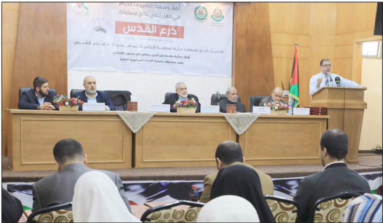
جانب من الحفل بمدينة غزة أمس