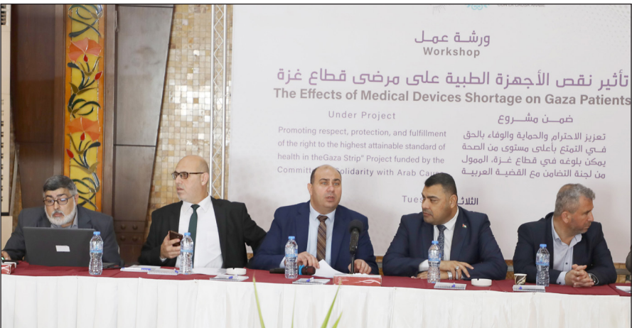
جانب من ورشة العمل بمدينة غزة أمس

نقص الأجهزة دفع وزارته إلى تحويل المرضى لتلقي الخدمة في الخارج. وجدد الفراء دعوة وزارته للمجتمع الدولي والمؤسسات الصحية الدولية والإسبانية للضغط على الاحتلال للسماح بإدخال الأجهزة لمنع الأزمات الصحية الناتجة عن منع إدخالها.