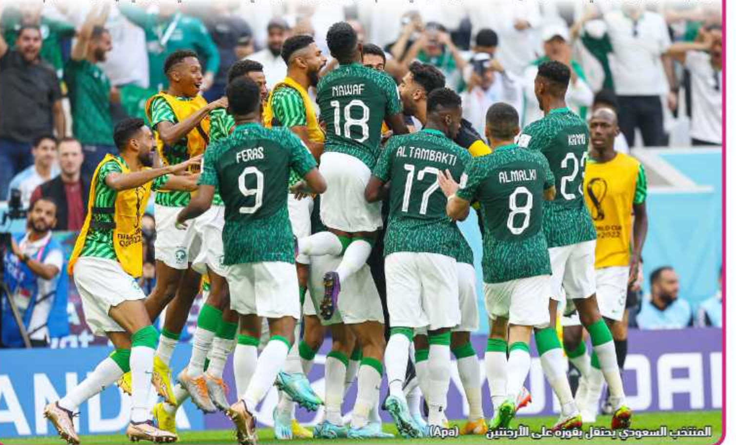
المنتخب السعودي يحتفل بفوزه على الأرجنتين

الوقت الإضافي. وسجل صالح الشهري وسالم الدوسري هدفي السعودية في الدقيقتين 48 و53 بعد أن منح ليونيل ميسي التقدم للأرجنتين من ركلة جزاء في