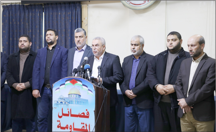
جانب من المؤتمر بمدينة غزة أمس

بلدة جبل المكبر في القدس وإقامة الحي اليهودي الممتد من تل رميدة إلى باب الزاوية. وقال رضوان: "أمام هذا التطرف نتخلى عنكم نحن رفاقا الدم والبندقية والمصير". ودعا رضوان، الأمة العربية والإسلامية والمجتمع الدولي إلى رفع الحصار الظالم عن شعبنا الفلسطيني في قطاع غزة، محملاً الاحتلال المسؤولية عن تداعيات استمرار الحصار الذي يمثل جريمة حرب ضد الإنسانية. وفي السياق، قال: "في يوم الطفل العالمي نترحم على أرواح شهداء أطفال فلسطين ونوجه التحية للمعتقلين منهم في سجون الاحتلال"، داعياً المنظمات الانسانية والحقوقية الدولية إلى ضرورة العمل على إطلاق سراحهم وملاحقة قادة الاحتلال لارتكابهم جرائم حرب ضد الإنسانية. كما ترحم على أرواح شهداء الحصار والنار من عائلة أبو ريا، معتبراً عن وقوف الفصائل بجانبهم في هذا المصاب الجلل.