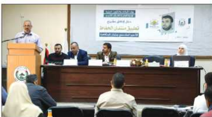
جانب من الحفل في غزة أمس