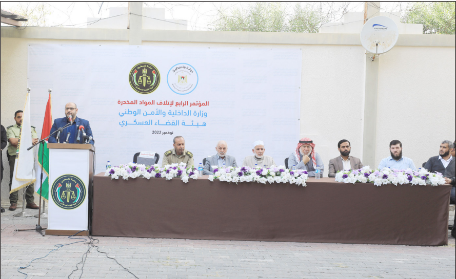
جانب من المؤتمر الصحفي بمدينة غزة أمس