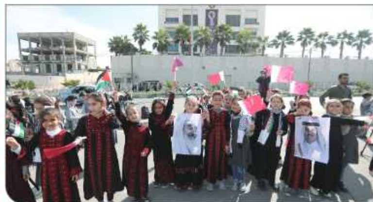
أطفال يشاركون في وقفة دعماً لقطر في غزة أمس

دولار امريكي = 3.46 شيفل | دينار اردني = 4.90 شيفل