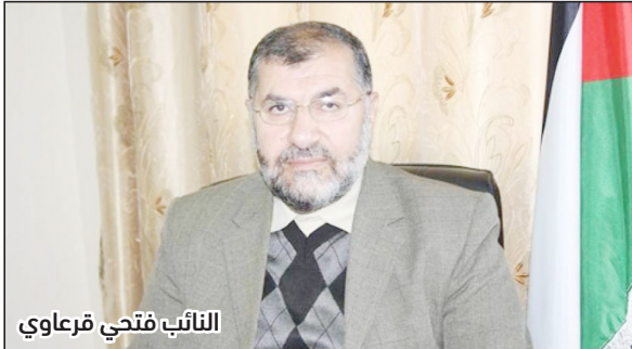
النائب فتحي قرعاوي