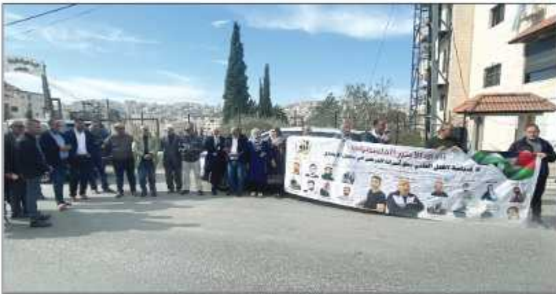
وقفة تضامنية مع الأسرى في بيت لحم أمس