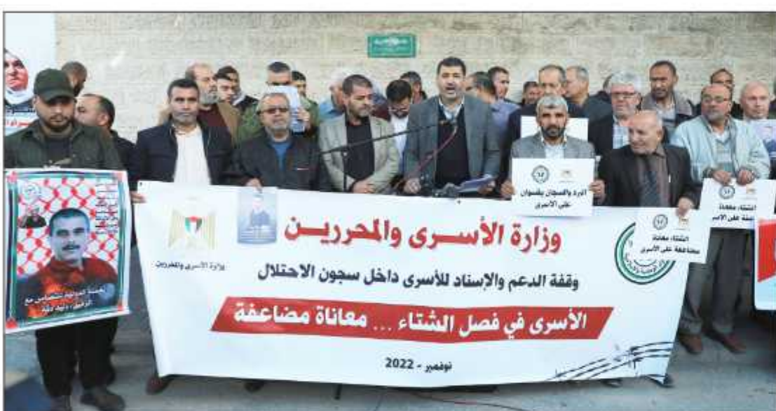
وقفة دعم وإسناد للأسرى في غزة أمس

غزة/ محمد الصفدي: نظمت وزارة الأسرى والمحربين ولجنة الأسرى للقوى الوطنية والإسلامية، وقفة دعم وإسناد للأسرى في سجون الاحتلال وللمطالبة بإدخال مستلزمات الشتاء، وتوفير وسائل التدفئة لهم داخل غرف وأقسام السجون. وشارك في الوقفة التي نظمت أمام مقر اللجنة الدولية للصليب الأحمر بغزة أمس، ممثلون عن الفصائل والمحررون وأهالي أسرى، رافعين صوراً للأسرى ومرددن هتافات مطالبة بالتدخل لإنقاذ حياتهم والضغط على الاحتلال لوقف ممارساته التعسفية بحقهم.