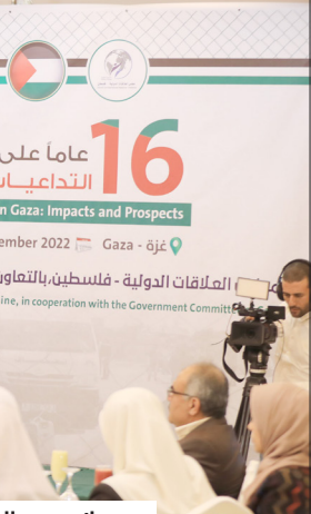
جانب من المؤتمر بمدينة غزة أمس

وأضاف الفراء خلال المؤتمر: أن الحصار استمر 16 سنة بدعم من الرباعية الدولية، وقد شكل عقاباً لأبناء شعبنا، بعد الانتخابات التشريعية التي أجريت بحضور مراقبين دوليين مطلع 2006. ولفّ إلى العجز في الطاقة الكهربائية الذي يصل إلى 50 بالمئة، وإلى إجراءات الاحتلال لسلب المياه الجوفية. وأكد أن الحروب العدوانية على غزة دمرت العديد من البيوت وأدت لارتفاع الآلاف، وتدمير البنى التحتية والمنشآت التجارية، ما فاقم الظروف المعيشية، منها إلى أن تقارير أممية أكدت أن غزة غير قابلة للحياة.