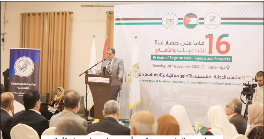
جانب من المؤتمر بمدينة غزة أمس