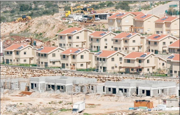
تسارع وتيرة الاستيطان في أحياء الضفة الغربية المحتلة

وفي جزء من الاتفاق الائتلافي المتبلور، كُلف "القوة اليهودية" بمسؤولية "تبييض وشرعنة 60 بؤرة استيطانية من الخليل، عليها، وذلك بعد 60 يوما من