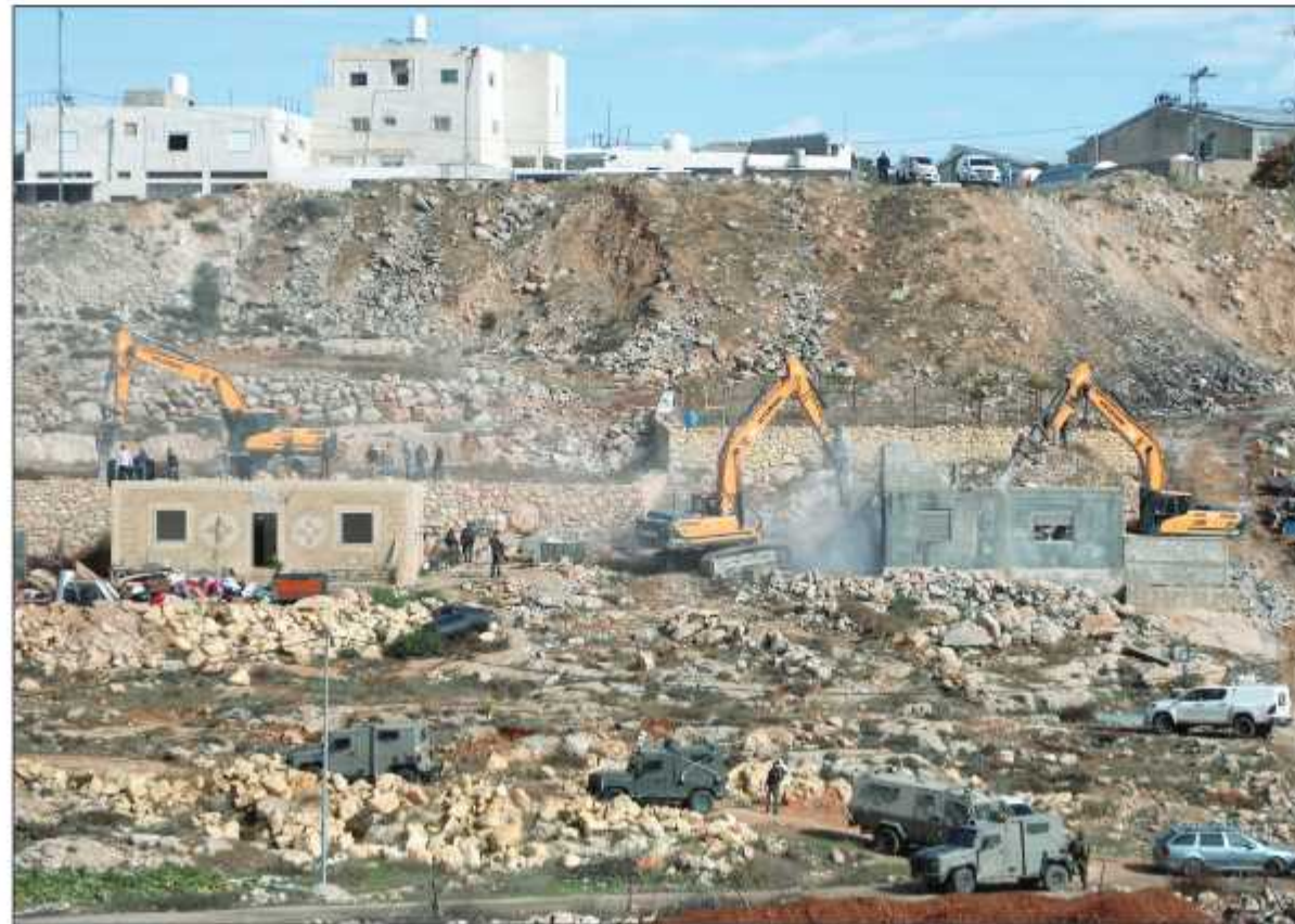
آليات الاحتلال تهدم منشآت في منطقة جبل جوفر بمدينة الخليل أمس

محافظات/ محمد الأيوبي: أصيب 8 مواطنين بالرصاص الحي، وصفت جراح اثنين منهم بالخطيرة، وآخرون بالاحتراق بالغاز، الليلة الماضية، خلال مواجهات مع قوات الاحتلال الإسرائيلي ببلدة بيت أمر في الخليل، في حين هدمت القوات 3 منازل ومنشأة في الضفة الغربية ومدينة القدس المحتلة، ونفذت حملة اعتقالات طالت 29 مواطناً، بينهم فتاة، و6 صيادين من قطاع غزة. وقالت جمعية الهلال الأحمر الفلسطيني إن طواقمها تعاملت مع 11 إصابة خلال مواجهات اندلعت بين عشرات المواطنين وقوات الاحتلال التي اقتحمت بلدة بيت أمر قرب الخليل. وأشارت في بيان لها إلى أن "من بين المصابين 8 بالرصاص الحي، منهم اثنان إصابتهما خطيرة، أحدهما أصيب في الرأس، والآخر في الصدر والرجل، و3 بحالات الاحتراق من جراء استنشاق الغاز المسيل للدموع".