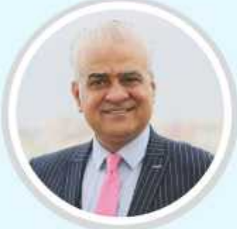
كتب / خالد أبو زاهر: