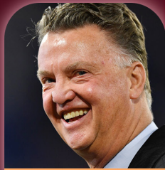
لويس فان غال