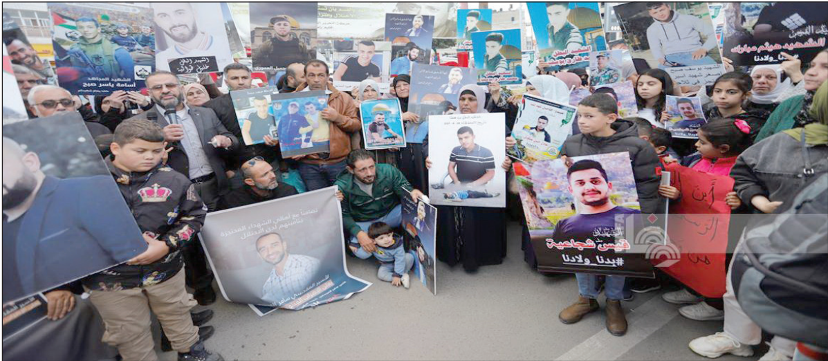
مسيرة للمطالبة باسترداد جثامين الشهداء المحتجزة لدى الاحتلال (أرشيف)

وكشفت وسائل إعلام إسرائيلية وأجنبية في السنوات الأخيرة عن 4 "مقابر أرقام"، إحداها في منطقة عسكرية عند ملتقى الحدود السورية اللبنانية، واثنان في منطقتين عسكريتين بغور الأردن، والرابعة شمال مدينة طبريا. وفي سبتمبر/ أيلول 2019، أصدرت المحكمة الاحتلال العليا قرارا يجيز للقائد المفقودين". العسكري الإسرائيلي احتجاز جثامين فلسطينيين قتلهم الجيش ودفعهم مؤقتا لأغراض استعمالهم "أوراق تفاوض مستقبلية". وينظم المواطنون في الـ27 من آب/ أغسطس من كل عام فعاليات لإحياء "اليوم الوطني لاسترداد جثامين الشهداء المحتجزة، والكشف عن مصير المفقودين".