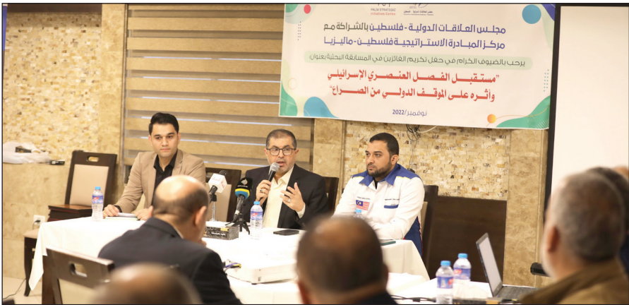
جانب من اللقاء في غزة أمس

وذكرت "رغد" أن الجنود قاموا بتعصيب عيناها وتقييد يديها ومن ثم نقلها بجيب عسكري إلى معسكر قريب، بقيت تنتظر هناك لساعات طويلة، وطوال تواجدها بالمعسكر لم تسلم الشابة من الشتم بأقذر المسبات من الجنود، وبعدها نُقلت إلى معيار "الشارون"، حيث رُجوا بها في الزنازين المليئة بالحشرات والبق والرطوبة الشديدة، كما حُرمت من أبسط حقوقها وحاجياتها الأساسية كالملابس ومواد التنظيف وغيرها.