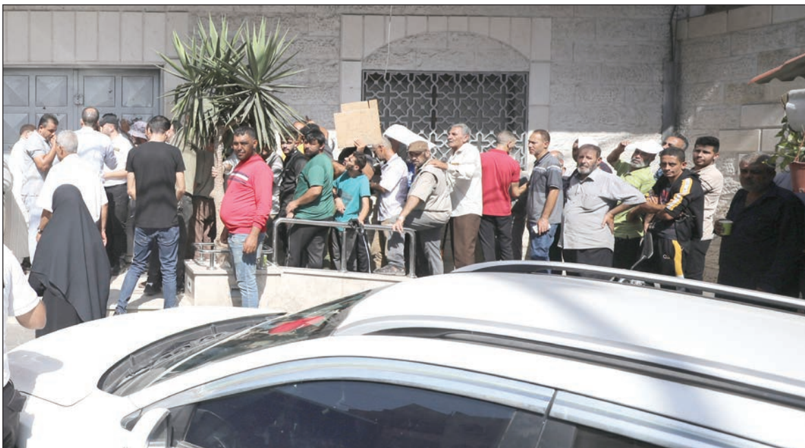
صرف شيكات الشؤون الاجتماعية أمس

يذكر أن وزارة التنمية الاجتماعية في رام الله توقفت عن صرف مخصصات الشؤون الاجتماعية منذ مطلع عام 2021 ولم تصرف سوى جزء من دفعة مرتين فقط الأولى منتصف العام الماضي والثانية قبل أشهر.