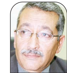
حملي الأسمر عربي 21

الضفة الغربية اليوم تعيش حالة مخاض، يصعب التنبؤ بما ستؤول إليه، خاصة مع زيادة وحشية المستوطنين وهجومهم المستفز والمستمر على الشجر والحجر والبشر والأقصى المبارك والمقدسات، ولعل الجانب الأكثر خطورة اليوم، أن هناك حراكا محموما غير مرئي تماما، وعلى أكثر من صعيد، يستهدف إنقاذ الاحتلال من تحول حالة الهيجان الفلسطيني إلى حالة انتفاضة من نوع جديد، وفق تعبير أحد المحليين الصهاينة، انتفاضة تجمع بين ما ميز كل من الانتفاضتين الأولى والثانية، من حيث الجمع ما بين المقاومة المسلحة والتحركات الاحتجاجية الجماهيرية الكبيرة، فضلا عن أن اشتعال نار الانتفاضة الثالثة قد يفتح الباب لدخول غزة وفلسطيني الداخل على خط المواجهة، وغير مستبعد أيضا اشتعال جبهة الشمال مع لبنان، وهو