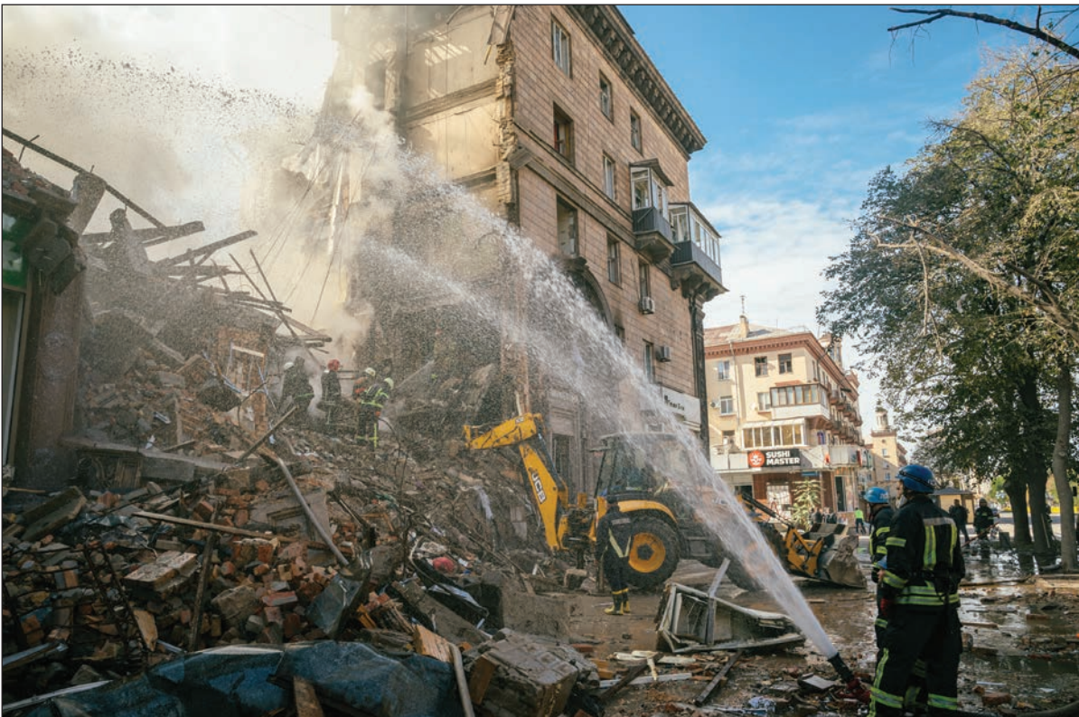
رجال إطفاء يخمّدون حريقاً بعد غارة على زاباروجيا أمس

وقد نشرت الوثائق الخاصة بهذه العملية على مواقع الإنترنت الرسمية للمعلومات القانونية الروسية. ووفقا لهذه القوانين، يُعترف بسلطان المناطق الجديدة على أنهم مواطنون روس.