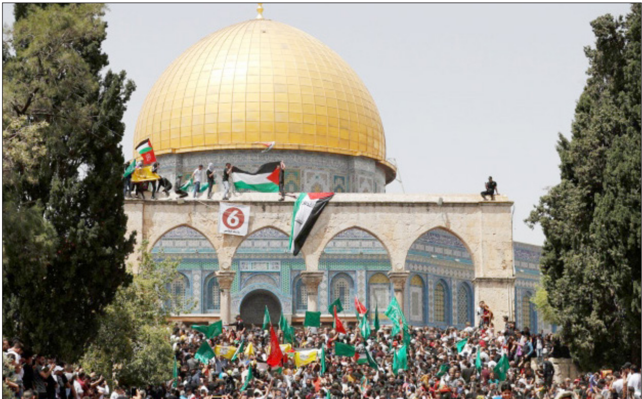
مrapبون داخل باحات المسجد الأقصى المبارك (أرشيف)

رحبت بدعوة الجزائر للمشاركة في الحوار الوطني الفلسطيني حماس: تكامل أدوار الأمة ودعم صمود شعبنا ومقاومته السبيل للتحرير