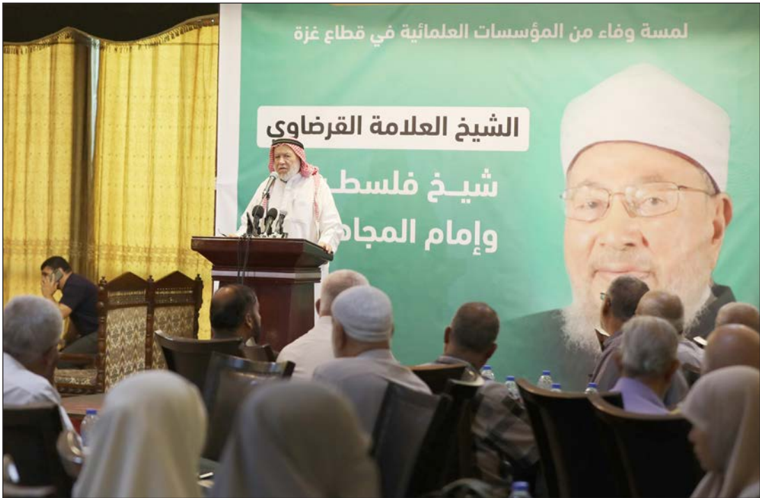
جانب من حفل التأيين بمدينة غزة أمس

ومواجهة تحديات الأمة، والتصدي للظلم والعدوان رغم السجن والتضييق الذي تعرّض له.