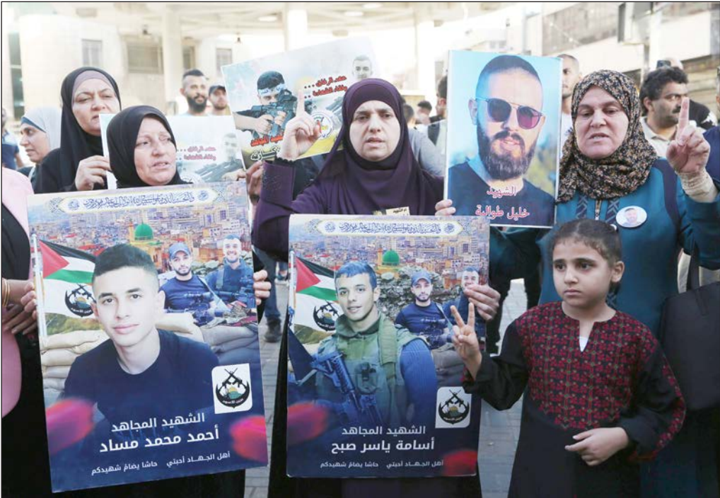
جانب من الوقفة أمس