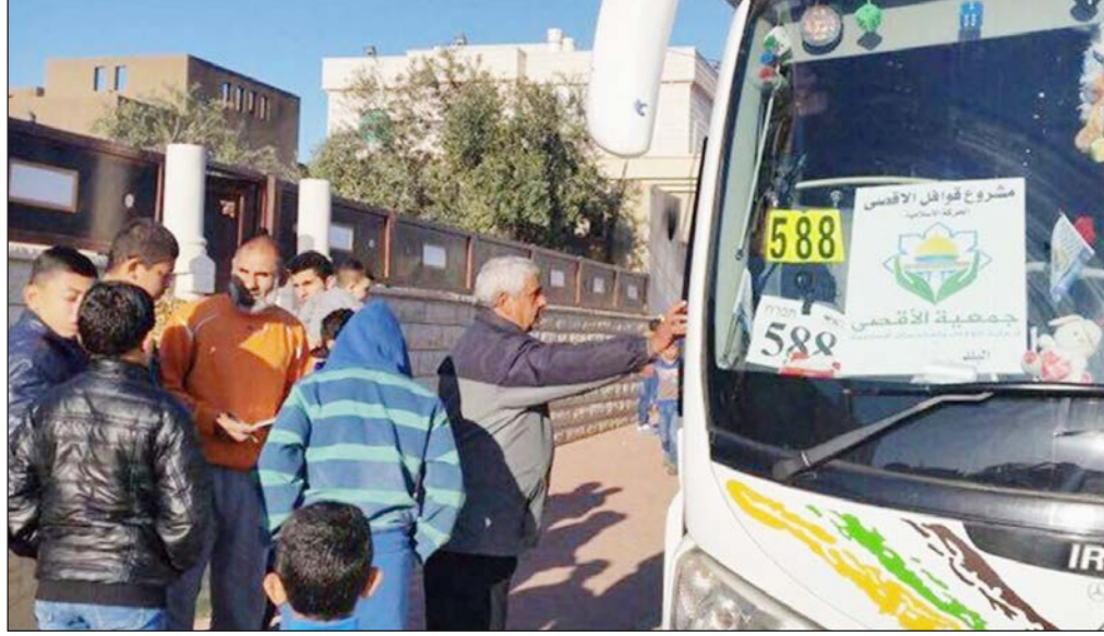
حافلات تنقل مصليين من الداخل المحتل للصلاة والرباط في باحات المسجد الأقصى المبارك (أرشيف)

وشدد: "لن نستقبل أو نتردد في التوجه إلى الأقصى والرباط فيه، فهو ثابت من ثوابت الأمة الإسلامية والشعب الفلسطيني"، قائلاً: "إذا منعنا شرطة الاحتلال كما العام السابق، سنفتش الأرض ونُغلق الباب الرئيسى الواصل بين القدس ومدينة الأقصى ومدينة القدس، عاداً أن الأقصى يمر بأخطر مراحله وقد يُفجر الأوضاع".