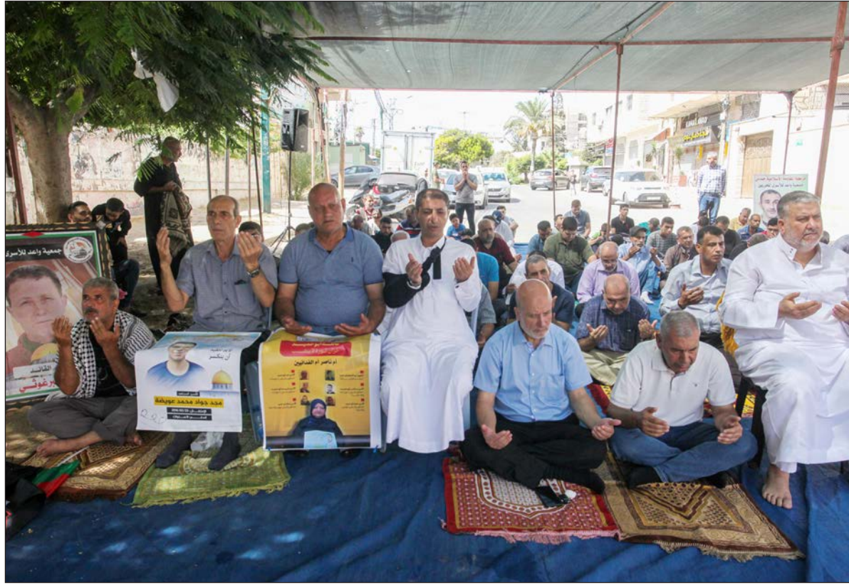
مواطنون يصلون الجمعة أمام مقر الصليب الأحمر تضامناً مع الأسير أبو حميد