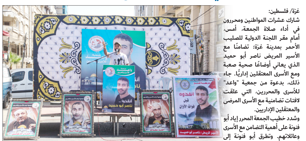
خطبة صلاة الجمعة أمام مقر الطيب الأحمر بغزة أمس خلال وقفة تضامناً مع الأسرى