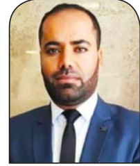
أحمد أبو زهري

تبدو مسألة خلافة عباس إحدى (أهم المعضلات) التي تواجه كلاً من: الأمريكيين، والإسرائيليين، وبعض الأنظمة العربية المعنية؛ وذلك نظراً لاعتبارات متعددة منها ما هو متعلق بالوضع الفلسطيني عامة وموقف القوى والفصائل الفلسطينية من هذه القضية، وما هو متعلق بالوضع الداخلي، فضلاً عن موقف رئيس السلطة نفسه الذي وعلى الرغم من تقدمه في السن وظروفه الصحية المتدهورة وعدم قدرته على قيادة السلطة كما السابق، فإنه ما زال "متمسكاً بكرسي" الرئاسة ولا يتصور إمكانية المغادرة الطوعية، أو حتى إزاحته في تلك الظروف، لذلك وفي مرات عدة يحاول إثبات أهليته للحكم ويقدم ولاء الطاعة باستمرار للاحتلال وللإدارة الأمريكية خشية من أن يجد نفسه خارج اللعبة.