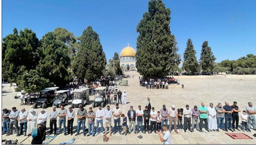
مصلون يؤدون صلاة الجمعة في باحات المسجد الأقصى المبارك (فلسطين)

وفي صباح 28 سبتمبر/أيلول، استشهد أربعة فلسطينيين وأصيب 44 آخرون، برصاص قوات الاحتلال خلال اقتحامها مخيم جنين، وفقاً لمعطيات وزارة الصحة الفلسطينية.