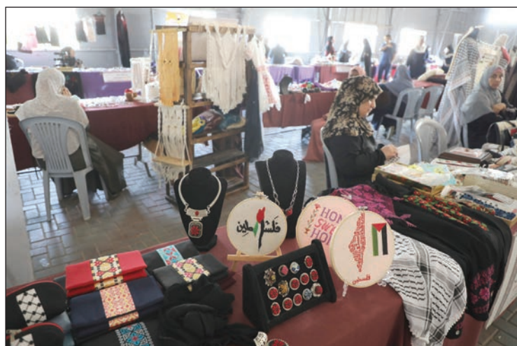
جانب من زوايا المعرض

في جوانب غير مطروقة كثيراً، فلم نركز في العمل على التطريز فقط بل أنتجنا مشغولات من الخرز والصوف". وتعيد الشنتف والعمالمت معها إحياء المشغولات اليدوية التي كانت جزءاً من الأعراس التراثية كباقات الورود و"الشعمدان" والكؤوس المزينة بالخرز الملصق بشكل يدوي عليها، وغيرها من الأشياء التي كادت تندثر.