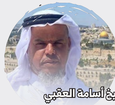
الشيخ أسامة العقبى

يُعد الشيخ رائد صلاح من الشخصيات القيادية القليلة المتفق عليها في فلسطين، وله تاريخ حافل في النضال من أجل المسجد الأقصى، حتى أطلق عليه لقب "شيخ القدس". أنشأ "صلاح" وحركته "مهرجان الأقصى في خطر"، حيث كشف المساعي الإسرائيلية لهدم المسجد الأقصى. وفي أول تصريح له عقب وصوله إلى المسجد الأقصى بعد الإفراج عنه وإبعاده لمدة 15 عاماً، قال من داخل المسجد القبلي: "قضية الإبعاد مؤلمة، نعم، ولكن لو اجتمعت كل قوى الاحتلال في كل العالم لن تستطيع أن تقطع الرباط القلبي بيننا وبين المسجد الأقصى".