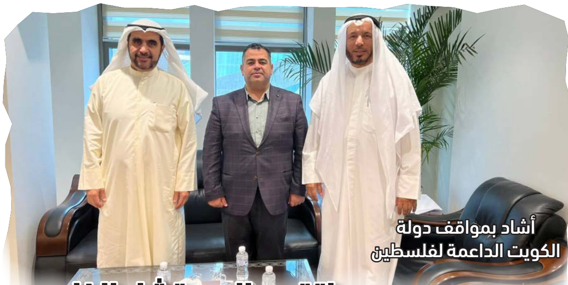
أشاد بمواقف دولة الكويت الداعمة لفلسطين