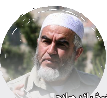
الشيخ رائد صالح