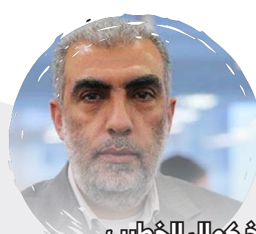
الشيخ كمال الخطيب

"ما يجري في المسجد الأقصى هو استباحة بكل ما تحمل الكلمة من معنى من قوات الاحتلال على كل ما هو مقدس، حيث يسعى الاحتلال إلى فرض الهوية اليهودية عليه بدلاً من الإسلامية". "أصبح دور أهلنا في الداخل المحتل رأس حربة في حماية هوية المسجد الأقصى المبارك بوجودهم وشد الرجال إليه ورباطهم فيه، خاصة في فترة الاقتحامات الإسرائيلية، لأنه كفيل بإفشال مخططات الاحتلال".