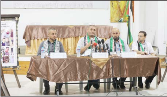
جانب من اللقاء بغزة أمس

وجدد أبو واصل مطالبة المؤسسات الفلسطينية في الضفة وغزة بالدعم المالي لجميع الأسرى وعلى رأسهم أسرى الداخل، مشددًا على أن القوى السياسية في الداخل شكلت بعد هبة الكرامة لجنة وطنية ووفرت بعض الدعم من عدة مؤسسات لكنها