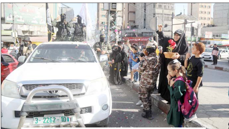
عرض عسكري لسرايا القدس بمدينة غزة أمس

جزء من عقيدتنا؛ لا يمكن التخلي عنها أو عن أي جزء منا، وواجب الأمة العربية والإسلامية وأحرار وعملت على تطوير جناحها العسكري "سرايا القدس". وأغاثل الموساد الإسرائيلي أمينها العام الأسبق الدكتور فتحي الشقاقي في مدينة سليما في مالطا عام 1995، وتولى بعده رمضان عبدالله شلح قيادة الحركة، وتوفي عام 2020، ليخلفه في القيادة زياد النخالة أمين عام الحركة الحالي.