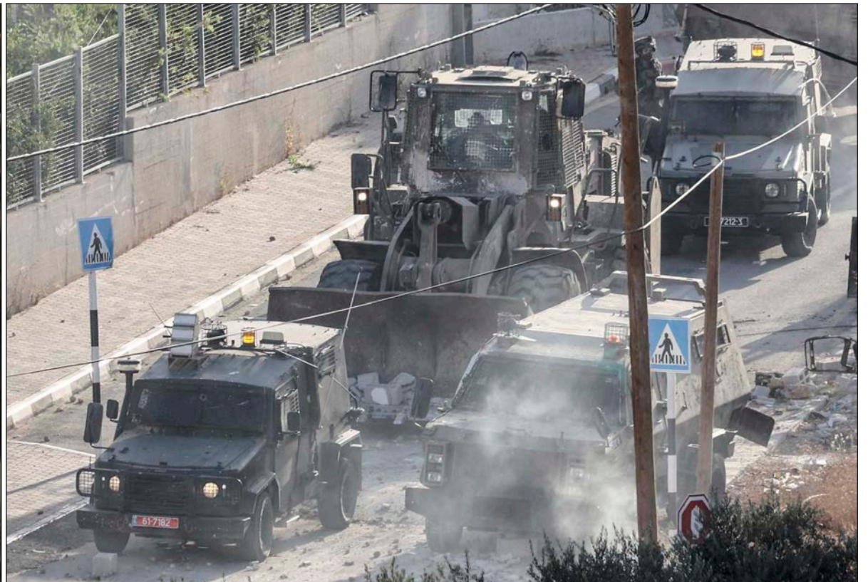
قوات الاحتلال تقتحم قرية دير الحطب شرق نابلس وتشتبك مع مقاومين (أ ف ب)