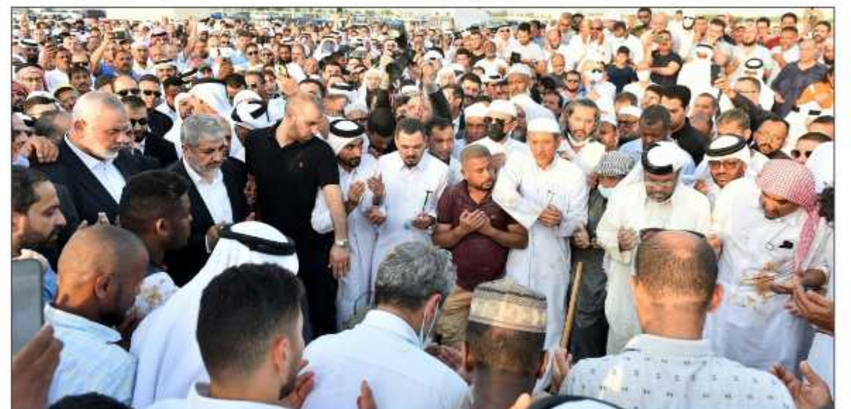
مؤارة الشيخ يوسف القرضاوي في الثرى بالدوحة أمس (فلسطين)

شارك في التشييع مسؤولون قطريون رفيعو المستوى، بينهم الشيخ عبد الله بن حمد آل ثاني نائب أمير البلاد، وممثلته الشخصي الشيخ جاسم بن