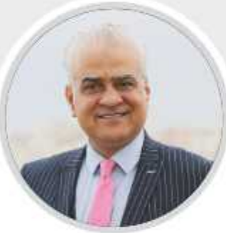
كتب خالد أبو زاهر:

مرة أخرى وليست الأخيرة، سنظل نطلب بحقنا نحن الفلسطينيين على الأصدقاء في الدول العربية، وعلى الإخوة في الدول الإسلامية، وعلى الأصدقاء في دول جميع القارات المحبة للشعب الفلسطيني، أن يحملوا رايثنا ويسمعوا صوتنا للعالم بأسره خلال كأس العالم 2022 المقررة في قطر في شهر نوفمبر القادم.