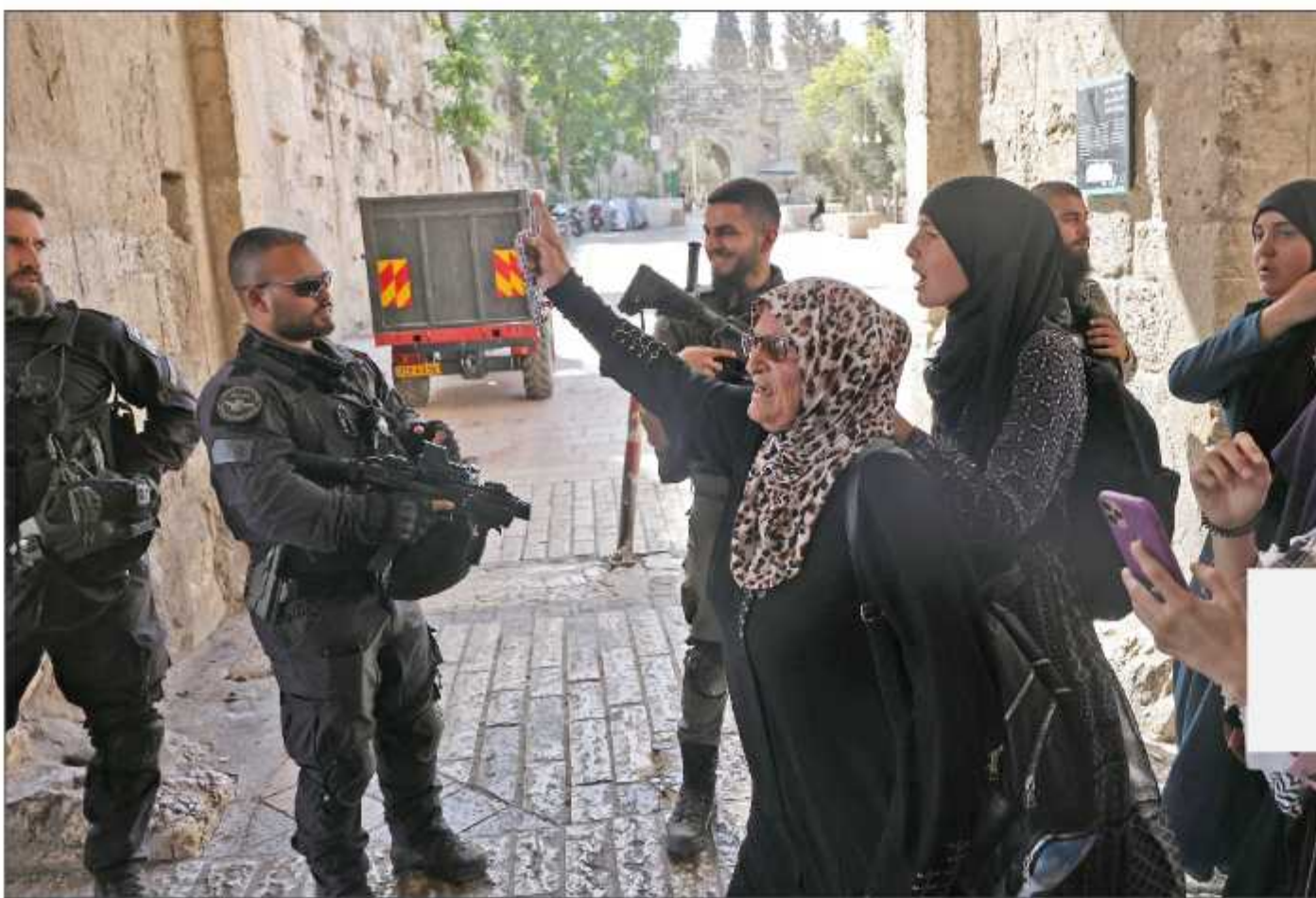
مراهبات يتحدّين جنود الاحتلال بالتكبير في القدس أمس

القدس المحتلة- غزة/ محمد الأيوبي: اقتحم مئات المستوطنين المتطرفين، أمس، باحات المسجد الأقصى المبارك من جهة باب المغاربة، في حين اعتدت قوات الاحتلال الإسرائيلي على المراهبين، واعتقلت شاين، ومصوراً صحفياً، كما