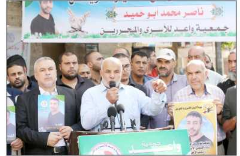
جانب من الوقفة بغزة أمس

رام الله- غزة/ فلسطين: أعلنت اللجنة الوطنية والنضالية لإسناد الحركة الأسيرة أمس البدء في برنامج دعم وإسناد الأسرى الإداريين المضربين عن الطعام في سجون الاحتلال الإسرائيلي. جاء ذلك خلال اجتماع برام الله ضم عدداً من ممثلي المؤسسات المعنية بالأسرى وممثلي القوى والفصائل الوطنية ومناضلي الحركة الأسيرة، إذ تقرر البدء في نصب خيام الاعتصام في المدن الرئيسية. ويواصل 30 أسيراً إضرابهم المفتوح عن الطعام لليوم الرابع تواليًا، رفضاً لاستمرار اعتقالهم الإداري في سجون الاحتلال. وأوضح نادي الأسير في بيان له أمس أن 28 أسيراً من المضربين معتقلون في سجن "عوفر" تم تجميعهم في أربع غرف بأحد الأقسام، في حين هناك أسير مضرب في سجن "النقب" وآخر في سجن "هداريم"، لافتاً إلى أن المعتقلين الإداريين المضربين