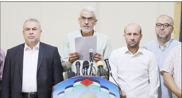
جانب من المؤتمر بغزة أمس

جميعا لوضع حدّ لهذا التطرف الصهيوني، وكبح جماح أطماعهم التلمودية تجاه أقدسانا المبارك، سواء على الأصعدة الجماهيرية والشعبية، مروراً بالفصائلية والسياسية، وصولاً إلى المستويات الرسمية لدى الدول والحكومات".