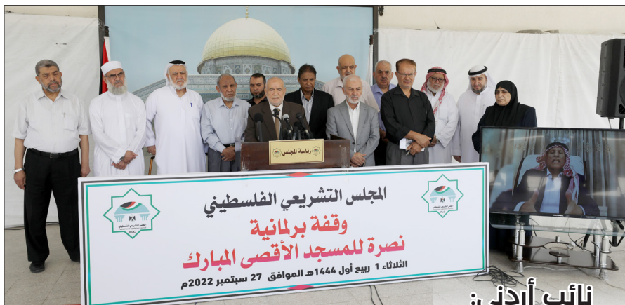
جانب من الوقفة بغزة أمس

ورغم هذا الحرمان وصلت الصيداوي وهي وعشرات المرباطات، فجر أمس أمام باب حطة، لكنهن لم يسلمن من اعتداء وتكبير جنود وشرطة الاحتلال، تقول لصحيفة "فلسطين" عما عاشته أمس: "بعدما صلينا طردنا الجنود من أمام الباب،