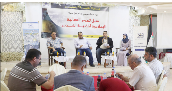
جانب من ورشة العمل بمدينة غزة أمس

داعيا السلطة برام الله للقيام بدورها القانوني في حماية وسائل الإعلام، وخاصة الناشطين ومنصات التواصل الاجتماعي الفلسطينية والدفاع عنها في مواجهة محاربتها وحجب محتواها.