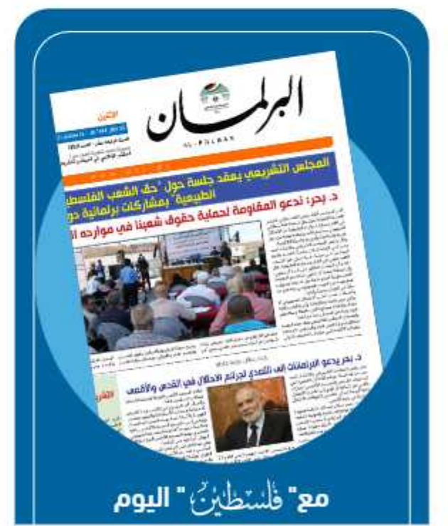
مع "فلسطين" اليوم