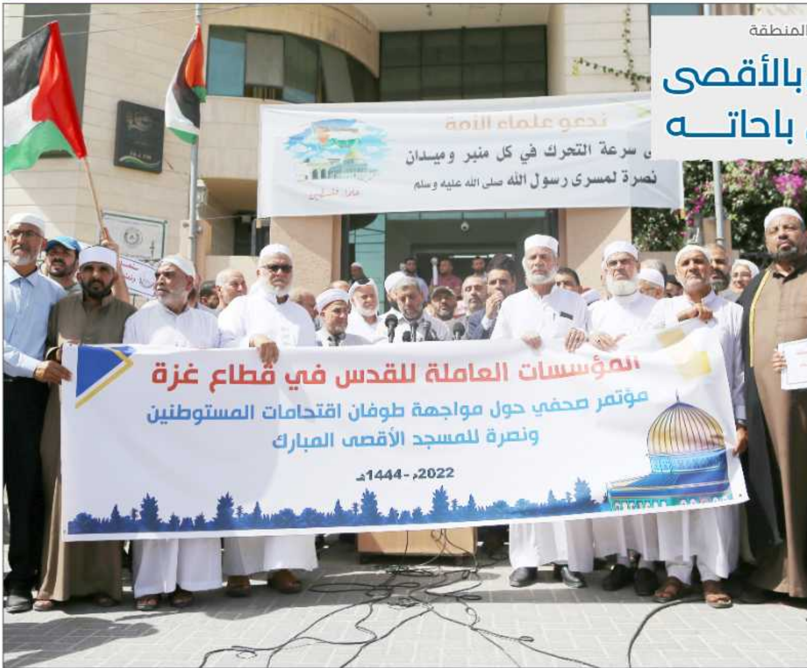
وقفه علمانية نصرة للمسجد الأقصى المبارك بمدينة غزة أمس

في اليوم العالمي للتضامن مع الصحفي الفلسطيني