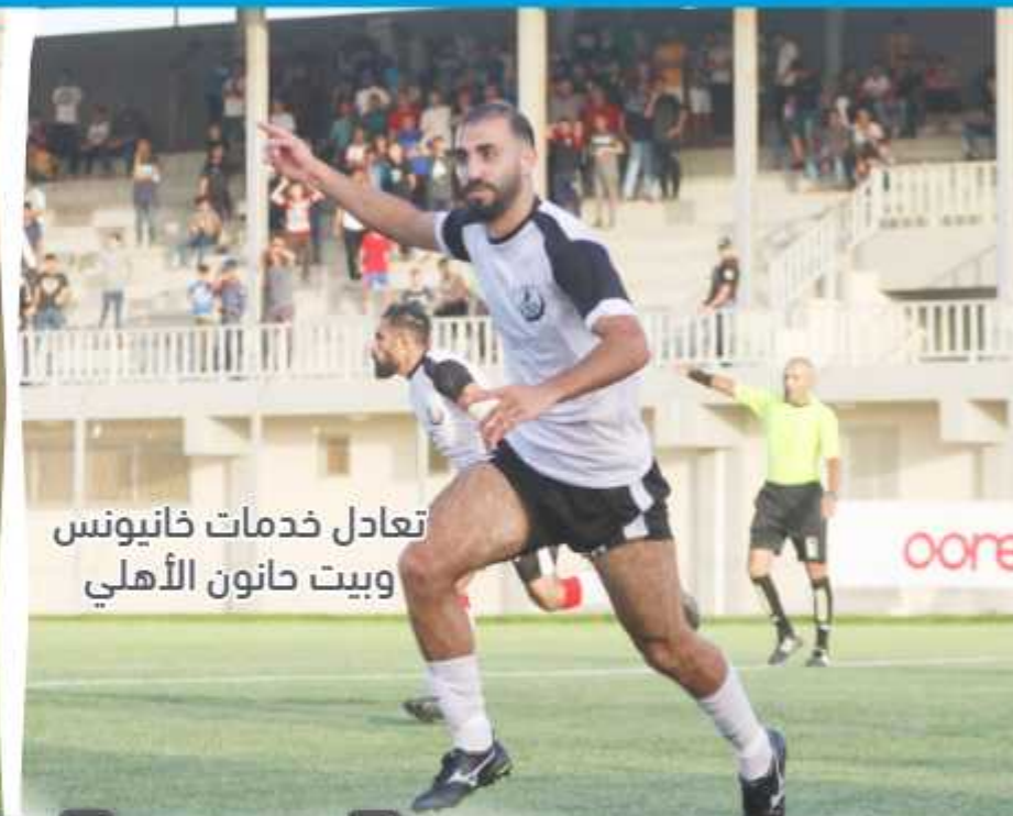
تعادل خدمات خانيونس وبيت حانون الأهلي