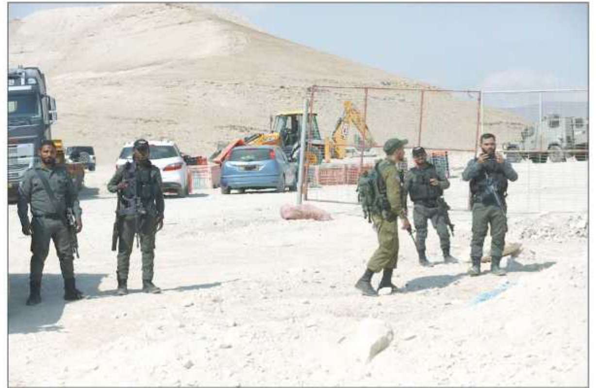
الاحتلال يهدم منشآت ويسرق خيافاً لمواطنين في أريحا أمس