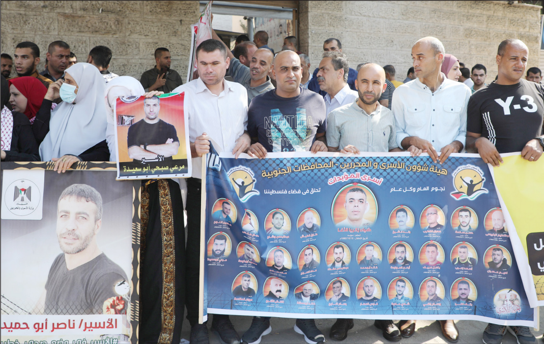
جانب من الوقفة

وذكرت اللجنة أن الطويل تعرضت للمرة الخامسة للاعتقال الإداري وتجديده عدة مرات قبل انتهاء مدة الحكم بهدف كسر إرادتها وتقييد حرية الرأي والتعبير. وناشدت المؤسسات الإنسانية والحقوقية التدخل لوقف سياسة الاعتقال الإداري بحق الصحفيين المعتقلين في سجون الاحتلال، والإفراج عن كل الصحفيين والنشطين.