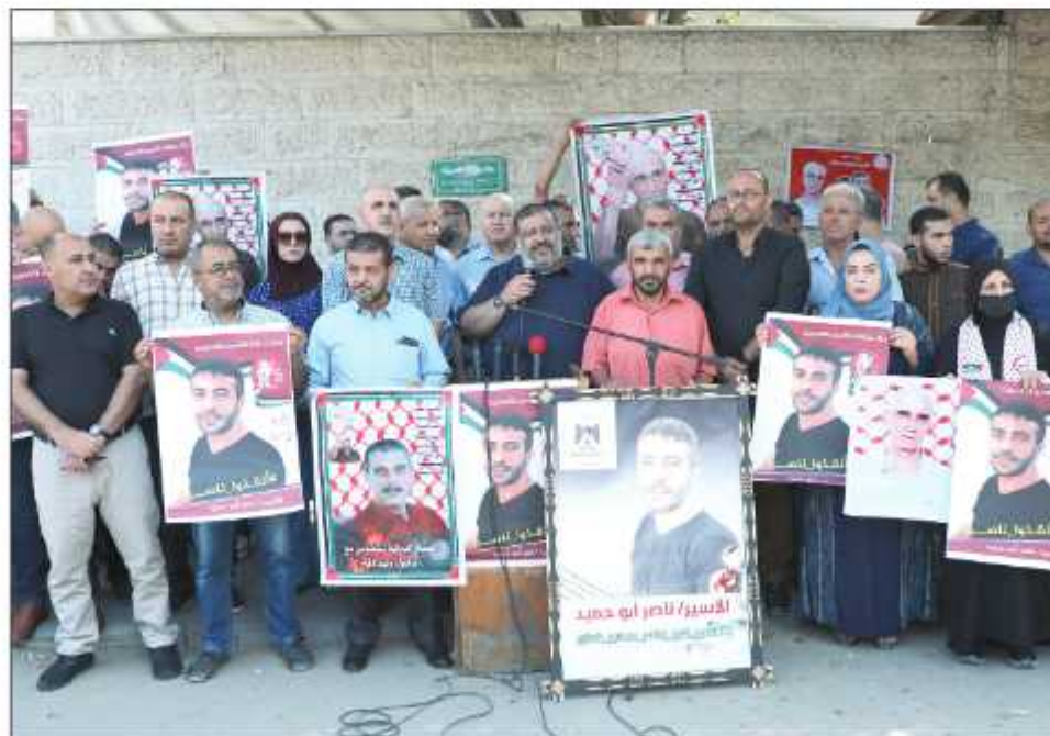
وقفة لأصرة وتضامناً مع الأسرى في غزة أمس