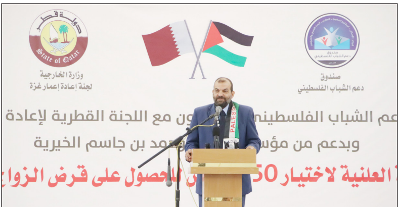
جانب من المؤتمر بمدينة غزة أمس

ولفت إلى أن وزارة التنمية الاجتماعية ذات الشأن كما ورد في القانون المعاق، طالبت