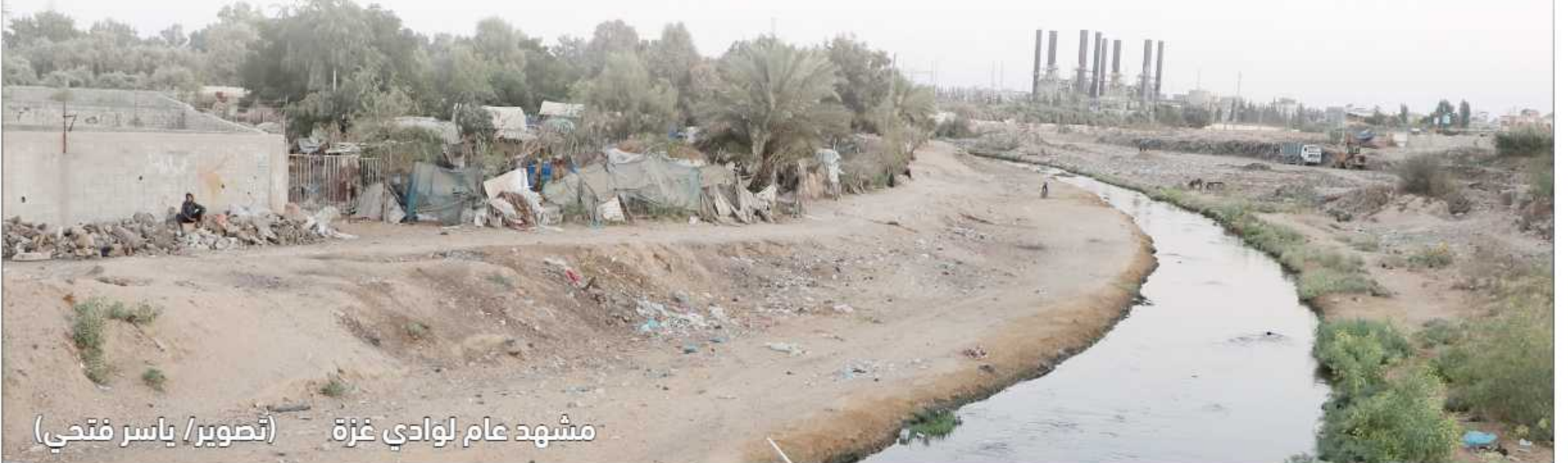
مشهد عام لوادي غزة

ولزمت اللجنة بلدية النصيرات بتحمل التبعات الناتجة عما يترتب من استقطاعات وتعويضات في محمية الوادي، وإيقاف أي معاملات بناء في المنطقة، وملاحقة مالك