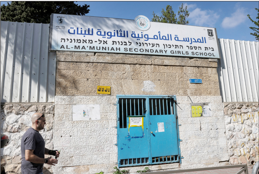
المدرسة المأمونية بالقدس تغلق أبوابها رفضاً للمنهاج الإسرائيلي

القدس المحتلة- غزة/ محمد أبو شحمة: عم الإضراب الشامل أمس مدارس القدس المحتلة؛ رفضاً لمحاولات سلطات الاحتلال فرض مناهجها المزيفة التي تروج للرواية الإسرائيلية، ومنع تدريس المناهج الفلسطينية.