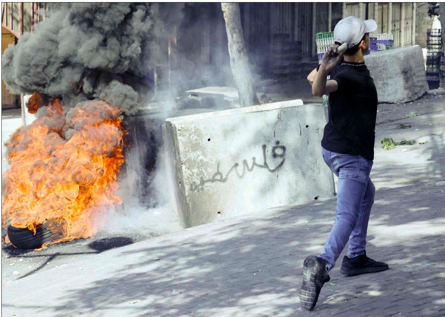
شاب يرشق جنود الاحتلال بالحجارة في أثناء مواجهات وسط الخليل أمس (أ ف ب)