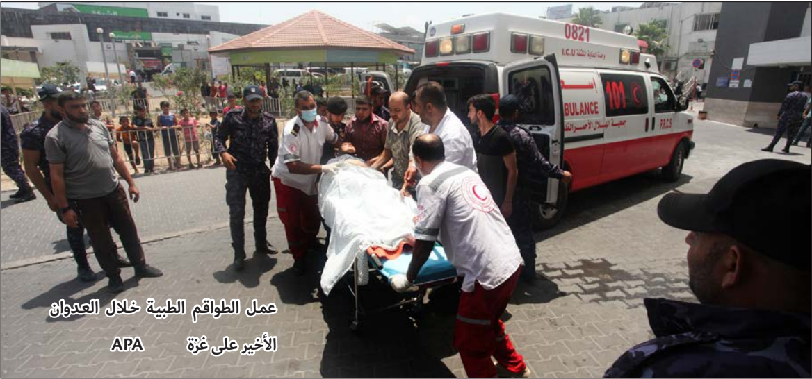
عمل الطواقم الطبية خلال العدوان