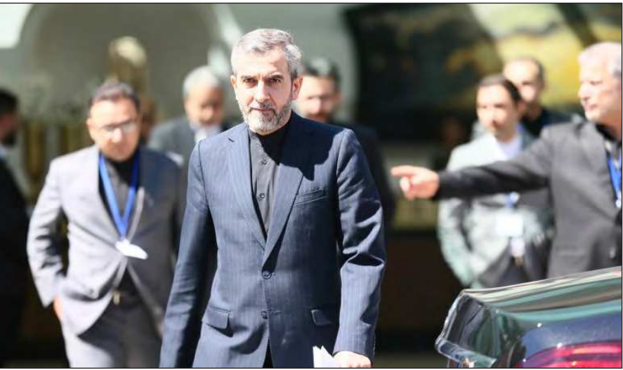
علي باقري يصل إلى فيينا لاستئناف مفاوضات إحياء الاتفاق النووي

لإحياء الاتفاق النووي، المعروف رسميا باسم خطة العمل الشاملة المشتركة (JCPOA).