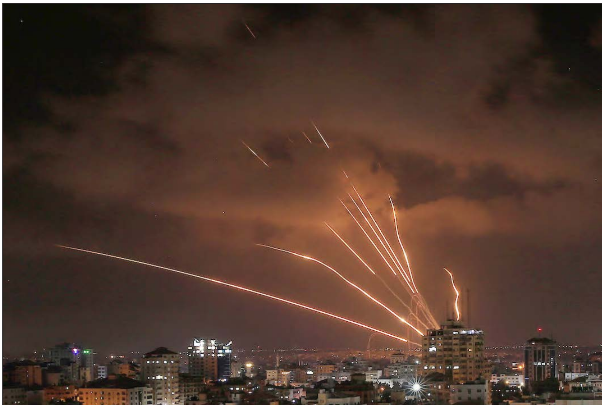
المقاومة الفلسطينية تطلق رشقة صاروخية أمس

وشق وحدة فصائل المقاومة، لكن الرد جاء من "غرفة العمليات المشتركة" التي تضم كل أذرع المقاومة التي أعلنت وحدة ميدان المواجهة.