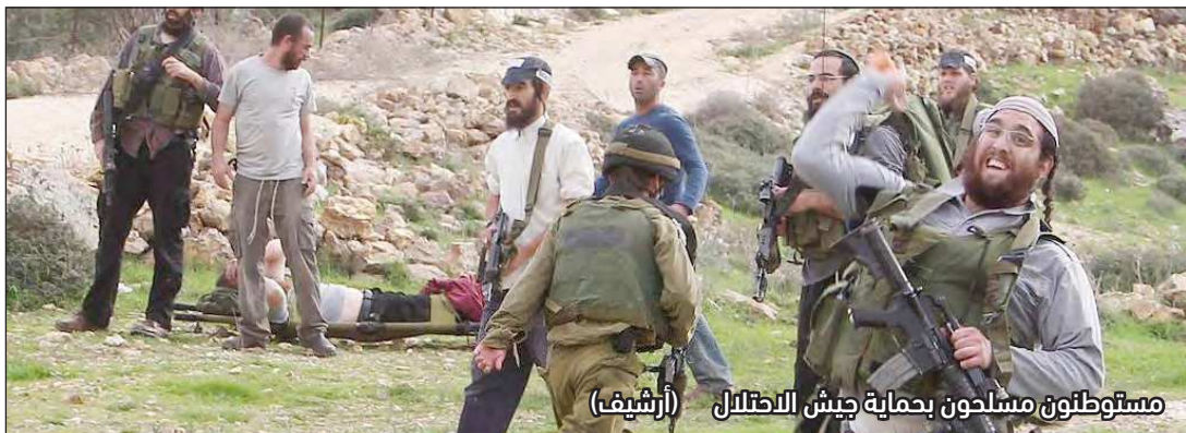
مستوطنون مسلحون بحماية جيش الاحتلال (أرشيف)