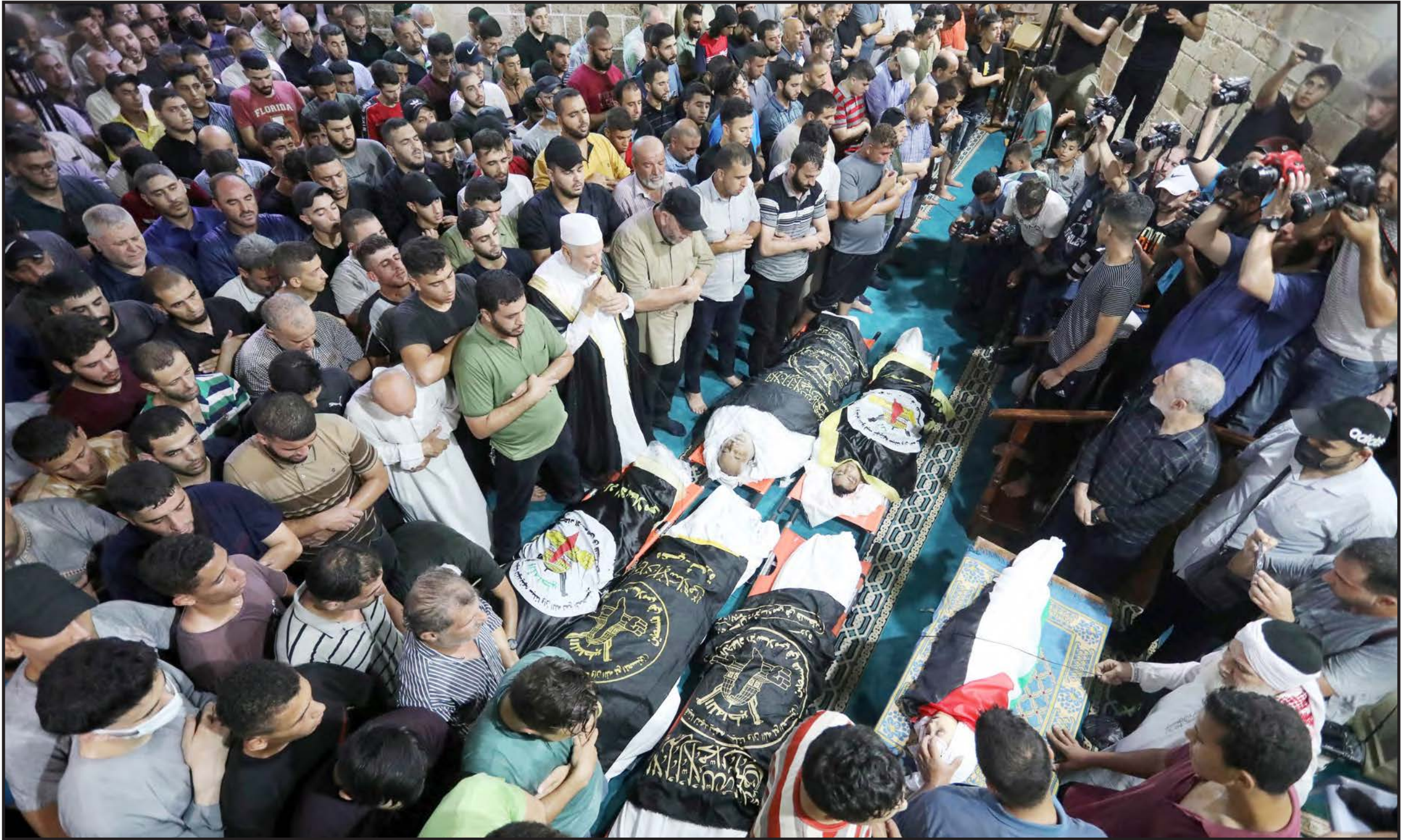
أداء صلاة الجنازة على جثامين الشهداء بالمسجد العمري في مدينة غزة أمس

"الغرفة المشتركة": رد المقاومة يكون بالطريقة التي تحددها قيادتها