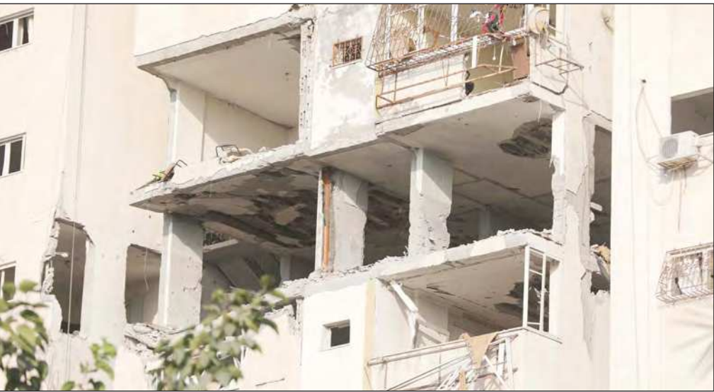
قوات الاحتلال تقصف شقة سكنية وسط مدينة غزة أمس

ووفقًا للناشط السياسي ثامر سباعنة فإن تصريحات وزير المالية شكري بشارة، حول