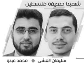
شهادا صحفية فلسطين

نيويورك- رام الله/ فلسطين: قالت شبكة الجزيرة القطرية أمس إن مرور 100 يوم على اغتيال الزميلة شيرين أبو عاقلة يكشف عن زيف رواية (إسرائيل) ومحاوله الإفلات من العقاب، في حين نظم زملاء شيرين في شبكة الجزيرة وفعات احتجاجية في مقر القناة بالدوحة وفي مكاتب الشبكة حول العالم للمطالبة بتحقيق العدالة للزميلة الشهيدة. واغتالت قوات الاحتلال الإسرائيلي الزميلة شيرين أبو عاقلة في 11 مايو/أيار الماضي أثناء تغطيتها اقتحامه مدينة جنين بالضفة الغربية المحتلة. وقالت الجزيرة -في بيان- إن التحقيقات المستقلة عززت التأكيدات بأن شيرين أبو عاقلة استهدفت عمداً من الاحتلال الإسرائيلي. وأكدت الجزيرة أنها ستواصل المضي في إجراءات تقديم قضية شيرين كاملة إلى المدعي العام للمحكمة الجنائية الدولية. كما قررت شبكة الجزيرة إطلاق قناة خاصة