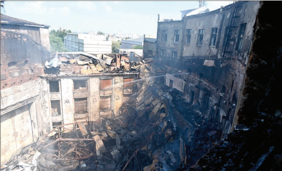
دمار واسع جراء قصف الطيران الروسي لمركز قصر الثقافة في خاركيف

واقترحت الأمم المتحدة سابقا المساعدة في تسهيل زيارة مفتشي الوكالة الدولية للطاقة الذرية إلى زابوريجيا من كييف، لكن روسيا قالت إن أي مهمة تمر عبر العاصمة الأوكرانية ستكون "خطيرة للغاية".