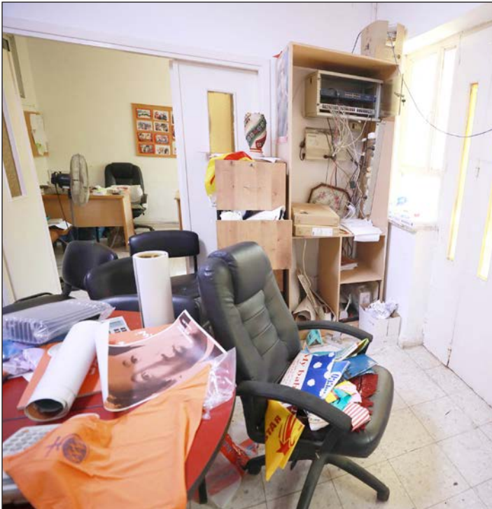
آثار الخراب في المؤسسات الأهلية بعد أن اقتحمتها قوات الاحتلال في رام الله أمس

وطالبت الهيئة في بيان لها المنظمات الدولية والمجتمع الدولي بتوفير الحماية لمؤسسات العمل الأهلي والضغط على الاحتلال لوقف عدوانه المستمر عليها وتفتيت مقدراتها وإرهاب كوادرها، مؤكدة أن قبول منظمة الأمم المتحدة للحركة الصهيونية الأمريكية كمنظمة استشارية في المجلس الاقتصادي والاجتماعي التابع للأمم المتحدة رغم أنها منظمة تقوم بتغذية الاستيطان ودعم جيش الاحتلال "خطوة لا يمكن فهمها إلا في سياق سياسة الكيل بمكيالين في الوقت الذي تقوم به قوات الاحتلال بالعدوان المستمر على شعبنا ومؤسساته".