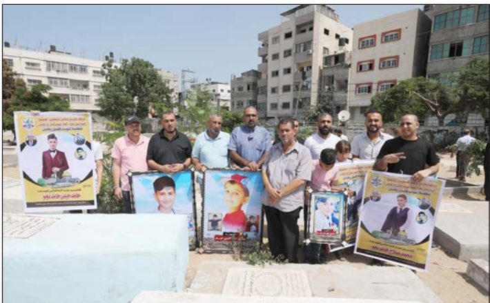
جانب من الوقفة شمال القطاع أمس