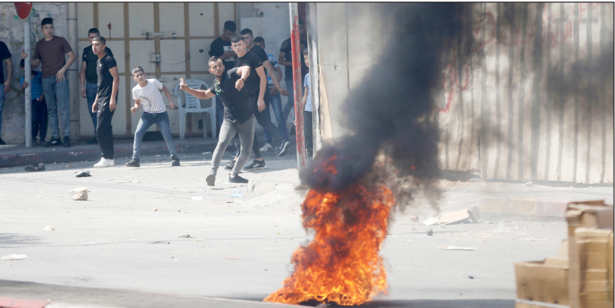
تظاهرات وإشعال للإطارات المطاطية بمدينة الخليل عقب استشهاده النابلسي أمس (Apa)

وناشد النشطاء والإعلاميين التريث والحكمة في نقل الأخبار وخاصة فيما يتعلق بأسماء الشهداء والمصابين.