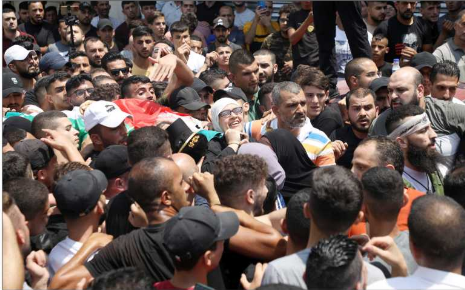
والدة الشهيد النابلسي تتقدم مشيعه في نابلس أمس