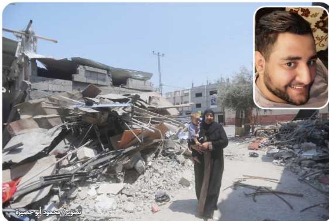
ألمانيا، وكان يفترض أن يسافر لإجراء العملية الأخيرة خلال الأسابيع القادمة".

ضياء شاب مدني لا علاقة له بأحد، وما كانت البسطة إلا سبباً لتساعده على الحركة والمشى، ولكن الصاروخ الذي باغته حول الساكن إلى خراب، تفوح منه رائحة الموت والدمار وذكريات مؤلمة لا يمكن نسيانها في إثر استشهاده ليهدم الاحتلال أحلامه ومخططة الزواج وبناء حياة مستقرة، واستكمال علاجه، وكان قد كتب على صفحته على الفيس بوك: "اللهم موتة لا غسل فيها ولا كف" وتابع: "والا ما تم".