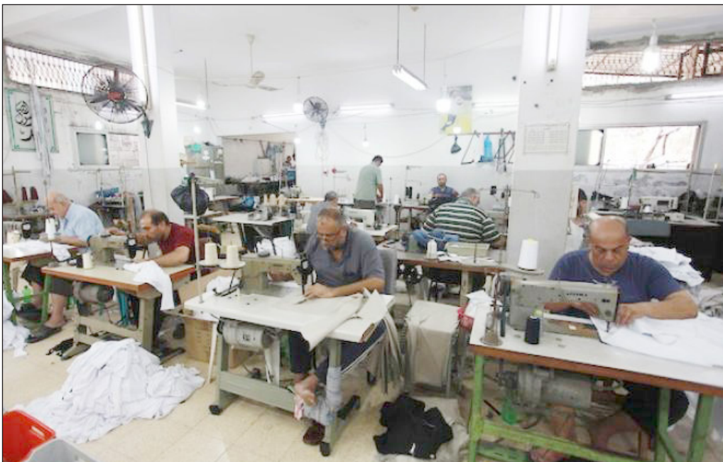
أحد مصانع الخياطة بمدينة غزة