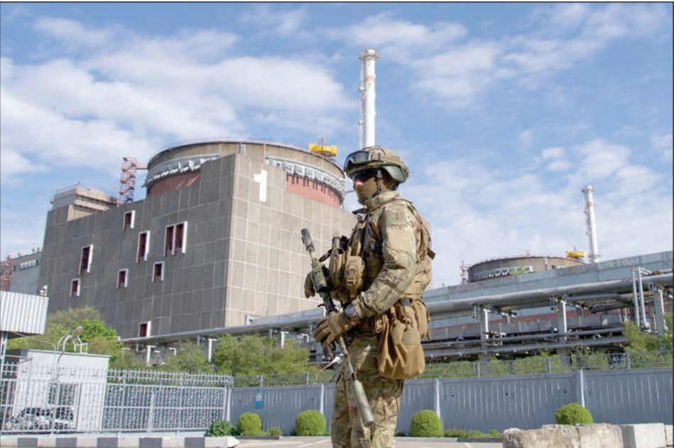
جندي روسي بالقرب من محطة زاباروجيا

وأضاف المستشار الألماني أن بلاده ستتخذ جميع الإجراءات لتحقيق في الجرائم المرتكبة في أوكرانيا. وتابع أن الاتحاد الأوروبي رد على الحرب الروسية على أوكرانيا بإبداء كثير من التكاتف والتضامن، مشيرا إلى أنه ينبغي للاتحاد أن يوحد صفوفه في المجالات الأخرى التي لم يتوصل فيها إلى اتفاق حتى الآن.