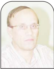
علي بدوان الوطن العمالية

أخيراً، سيبقى الشعب الفلسطيني بنصفه، على أرض وطنه التاريخي، والنصف الثاني ينتظر العودة بالعمل والكفاح المتواصل، ولن يكون هناك حل، ولن تهنا دولة الاحتلال الإسرائيلي بأي راحة، دون إنصاف الشعب الفلسطيني، وحقه في العودة تقرير المصير والاستقلال الوطني.