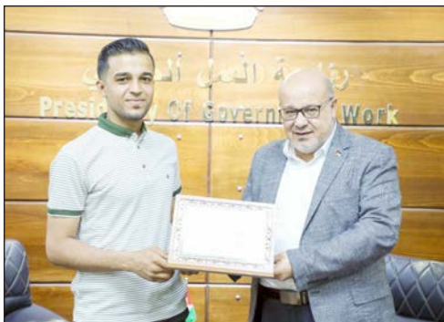
جانب من حفل التكريم بمدينة غزة أمس (فلسطين)