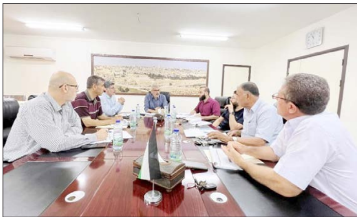
جانب من الاجتماع بمدينة غزة أمس

عقدت لجنة التصنيف الوطنية رقم 02/2022، اجتماعاً لها أمس، في مقر وزارة الأشغال العامة والإسكان، وذلك بهدف دراسة ملفات 50 شركة مقاولات. وتتكون لجنة التصنيف الوطنية، من ممثلين عن وزارة الصحة ووزارة التعليم ووزارة الحكم المحلي ووزارة الأشغال بالإضافة لعضوية نقابة المهندسين، واتحاد المقاولين وبرئاسة المدير العام للقطاعات المركزية بوزارة الأشغال العامة والإسكان حسب القانون. واعتمد المشاركون في الاجتماع تصنيف شركتين جديدتين، وتحسين 14 شركة والعمل على ترصيد مشاريع لـ 4 شركات، وكذلك تجديد التصنيف لـ 30 شركة.