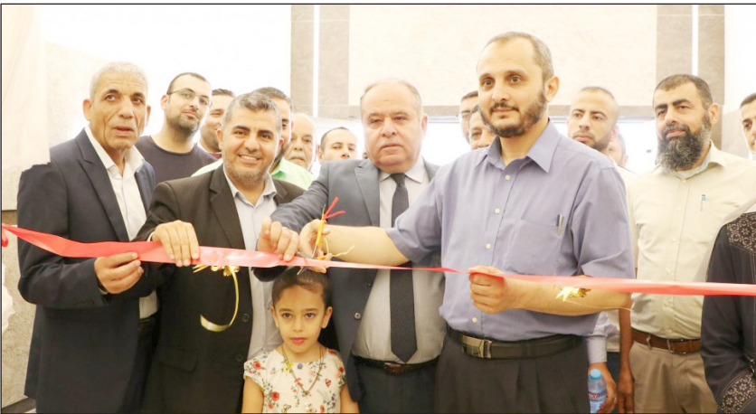
جانب من حفل الافتتاح شمال القطاع أمس (فلسطين)