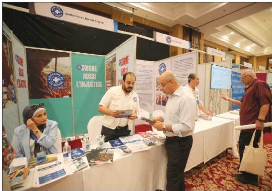
جانب من المعرض

وتابع: أن احتياجات القطاع الصحي كالتغذية والصحة يساوي نحو 50 %، مردفاً: "لنا أن تخيل كم هي الفجوة كبيرة جداً عما تم إنجازه وما هو المطلوب".