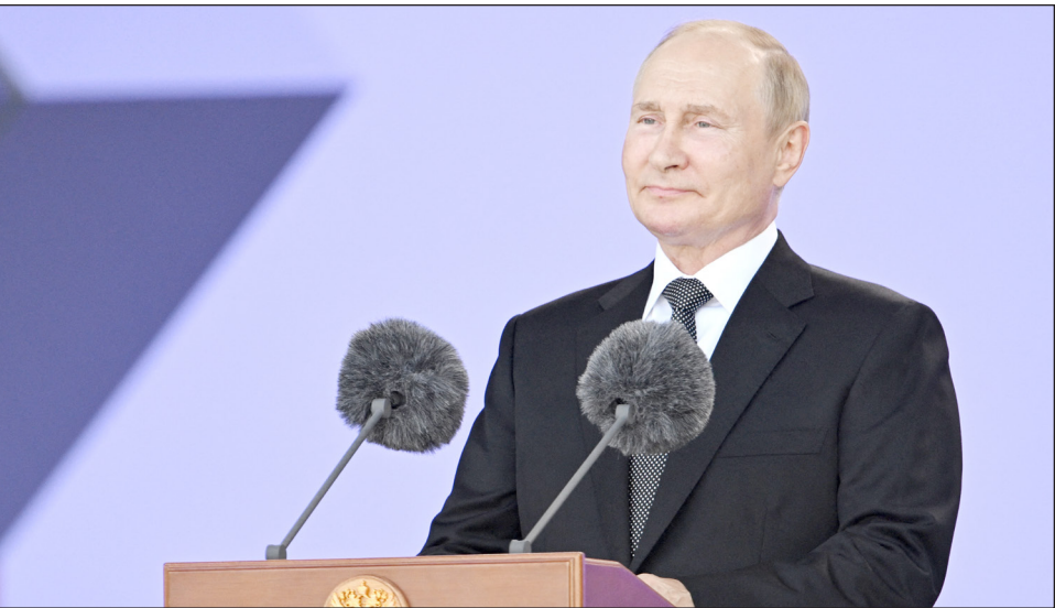
الرئيس الروسي فلاديمير بوتين في أثناء كلمته أمس

وفي مواجهة العقوبات التي فرضها عليها الغرب بسبب الحرب التي تشنها على أوكرانيا منذ 24 فبراير/ شباط