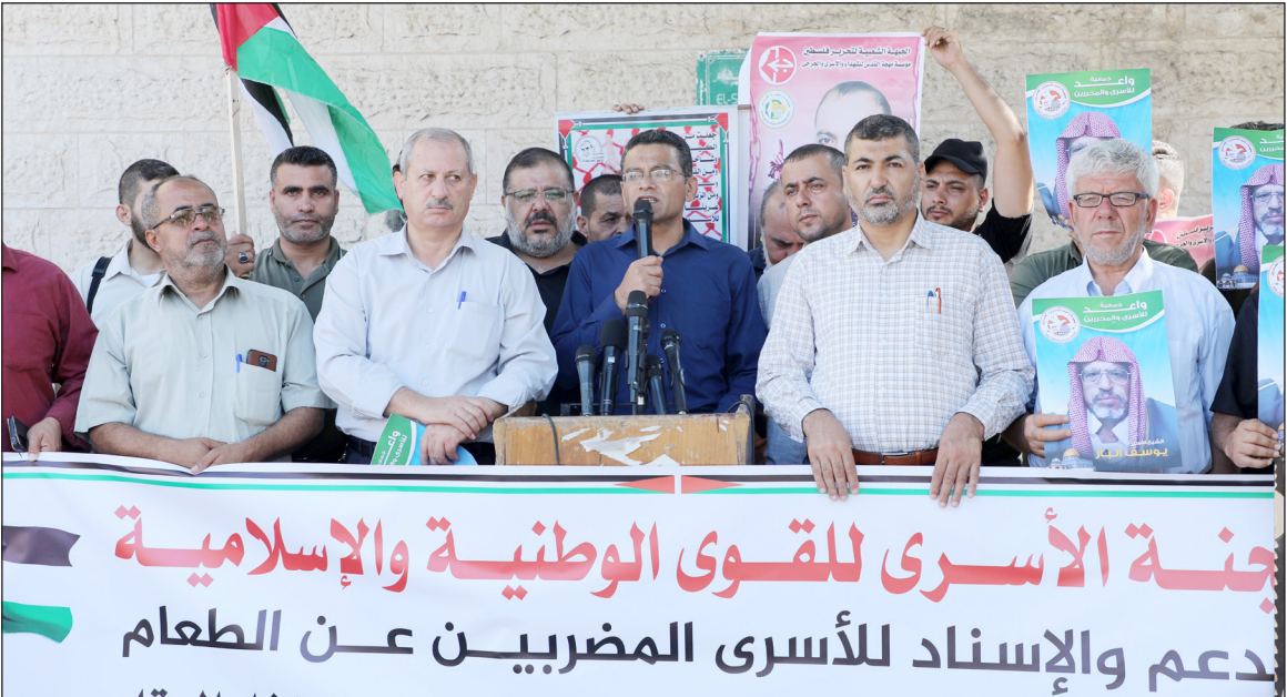
جانب من الوقفة

156 عن الطعام رفضًا لاعتقاله الإداري، وإمام المسجد الكبير في مدينة اللد المحتلة الشيخ "الباز" بعد تدهور وضعه الصحي بسبب الإهمال الطبي المتزامن مع إضرابه المفتوح عن الطعام لليوم الخامس تواليًا.