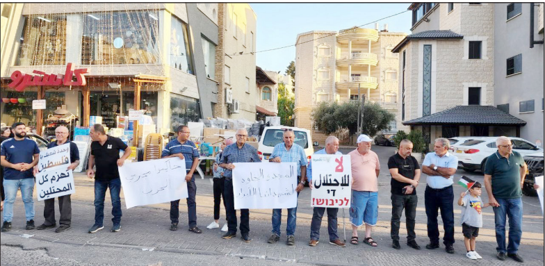
وقفة في الداخل المحتل تضامناً مع غزة

ورفع المتظاهرون الشعارات المنددة بالعدوان، من بينها، "ارفعوا أيديكم عن غزة"، و"غزة هاشم ما بتركع للدبابة والمدفع"، بالإضافة إلى شعارات تطالب بمحاكمة مجرمي الحرب. وفي عرابة، نظمت اللجنة الشعبية وقفة عند دوار الفانوس المركزي في الميدان، إسنادًا لغزة ورفضًا للعدوان الإسرائيلي.