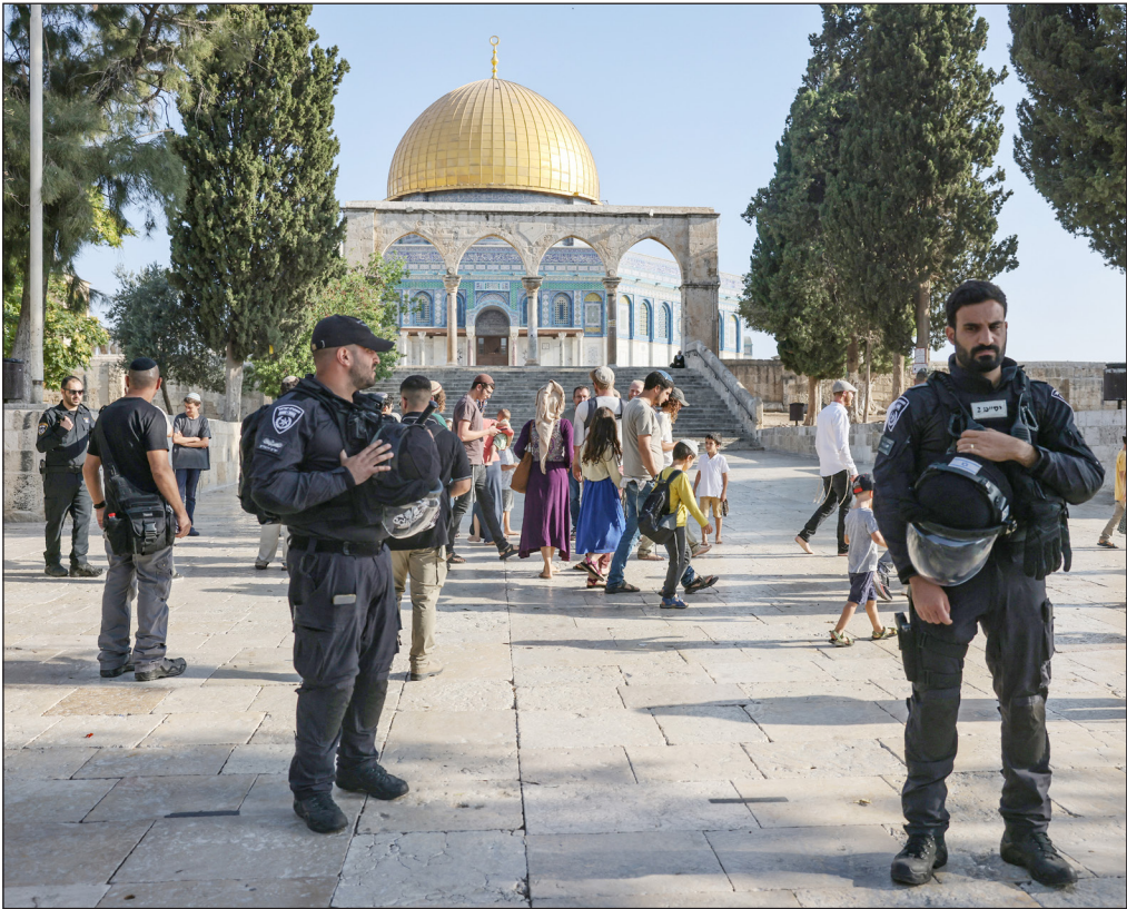
مستوطنون يقتحمون باحات المسجد الأقصى بحماية شرطة الاحتلال

العالم العربي والإسلامي بالوقوف في وجه حملة الاقتحامات والتهويد التي يتعرض لها المسجد الأقصى، وكذلك السلطة بالتحرك على المستوى الدبلوماسي والتوجه إلى المؤسسات الدولية ذات الشأن لردع الاحتلال ووقف انتهاكاته المستمرة بحق مقدساتنا.