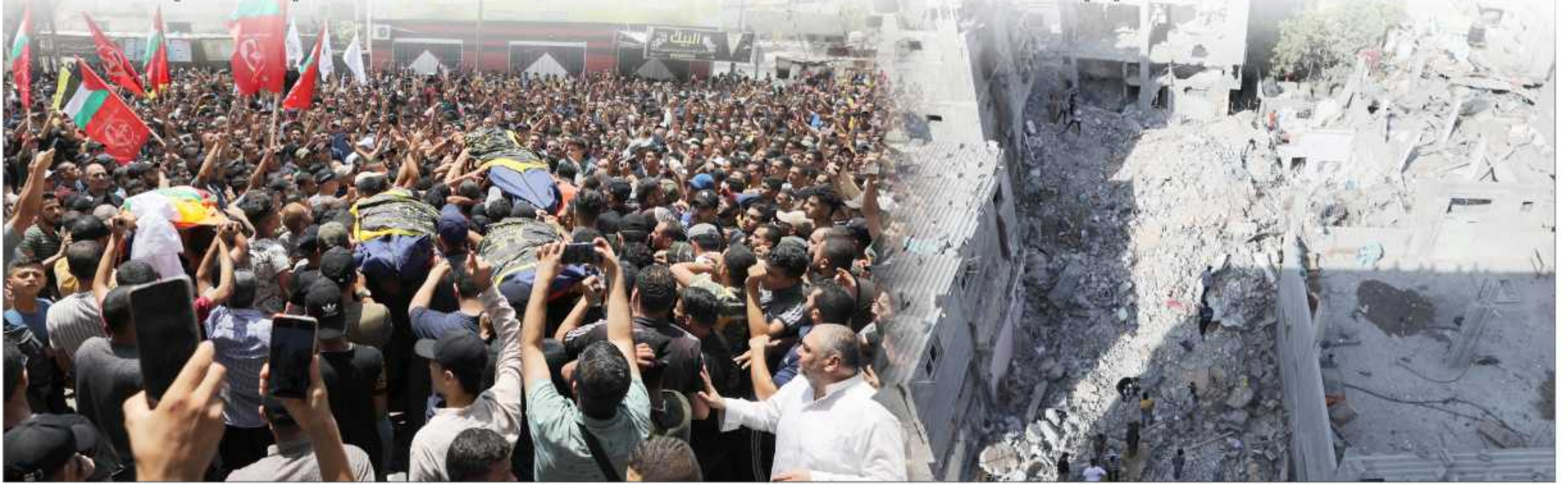
مشاركون في تشييع شهداء مجزرة رفح أمس

غزة/ عبد الله التركماني: أعلنت وزارة الصحة بغزة استشهاد 44 مواطناً، بينهم 15 طفلاً، و4 سيدات، وإصابة 360 آخرين منذ بدء عدوان الاحتلال على قطاع غزة عصر