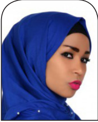
سنا كحك رأي اليوم