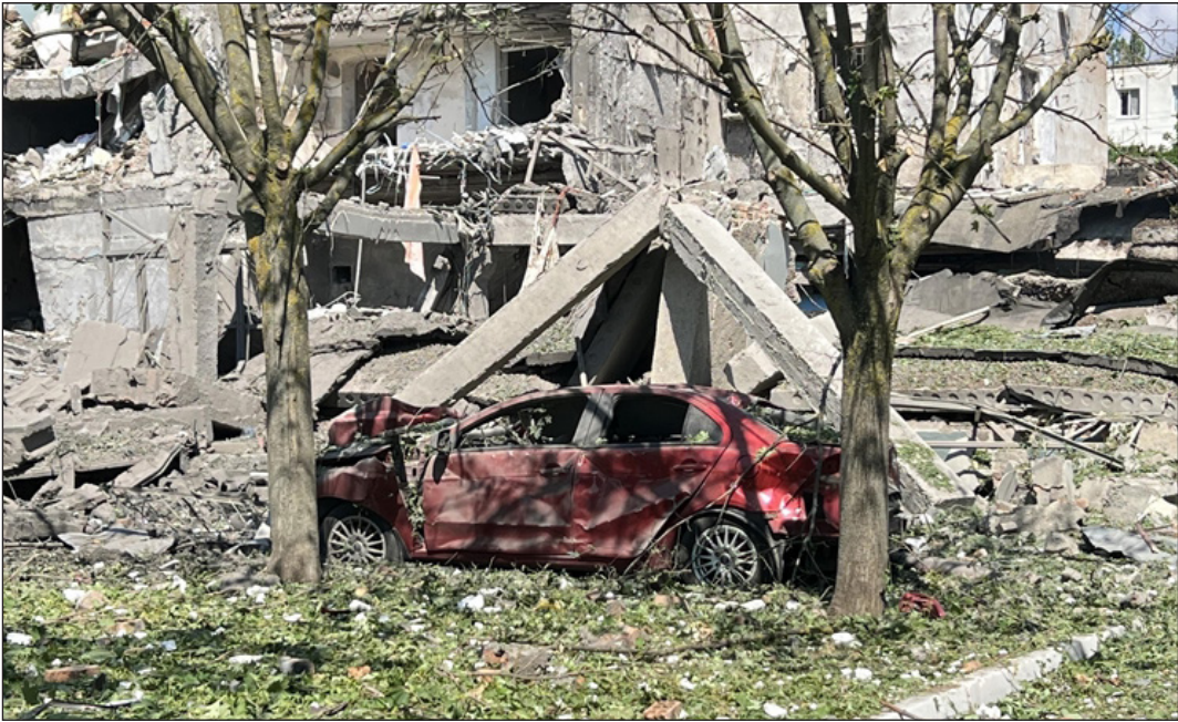
آثار الدمار الذي خلفته الغارات الروسية

وذكرت الكاتبة في مقالها أن قيادات عسكرية أميركية تحدثت بقلق عن هذه التطورات، ونقلت عن مسؤول القيادة المركزية الجنرال ديريك كوريلا قوله "نسعى لتجنب سوء