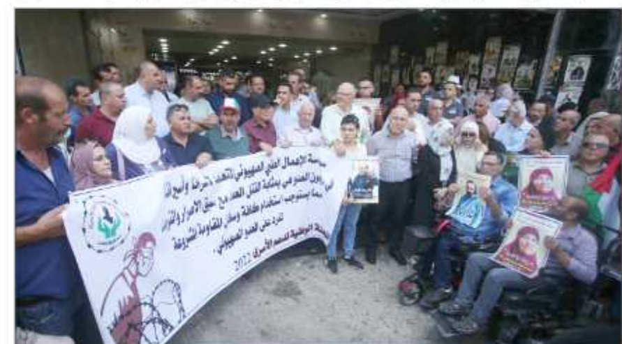
وقفة في نابلس تضامناً مع الأسرى في سجون الاحتلال أمس

نابلس/ فلسطين: شاركت جماهير غفيرة بمحافظة نابلس شمالي الضفة الغربية المحتلة، أمس، في وقفة احتجاجية تنديداً بجرائم الاحتلال بحق الأسرى، خاصة عقب استشهاد الأسيرة سعدية فرج الله أول من أمس