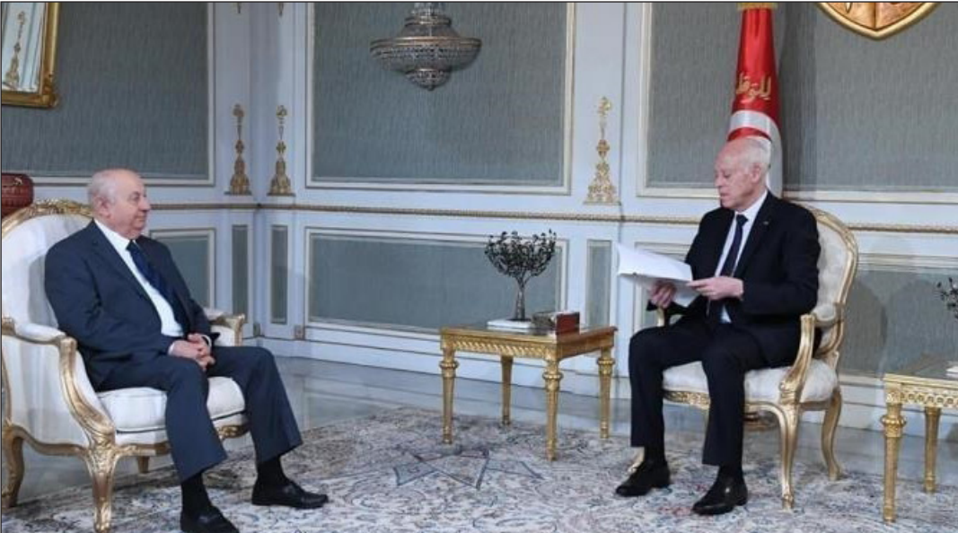
جانب من اجتماع الرئيس قيس سعيد مع الصادق بلعيد

وأوضح أن "النص الصادر عن رئاسة الجمهورية ينطوي على مخاطر ومطبات