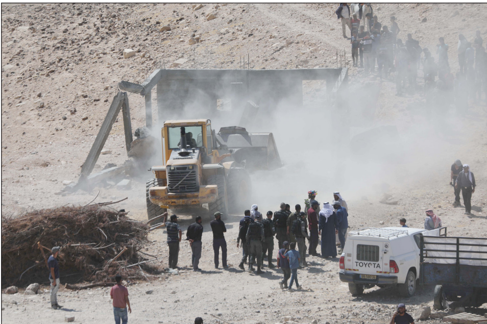
قوات الاحتلال تهدم منزلاً في مسافر يطا بالضفة الغربية أمس