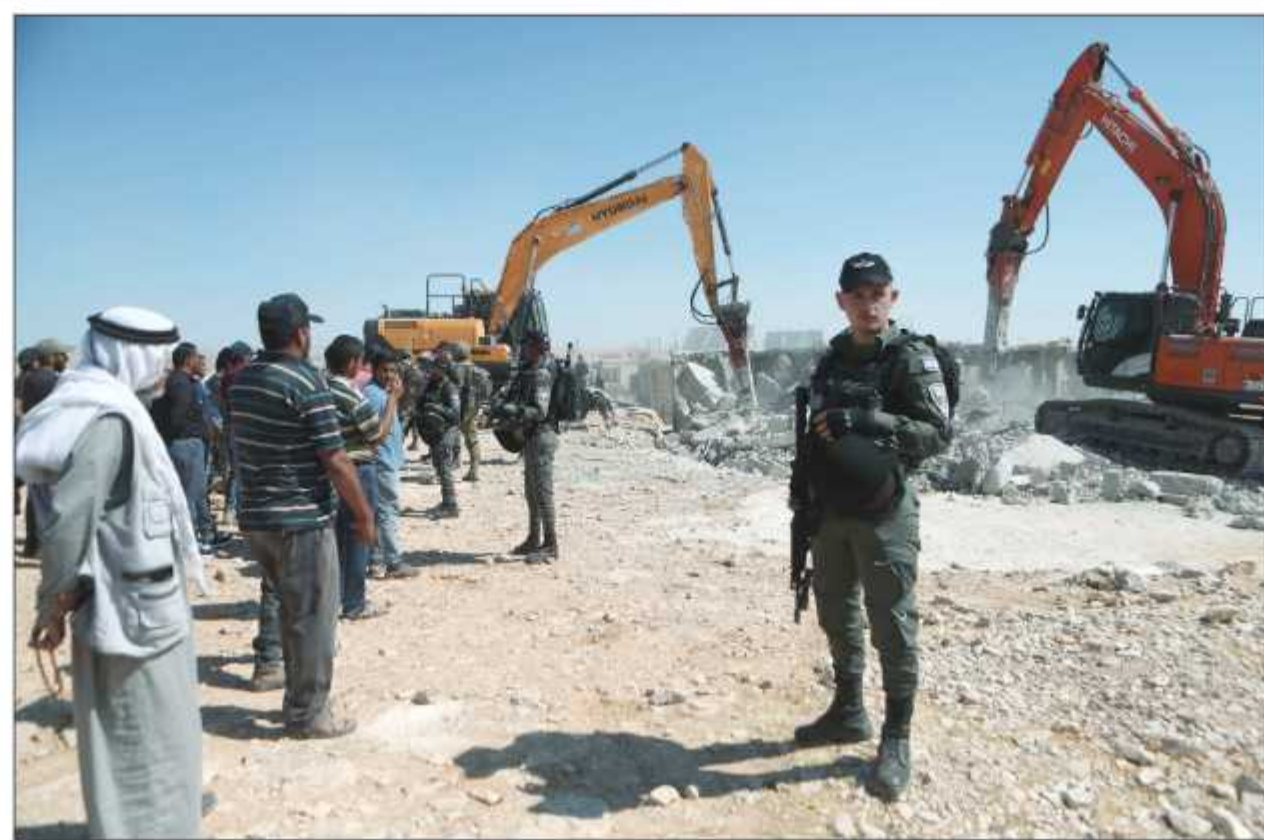
جيش الاحتلال يصدم منزلاً في مسافر يطا جنوبي الضفة المحتلة أمس