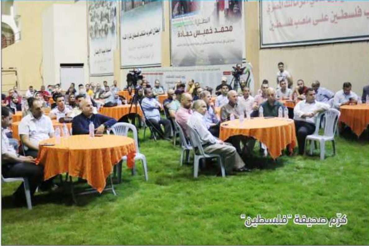
كرّم صحيفة "فلسطين"

الثلاثاء 6 ذو الحجة 1443 هـ / 5 يوليو / تموز 2022 Tuesday 5 July 2022