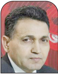
سالم لبيبي العربي الجديد

خيّب الرئيس قيس سعيدّ الآمال، وأضاع فرصة قد لا تتكرّر، ولم يغامر، كما كان الأمر متوقعا، بإدراج تجريم التطبيع في الدستور التونسي الجديد الصادر في الجريدة الرسمية التونسية يوم 2022 / 6 / 30، واكتفى بالإشارة في توطئة النص إلى "حق الشعب الفلسطيني في أرضه السليبية وإقامة دولته عليها بعد تحريرها وعاصمتها القدس الشريف"، ولم يستجب لمطالب قوى عروبية ويسارية ونقابية تُسانده.