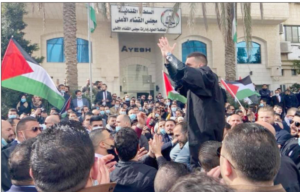
وقفة أمام مجلس القضاء الأعلى برام الله رفضاً لتغول السلطة التنفيذية على القضاء (أرشيف)

وأضاف أن كل القرارات بقانون يتم تفصيلها من السلطة التنفيذية، وفي كثير من الأحيان لا يوجد داع لإصدارها، لغياب صفة الاستعجال، لكن هناك هندسة لكثير من القضايا التي تتم عبر قرار بقانون. واعتبر أن غالبية القرارات بقانون التي صدرت تحايي فئة معينة، وجعلها ذات طابع اقتصادي مالي تجاري استثماري، تتسق مع طبقة وفئة محددة لا تريد نسبتها في المجتمع الفلسطيني ع 5 %.