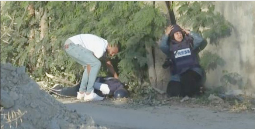
شاب يحاول نقل الصحفية شيرين أبو عاقلة إلى الإسعاف

عائلة أبو عاقلة تدعو الأمم المتحدة و"الجناية الدولية" لـ "إجراءات فورية لتحقيق العدالة"