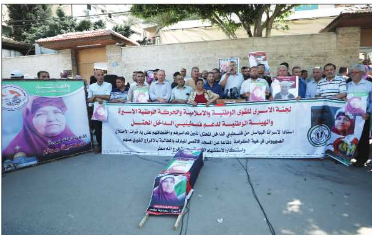
فعالية إسنادية لأسرى "هبة الكرامة" في غزة أمس