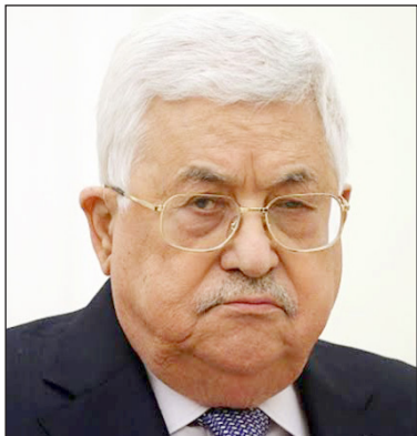
اليوم منصب رئيس الاتحاد الفلسطيني لكرة القدم، "المنصب الذي يستغله كي يثبت مكانته".

سلطت صحيفة عبرية الضوء على قائمة أبرز الشخصيات التي تنتمي لحركة "فتح"، والمرشحة بقوة لخلافة رئيس السلطة محمود عباس، حيث يمتلك بعضهم علاقات قوية مع "تل أبيب" وواشنطن، وبعضهم ما زال يؤمن بالكفاح ضد الاحتلال الإسرائيلي.