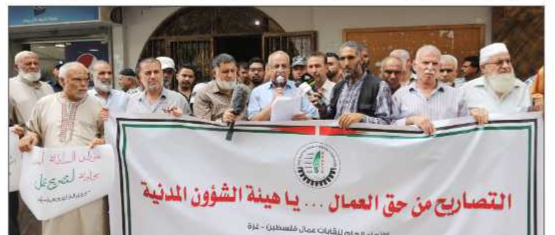
مواطنون يشاركون في وقفة للمطالبة بالتحقيق في ملف تصاريح العمل

كل مسؤول يثبت تورطه، وذلك في أعقاب الكشف عن إضافة أسماء موظفين في السلطة بكونه تصاريح العمال. جاء ذلك خلال وقفة احتجاجية نظمها اتحاد نقابات عمال فلسطين، أمام مقر هيئة الشؤون المدنية غرب غزة.