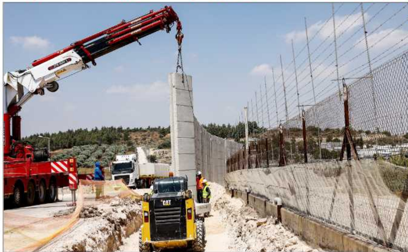
قوات الاحتلال تقيم جداراً جديداً موازاً للجدار الفاصل بالقرب من قرية سالم الواقعة شمالي الضفة الغربية