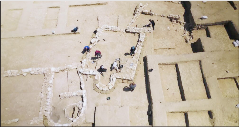
بقايا المسجد الذي اكتشف في النقب المحتل

على مسافة قصيرة من المسجد مع بقايا أدوات المائدة والتحف الزجاجية التي تشير إلى ثراء ساكنيه. واعتبرت سلطة الآثار التابعة للاحتلال أن المساجد والمنازل الأخرى الموجودة في الجوار تلقي الضوء على "العملية التاريخية التي حدثت في شمال النقب مع ظهور دين جديد هو الدين الإسلامي وحكم وثقافة جديدين في المنطقة".