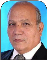
السفير د. عبد الله الأشعل

والخلاصة أن (إسرائيل) عنصر هدم لسلطة القانون الدولي، كما أنها قدوة في المنطقة لهذا السلوك، ولا شك أن واشنطن تستخدم الغيتو الأمريكي حصرا لحماية الجرائم الإسرائيلية، ولا تحتمل نقد التصرفات الإسرائيلية من أي جهة لدرجة أن واشنطن قررت الانسحاب من بعض الوكالات المتخصصة عندما لاحظت أن هذه الوكالات تفتح الباب لانتقاد العرب لـ (إسرائيل) مثل منظمة العمل الدولية ومنظمة اليونسكو والصحة العالمية وغيرها.