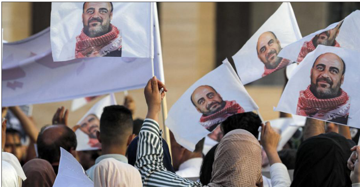
وقفة احتجاجية على اغتيال نزار بنات (أرشيف)

وشدّد على ضرورة تدويل قضية نزار بنات لما تملكه من تأثير كبير على السلطة، من خلال التوجه لرفع دعاوى قضائية في المحافل الدولية.