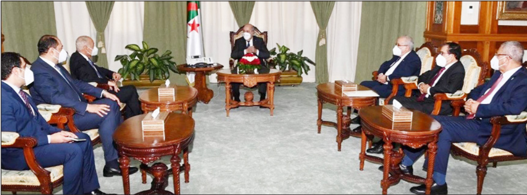
جانب من الاجتماع التشاوري لوزراء الخارجية

وأضاف: "من هذه الاجتماعات لقاء تشاوري قادم لوزراء الخارجية العرب في