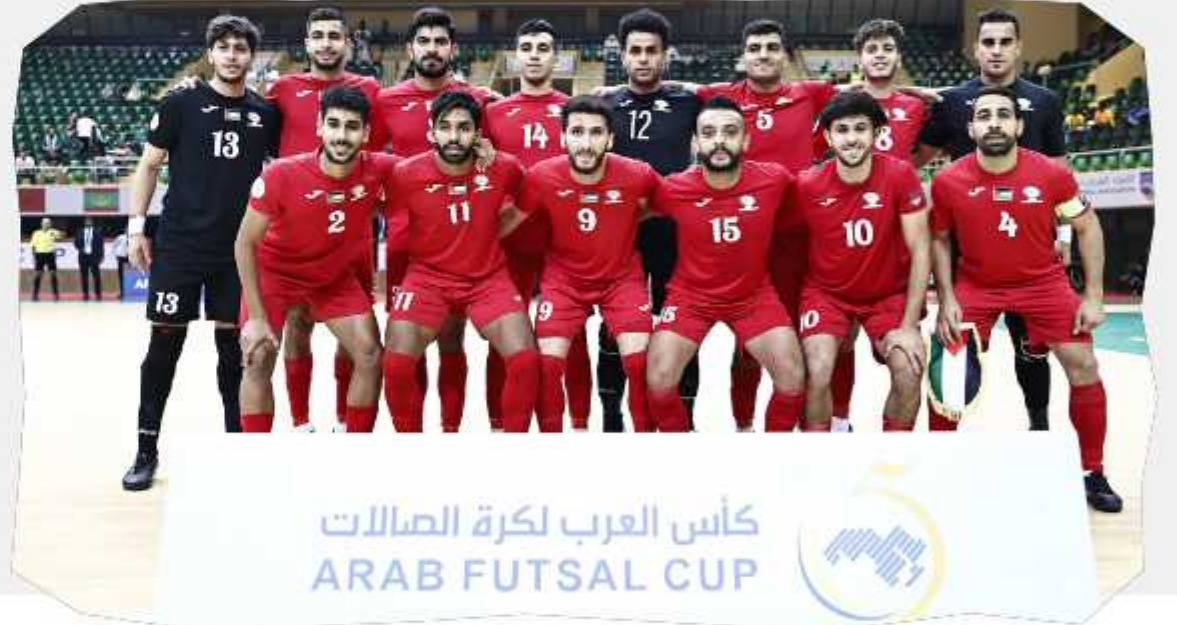
كأس العرب لكرة الصالات ARAB FUTSAL CUP

وكان المنتخب الوطني تمكن من الفوز على منتخب السعودية في مستهل مشواره بالبطولة بنتيجة 6-4، قبل أن يخسر من منتخب ليبيا بهدفين دون رد.