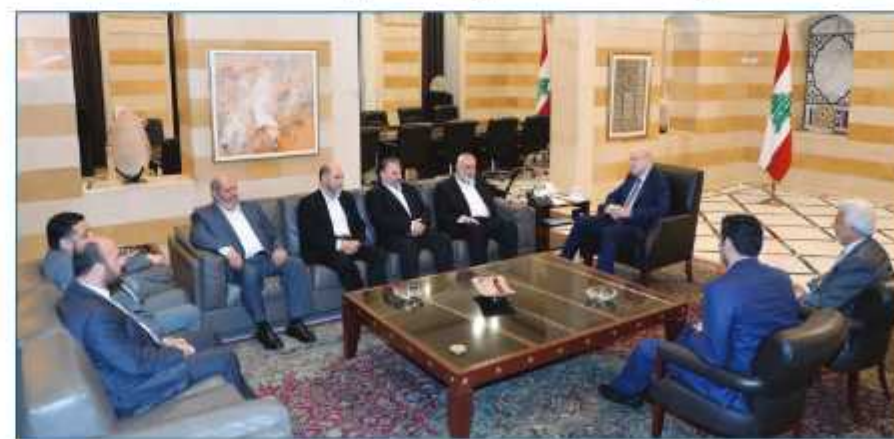
وقد حماس خلال لقائه برئيس الحكومة اللبناني نجيب ميقاتي في بيروت أمس (التأطول)