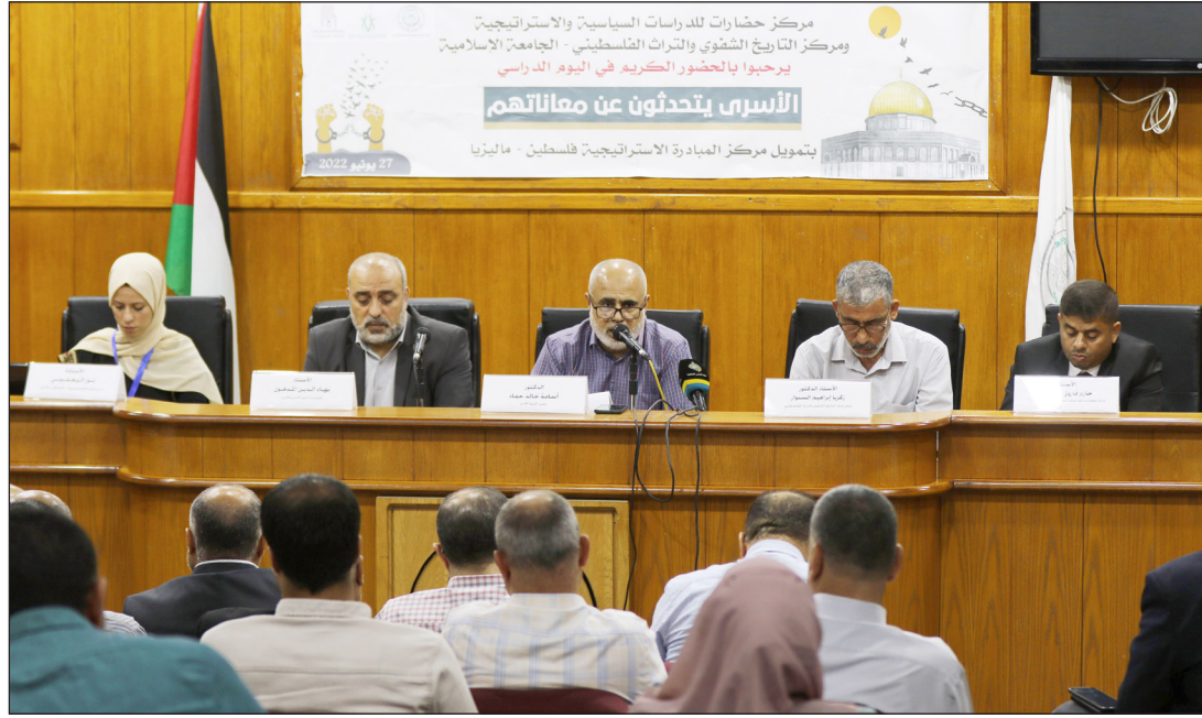
جانب من اليوم الدراسي