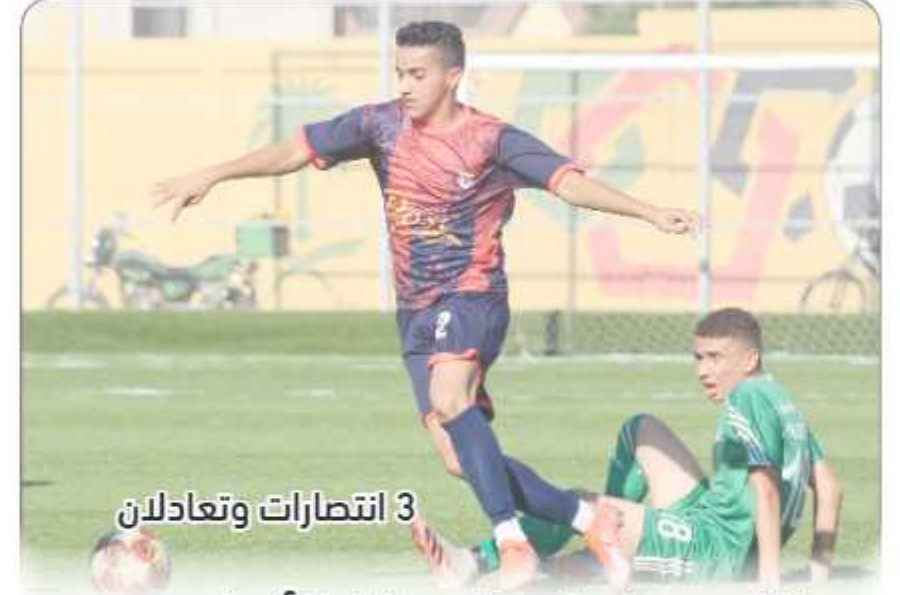
3 انتصارات وتعادلان