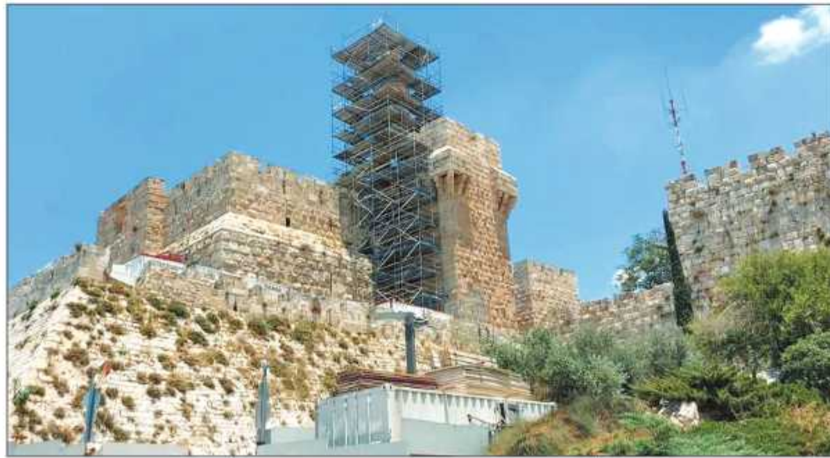
سقالات نصبها الاحتلال أمس في محيط قلعة القدس المحاذية لباب الخليل ضمن مشروع تصويدها