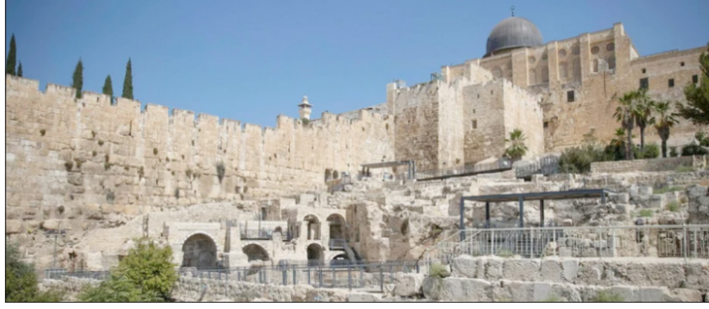
أرض مجاورة للمسجد الأقصى

القدس المحتلة- غزة/ محمد الصفدي: شرعت سلطات الاحتلال الإسرائيلي في تهويد مساحات واسعة من الأراضي في محيط البلدة القديمة والمسجد الأقصى بمدينة القدس المحتلة، بتسجيل ملكيتها باسم مستوطنين. وذكرت صحيفة "هآرتس" العبرية أمس أن حكومة الاحتلال بدأت في تسجيل "عقود ملكية أراضٍ" لأشخاص يهود قرب المسجد الأقصى، وأن وزارة القضاء بدأت الخميس الماضي في عملية تسجيل ملكية الأراضي المجاورة للمسجد المبارك. والأراضي المذكورة تبلغ مساحتها نحو 350 دونما، وهي مملوكة للأوقاف الإسلامية، وتقع بين المقبرة اليهودية وبين سور البلدة القديمة جنوب المسجد الأقصى. وأشارت الصحيفة إلى أن اليهود يحاولون استغلال عملية التسجيل لامتلاك الأراضي المحتلة، في حين يرفض الفلسطينيون التعااطي مع العملية خشية الاستيلاء على أراضيهم بحجج وأهية. وأضافت: في الغالب، رفض الفلسطينيون في القدس هذه العملية، خوفاً من أن تدعي سلطات الاحتلال