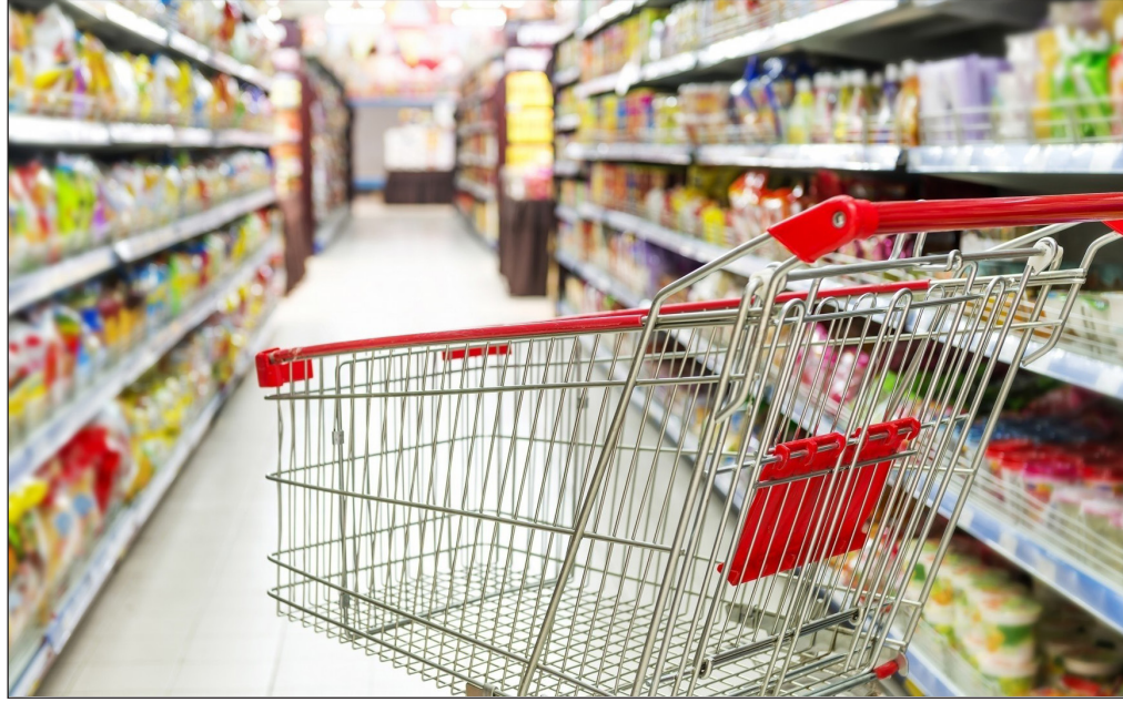
أحد المحال التجارية في الضفة الغربية