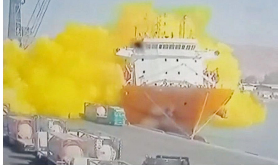
لحظة انفجار الصهريج

عمان/ وكالات: أدى تسرب غاز سام بعد سقوط صهريج في ميناء العقبة جنوبي الأردن، مساء أمس، إلى سقوط قتلى وعشرات الجرحى، حسب ما أفاد به الأمن العام الأردني. وعقب الحادث، أعلنت الحكومة الأردنية تشكيل فريق للتحقيق في حادثة سقوط صهريج الغاز السام في ميناء العقبة، لاتخاذ الإجراءات اللازمة. وتوجه رئيس الوزراء بشر الخصاونة إلى العقبة للوقوف على تداعيات حادثة تسرب غاز سام في مينائها، وتوفي إثر ذلك حتى الآن 13 شخصا وأصيب 251، وفق مصادر أردنية.