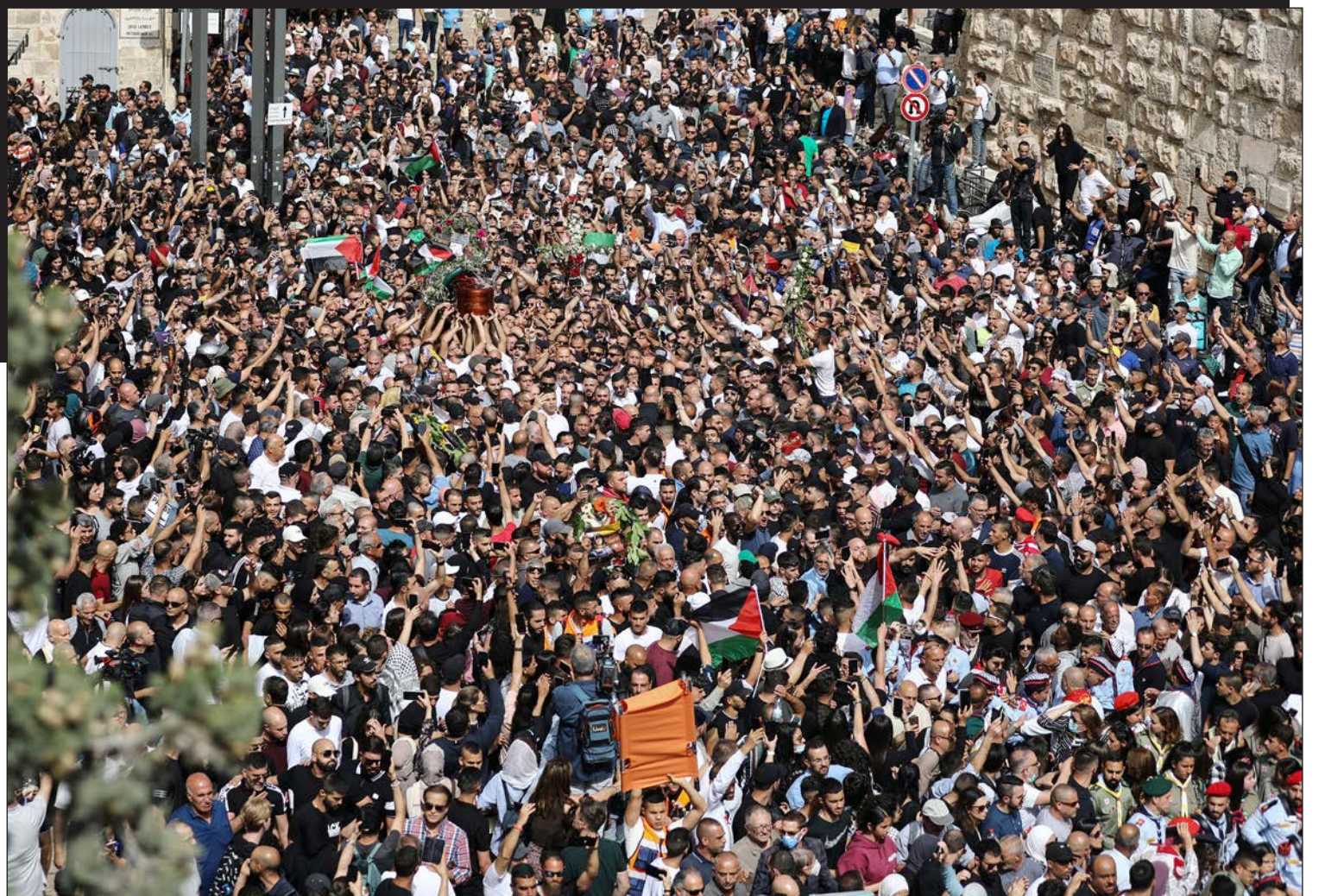
مواطنون يشيعون جثمان الصحفية شيرين أبو عاقلة إلى مثواها في مقبرة جبل صهيون بالقدس المحتلة أمس