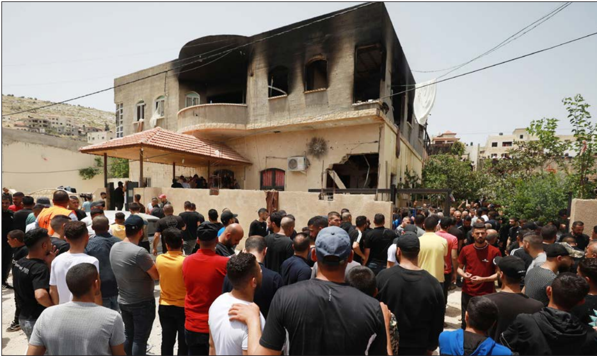
فلسطينيون يقفون أمام منزل عائلة الدبعي الذي حاصرته قوات الاحتلال صباح أمس في جنين

1 شيقل | العدد 5377 | 16 صفحة | WWW.FELESTEEN.PS