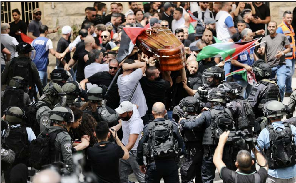
قوات الاحتلال الإسرائيلي تعتدى على المشاركين في جنازة شيرين أبو عاقلة

وندد رئيس رابطة الدول البوليفارية ساشا لوريتني بجريمة اغتيال الصحفية