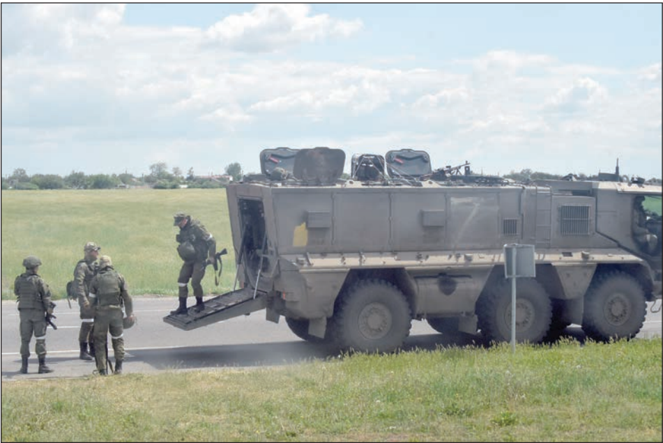
ناقلة تحمل جنودًا روسًا في أوكرانيا أمس

فينيديكتوفا نهاية أبريل/نيسان الماضي إن "أكثر من 800" جريمة حرب مفترضة خُدت في أوكرانيا. من جهة أخرى، وواصلت القوات الروسية هجوماها الرئيسي في محاولة للاستيلاء على مزيد من الأراضي في منطقة دونباس شرقي أوكرانيا. وقالت هيئة الأركان العامة الأوكرانية في بيان أمس: إن هجمات روسيا تركزت على منطقة دونيتسك. وتكبدت القوات الروسية "خسائر كبيرة" في محيط سلوفيانسك شمالي دونيتسك. وقال حاكم منطقة كورسك الروسية، رومان ستاروفويت، إن القوات الأوكرانية قصفت قرية حدودية في المنطقة الواقعة غربي روسيا فجر أمس، مما أسفر عن مقتل مدني واحد على الأقل. وأكد سيرهي غايداي حاكم منطقة لوغانسك شرقي أوكرانيا -عبر تليغرام- مقتل 4 أشخاص وإصابة 3 في قصف لمدينة سيفيرودونيتسك، وحث الناس على الاحتماء لو قرروا عدم المغادرة. وقال أوليكسي أريستوفيتش، المستشار الرئاسي الأوكراني، إن مقاتلين أوكرانيين نسفوا خطا للسكك الحديدية أمام قطار مدرع كان يقل قوات روسية في مدينة ميليتوبول المحتلة جنوبي أوكرانيا. وأضاف -في مقطع مصور نُشر على مواقع التواصل الاجتماعي- "فعلها المحاربون، لكنهم لم يفجروا القطار المدرع نفسه".