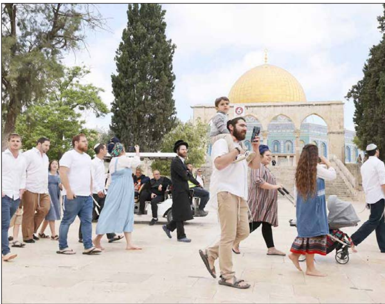
مستوطنون يقتحمون باحات المسجد الأقصى المبارك (أرشيف)

وكانت منظمة "لاهافا" المتطرفة دعت المستوطنين، للمشاركة في مسيرة "الأعلام" السنوية المقررة نهاية شهر أيار/ مايو الجاري،