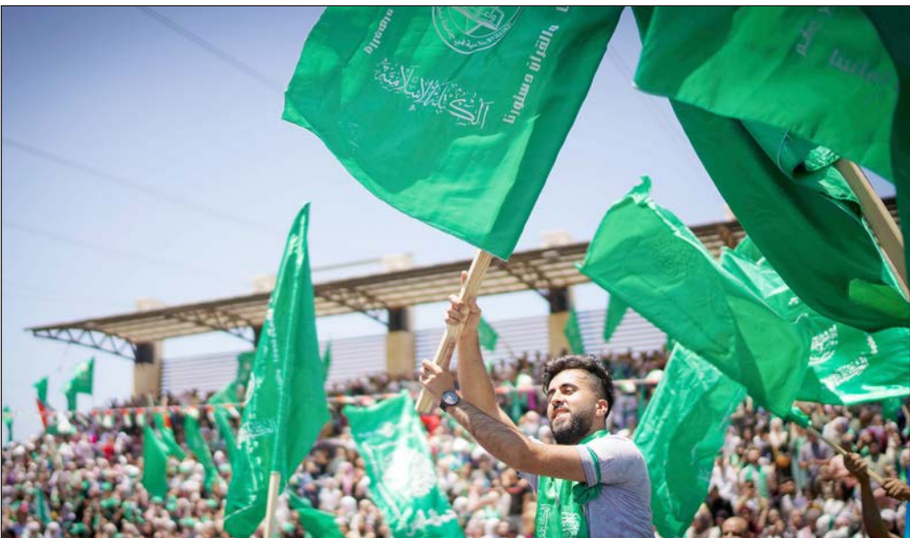
جانب من المهرجان الجماهيري في جامعة بيرزيت أمس

الطلبة، موجهاً رسالة إلى بقية الجامعات الفلسطينية، بالسماح في إجراء العملية الانتخابية. من جهته، قال ممثل كتلة الشبيبة الطلابية في كلمته، إننا جميعاً سنستغل تحت علم فلسطين، موجهاً مباركتها للكتلة الإسلامية وجميع الكتل الطلابية ولأسرة جامعة بيرزيت، بعد نجاح العرس الديمقراطي. وتابع: "نبارك لكم أبناء العياش وأبناء الشيخ أحمد ياسين نجاحكم في انتخابات مجلس الطلبة"، مشيراً إلى أننا سنواصل معكم الحفاظ على هذا الطريق الديمقراطي ونهج الشهداء الأبطال. وفي كلمة له بالمهرجان، هنأ القيادي في حركة الجهاد الإسلامي الشيخ خضر عدنان، الكتلة الإسلامية بهذا الفوز، مؤكداً أنه أكبر رد على الاحتلال الإسرائيلي. أما عمار بنات، قريب الشهيد نزار، فقال في كلمته، إن الجيل الجديد يفاجئ بأنه لا ينسى ولا يغفر، ويعرف البوصلة الحقيقية في أي اتجاه، ويعرف جيداً بوصلة الوطن والوطنيين، ويعرف وجهة الفساد والفاستدين، موجهاً التحية إلى الأطر الطلابية التي تسير على نهج المقاومة.