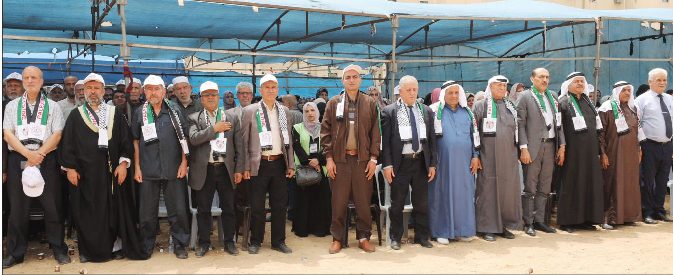
جانب من المهرجان

غزة/ أدهم الشرفي: أكدت فصائل فلسطينية، أن فلسطين دولة واحدة لا تقبل القسمة على اثنين، مؤكدة رفضها وإدانتها لانتهاكات الاحتلال الإسرائيلي التي كان آخرها اغتيال الصحفية المقدسية شيرين أبو عاقلة، الأربعاء الماضي. وشددت الفصائل خلال مهرجان أقيم في شمالي قطاع غزة، أمس، بمناسبة حلول الذكرى الـ 74 للنكبة الفلسطينية، على أن مساعي الاحتلال ومشاريعه لتقييد حقائق النكبة وذكرائها عن الأجيال الحديثة في فلسطين، فشلت جميعاً. وعقد المهرجان بحضور لافت من قيادات فصائلية، وشخصيات أكاديمية، ولفيف واسع من المواطنين والمهتمين وسط أجواء تراثية فلسطينية أصيلة تعيد للأذهان مشاهد من حياة الفلسطينيين قبل نكبة عام 1948.