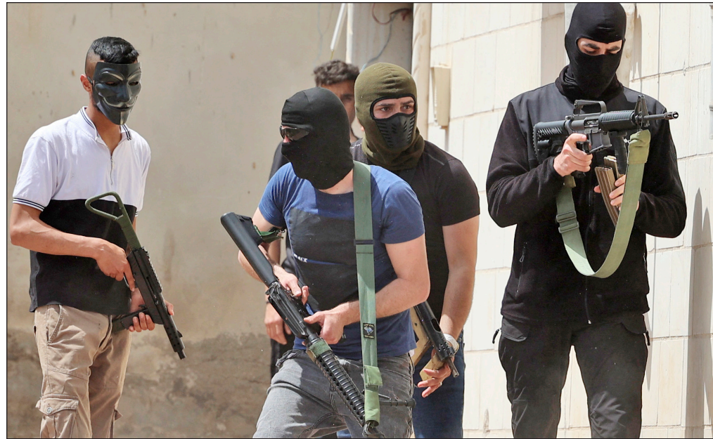
مسلحون فلسطينيون يتصدون لاقتحام قوات الاحتلال جنين

الدوحة/ فلسطين: دعا رئيس حركة المقاومة الإسلامية حماس في الخارج، خالد مشعل، إلى الالتفاف حول برنامج المقاومة وتعزيز صمودها، والانخراط في برنامج نضالي مفتوح في وجه انتهاكات الاحتلال، مشيداً بالمقاومة في الضفة الغربية المحتلة، ومخيم جنين مؤنل البطولة والمقاومة. ودعا مشعل في تصريحات صحفية، أمس، إلى وحدة فلسطينية حقيقية على أساس برنامج المقاومة لدرح الاحتلال الإسرائيلي عن أرضنا، ومقاطعة الاحتلال وعزله، ووقف التعاون الأمني معه، والالتقاء والالتحام وطنياً على برنامج المقاومة الذي سيغير الاحتلال على التراجم، مشدداً على أن شعبنا قادر على هزيمة الاحتلال وتطهير أرضنا.