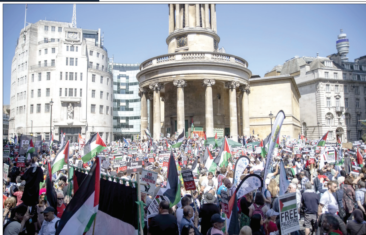
تظاهرة للتنديد بالاحتلال الإسرائيلي للأراضي الفلسطينية في ذكرى النكبة الـ 74 وسط لندن أمس