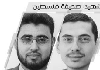
شهيداً صحفية فلسطين