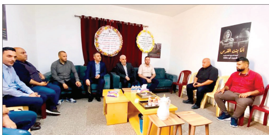
يحيى السنوار يؤدي واجب العزاء باستشهاد "أبو عاقلة" بمكتب قناة الجزيرة في غزة أمس

غزة/ فلسطين: زار رئيس حركة المقاومة الإسلامية حماس في قطاع غزة يحيى السنوار، أمس، مكتب قناة الجزيرة في غزة؛ للتعزية باستشهاد الصحفية شيرين أبو عاقلة، واصفاً إياها بأنها أيقونة للإعلامية الفلسطينية التي واكبت تغطيتها للقضية وأحداثها على مدار 27 عاماً. وقدم السنوار تعازيه الحارة لزملاء أبو عاقلة في قناة الجزيرة وإدارة القناة. ولفت إلى الذكرى السنوية الأولى لاستهداف الاحتلال مقر قناة الجزيرة،