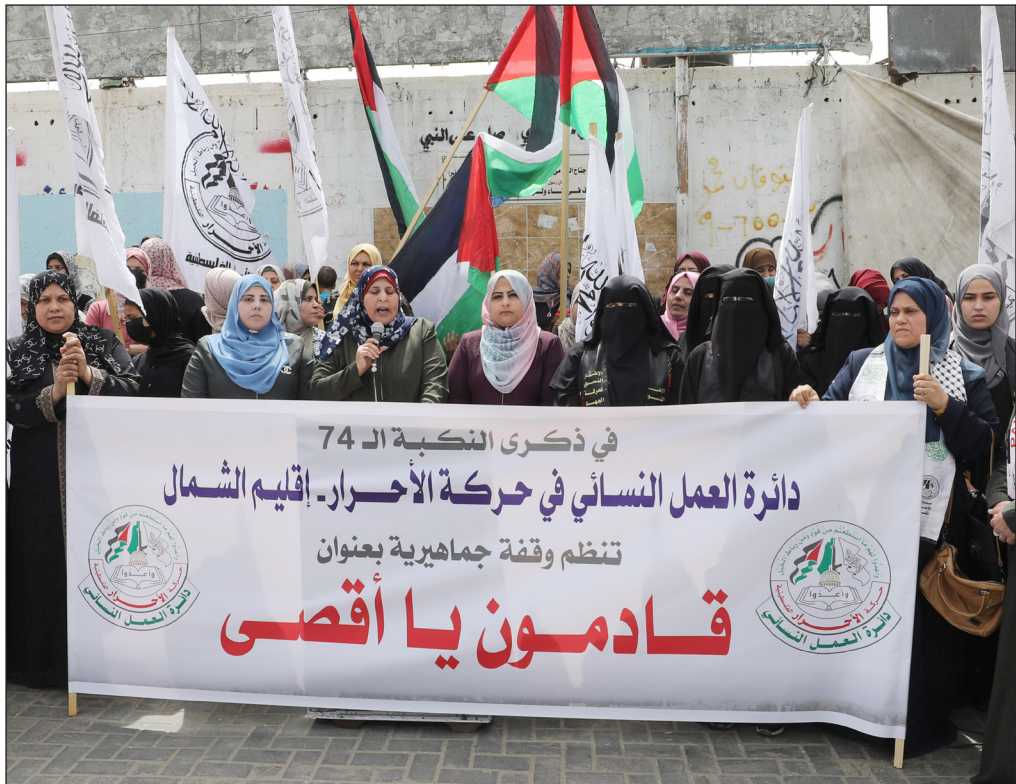
جانب من الوقفة

استرداد حقوقه. كما أكدت أهمية إبقاء جذوة الصراع مشتعلة بشكلياتها العسكري والشعبي في كل مناطق الضفة الغربية والقدس والداخل المحتل، بهدف زيادة تخطيط الاحتلال، وإضعافه وإفقاذه السيطرة على الميدان.