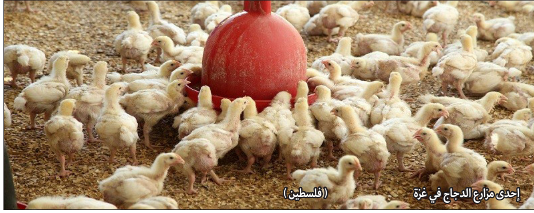
إحدى مزارع الدجاج في غزة (فلسطين)

الشحن بسبب تداعيات جائحة كورونا. وأشار أبو حمد إلى أن سعر طن العلف قفز في عام فقط من 2500 شيقلاً إلى 3000 شيقلاً ما يشكل تحدياً أمام المربين، إذ إنهم غير قادرين على رفع الأسعار في وقت أن المستهلك الفلسطيني خاصة الغزي يعيش أوضاعاً اقتصادية صعبة لا يقدر على الشراء بالسعر الجديد المرتفع.