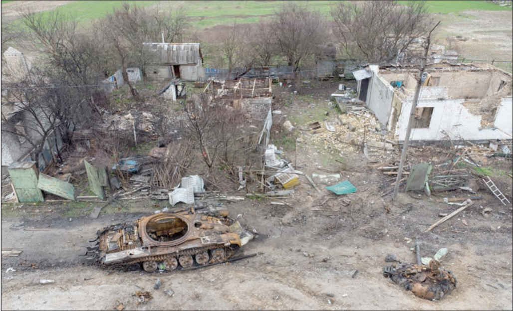
حطام دبابة بجوار منازل سكنية مدمرة شمال شرقي كييف أمس

ويأتي الحكم بعدما رفضت المحكمة العليا في المملكة المتحدة، في مارس/ آذار الماضي، منح الإذن لأسانج لاستئناف حكم