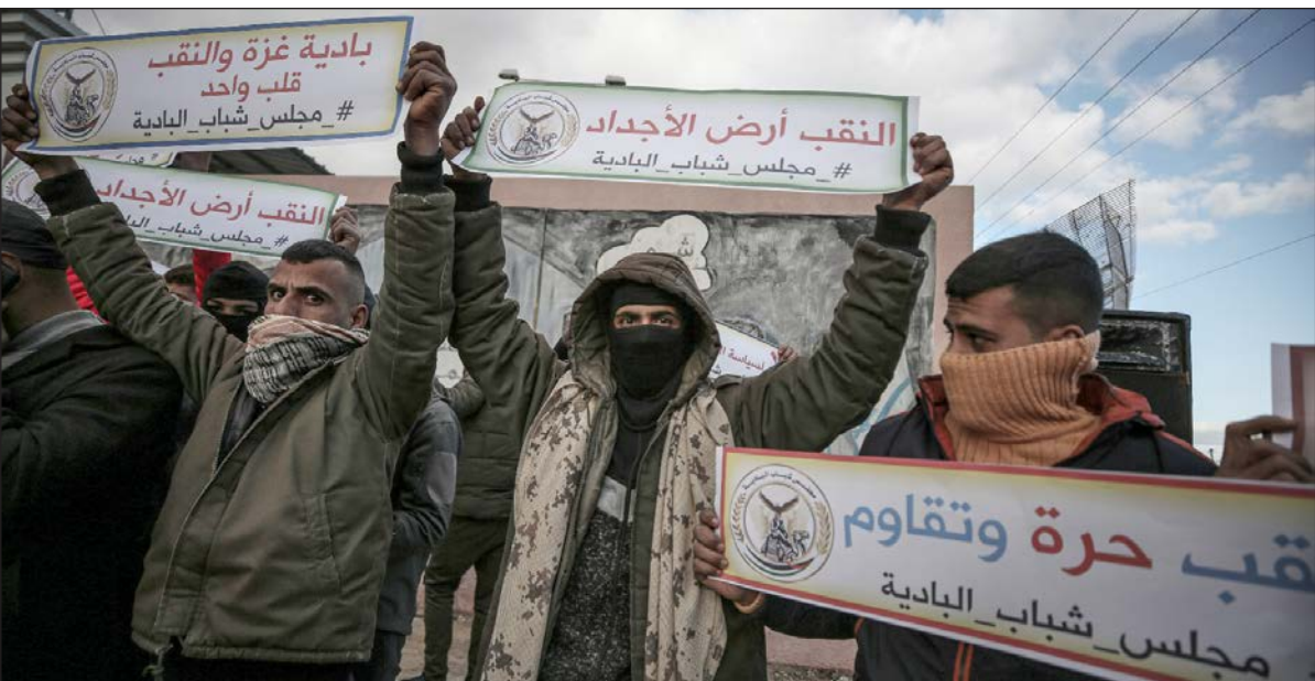
وقفة بمدينة غزة دعمًا لأهالي النقب في مواجهة اعتداءات قوات الاحتلال الإسرائيلي