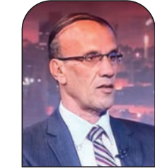
علي بدوان جريدة الوطن العمانية

بدأ التحقيق مع بنيامين ننتياهو عام 2016 بعد انتخابه للمرة الرابعة رئيسا للحكومة الإسرائيلية. ووجّهت له شبهات الرشوة والاحتيال وخرق الأمانة، وبعد أن توصّلت الشرطة إلى استنتاج بأن لديها ما يكفي من الأدلة والبيّنات لإدانته، سطرّت توصية بتقديم لائحة اتهام ضده، وبعد فحص التوصية، قرّرت النيابة العامة توجيه التهم ضده في ثلاثة ملفّات أطلقت عليها تسميات بالآلاف: