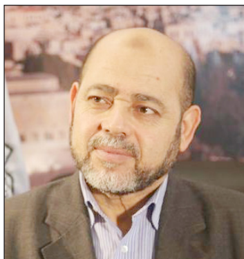
موسى أبو مرزوق

الارتكاز على مخرجات مؤتمر الأمناء العامين الأخيرة وضرورة التحضير الجيد والمسؤول له قبل عقده بالتوافق الوطني الشامل.