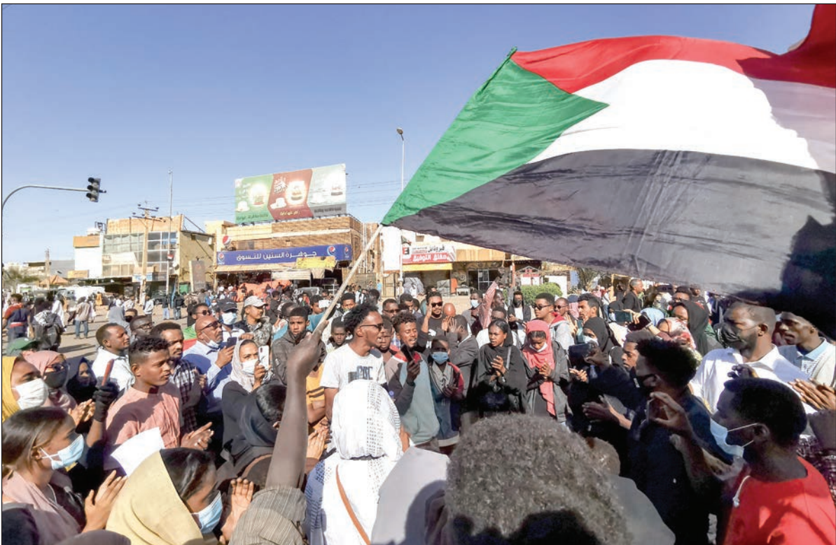
جانب من تظاهرات العاصمة الخرطوم أمس

ومنذ 25 أكتوبر/تشرين الأول الماضي، يفور السودان باحتجاجات، ردا على إجراءات "استثنائية" اتخذها قائد الجيش عبد الفتاح البرهان، أبرزها فرض حالة الطوارئ وحل مجلسي السيادة والوزراء الانتقاليين، وهو ما تعتبره قوى سياسية "انقلابا عسكريا"، في مقابل نفي الجيش لذلك.