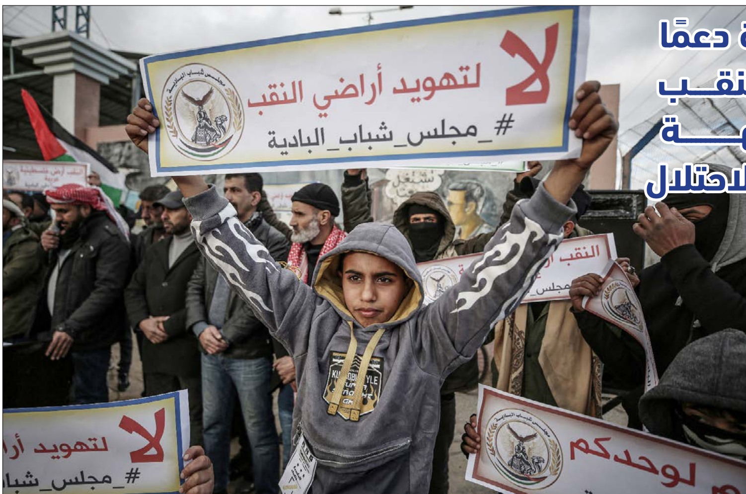
وقفة بمدينة غزة دعمًا لأهالي النقب في مواجهة اعتداءات الاحتلال أمس

غزة/ فلسطين: شارك مواطنون في قطاع غزة، أمس، في وقفة تضامنية؛ دعمًا لأهالي النقب المحتل في مواجهة اعتداءات الاحتلال. وشهد النقب خلال الأيام الماضية احتجاجات لمواطنين فلسطينيين ضد تجريف أراضيهم وزراعتها بالأشجار توطئة لسلبها، من قبل الصندوق القومي اليهودي، وهو منظمة تجمع الأموال من اليهود بالعالم لوضع اليد على الأملاك الفلسطينية. ورفع المشاركون في الوقفة التي نظمها "مجلس شباب البادية" في قطاع غزة (غير