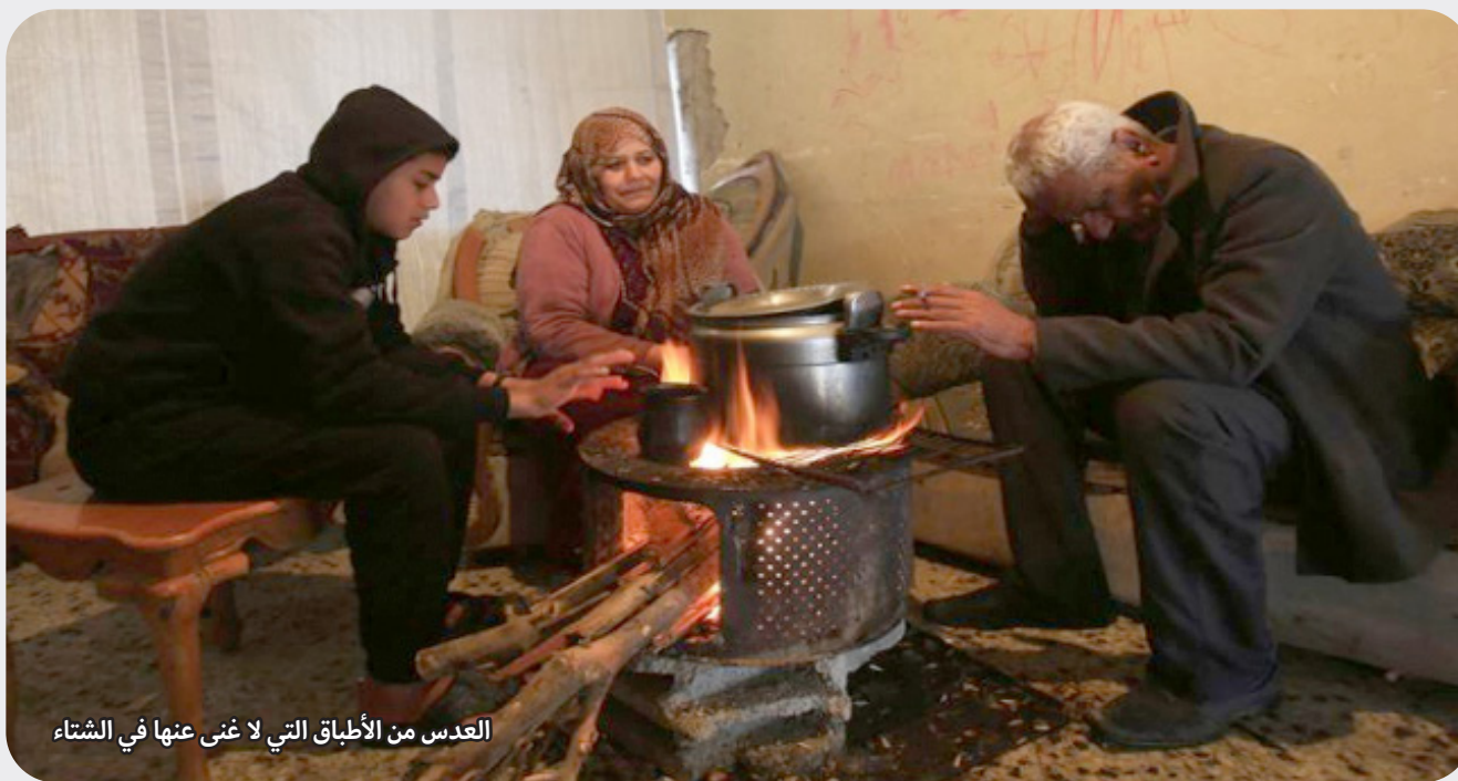
العدس من الأطباق التي لا غنى عنها في الشتاء