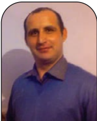
عميرة أيسر راي اليوم

عمل الكيان الصهيوني منذ نشأته الاستيطانية سنة 1948م، على تحييد والقضاء على كل التهديدات الأمنية التي مثلتها الدول والحركات العربية المقاومة، اعتماداً على قوته العسكرية الهائلة، المستمدة من العلاقات الإستراتيجية الطبيعية التي نسجها مع الدول الغربية الكبرى، التي أمدته بكل ما يحتاج إليه من أجل البقاء والاستمرار والتفوق، من الناحيتين الأمنية والاقتصادية، وتعد أمريكا الرافعة الإستراتيجية، والبلد الذي أحبط كل المحاولات الإقليمية أو حتى الدولية، لإدانة جرائمه التي ارتكبها في حق الشعب الفلسطيني، أو جيرانه العرب، وعرق كل المشاريع والقرارات الأممية التي تهدف لإقامة دولة فلسطينية مستقلة على حدود 1967م.