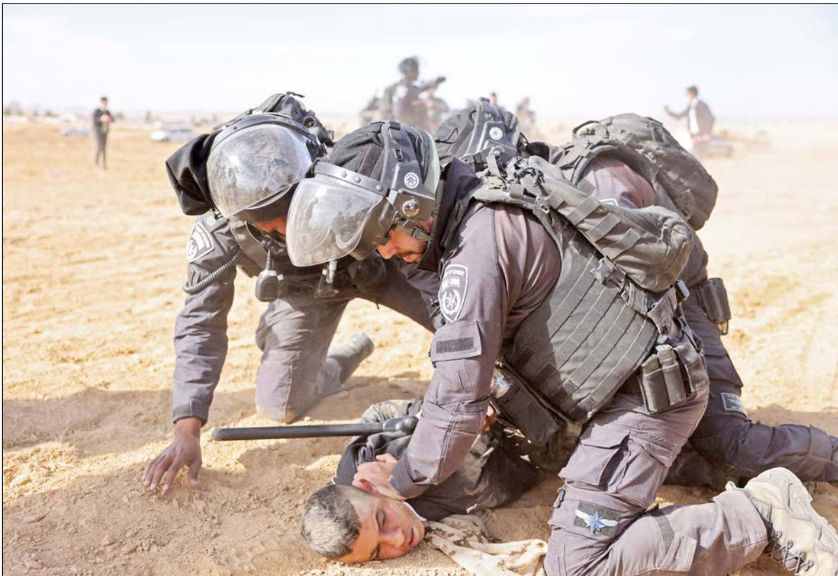
اعتداء قوات الاحتلال الإسرائيلي على مواطن فلسطيني في النقب (أرشيف)

وأشار المركز في رسالته إلى أن أحد منزلي عائلة صالحية يمثل جزءاً من مبنى الحاج أمين الحسيني (التاريخي) الذي ظهر في وثائق قبل مائة عام، من خلال صور التقطها طيارون ألمان خلال الحرب العالمية الأولى، وأيضاً في خرائط الاحتلال البريطاني لفلسطين، معتبرا جريمة الهمد اعتداءً صارخاً على التراث التاريخي والثقافي للشعب الفلسطيني. وأضاف أن جريمة الهمد تمثل انتهاكا لقواعد القانون الدولي التي تقترض توفير الحماية للأعيان المدنية والثقافية والتاريخية، واتخاذ التدابير اللازمة لتجنب تعريضها للخطر باعتبار هذه الأعيان ميراث حضاري للإنسانية يجب حمايته وعدم الإضرار به. وكشفت صحيفة "هآرتس" العبرية أمس، أن بلدية الاحتلال في القدس هدمت منزل عائلة صالحية رغم معرفتها المسبقة بأنه "مبنى تاريخي" يجب الحفاظ عليه. وبحسب الصحيفة، فإن منزل عائلة صالحية جزء من منزل عائلة الحاج أمين الحسيني التاريخي، مردفة أن هدمه نفذ رغم قرار "اللجنة المحلية للتنظيم" التابعة للاحتلال بعدم هدمه.