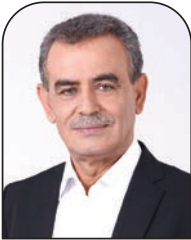
جمال زحالقة القدس العربي

قد يكون من المبكّر رثاء ننتياهو، فالهوّه بشأن «صفقة الاعتراف» تبدو غير قابلة للجسر في الفترة القريبة، إلا إذا فاجأ ننتياهو الجميع ووافق على شروط المستشار القضائي الإسرائيلي. وعلى الرغم من عدم وضوح الصورة بالنسبة لخروج أو بقاء ننتياهو، فقد طفت على السطح حرب الوراثة على قيادة الليكود، وتبين من استطلاعات الرأي، أن قوّة هذا الحزب ستراجع كثيرا إذا جرى استبدال ننتياهو. كما أجمع المحلّون على أن حكومة بينيت لن تعمّر طويلا في ظل فتح المجال للتحالف مع ليكود ما بعد ننتياهو. ما يجري في السياسة الداخلية الإسرائيلية، يلقي ظله الثقيل على المنطقة بأسرها، خصوصا على الشعب الفلسطيني، وإذا كان ننتياهو (في الحكومة وحتى في المعارضة) اللاعب السياسي المركزي في العقد الأخيرة، فإن خروجه سيجمل معه تغييرا في الاصطفاف الحزبي في (إسرائيل)، التي قد تشهد مرحلة جديدة من عدم الاستقرار السياسي، الذي يمكن استغلاله للصالح الفلسطيني، إذا كان هناك من يحسن الاستفادة من الفرص، خاصة وأن بينيت (الموقّت) وأي رئيس وزراء إسرائيلي قادم سيكون أضعف من ننتياهو.