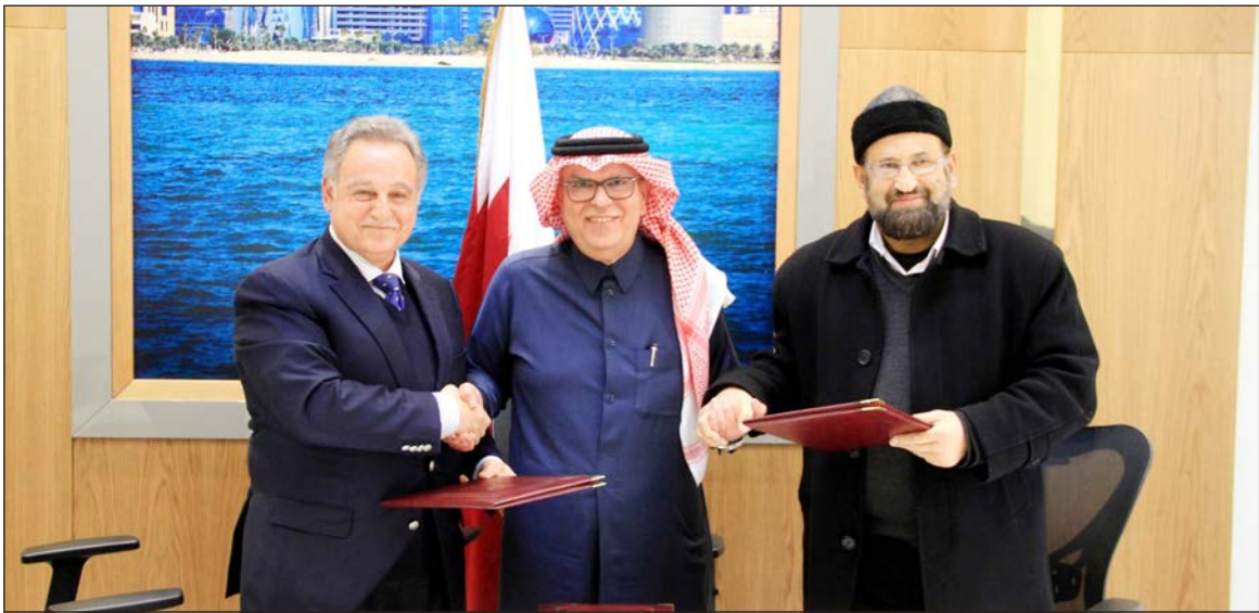
جانب من توقيع الاتفاق

وأكد الحسنيات لصحيفة "فلسطين" أن إفساح المجال للشباب لبدء مشاريعهم يبقى أحد الحلول في ظل الظروف السياسية