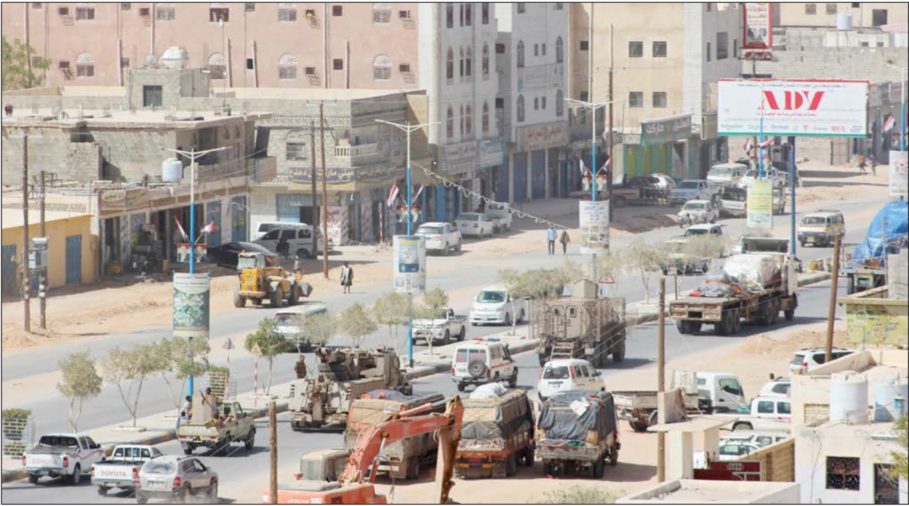
آليات عسكرية تتوجه إلى محافظة شبوة في إثر اشتداد المعارك بين القوات المدعومة من التحالف والحوثيين (أ ف ب)

التحالف بإحباط هذه الهجمات، رغم الدعوات العربية والدولية للالتزام بوقف إطلاق النار. ويشهد اليمن منذ نحو 7 سنوات حرباً مستمرة بين القوات الموالية للحكومة المدعومة بتحالف عسكري عربي تقوده الجارة السعودية، والحوثيين المدعومين من إيران، المسيطرين على عدة محافظات بينها العاصمة صنعاء منذ سبتمبر/ أيلول 2014.