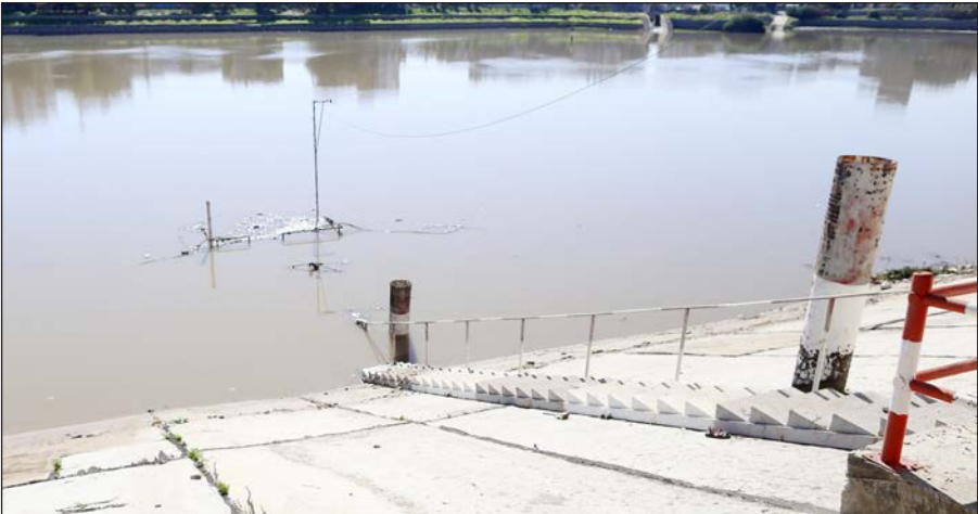
بركة الشيخ رضوان