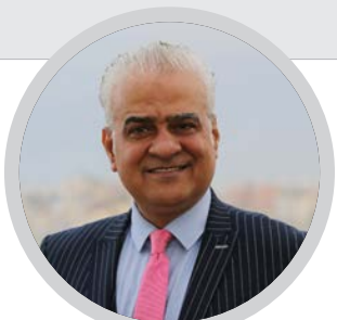
كتب / خالد أبو زاهر:

بناء على مصدر موثوق به نقل عنه الرميل مؤمن الكحلوت بأن لجنة تقييم الحالة الفنية قد أنهت أعمالها، وأنها ستُسلم اتحاد كرة القدم تقريرها، فقد بتنا قريبين من معرفة النتائج. وقبل الحديث عن النتائج، لا بُد أن نؤكد أن الجميع ينتظر معرفة الحقيقة أولاً، والمتمثلة في وضوح الصورة دون أي تشويش، فالتوصيات والقرارات إن أعلنت أولاً ستكون بمنزلة الكشف عن الحقيقة وهي هل اتحاد كرة القدم قرر التغيير أم أن الأمر لن يتجاوز الروتين!