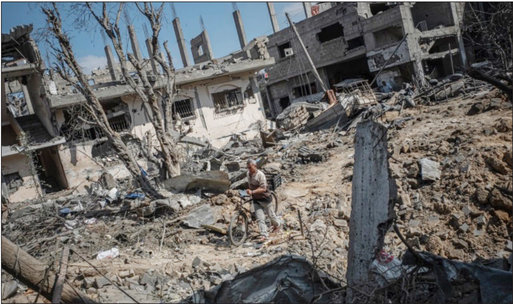
الدمار الذي خلفته آلة الحرب الصهيونية خلال الحرب الأخيرة على غزة

مشيرة إلى أن الأراضي المتاخمة للسياح الفاصل تعد سلة غذائية للمواطنين، إلا أن المحتل يلتهمها ولا يسمح للأهالي باستثمارها.