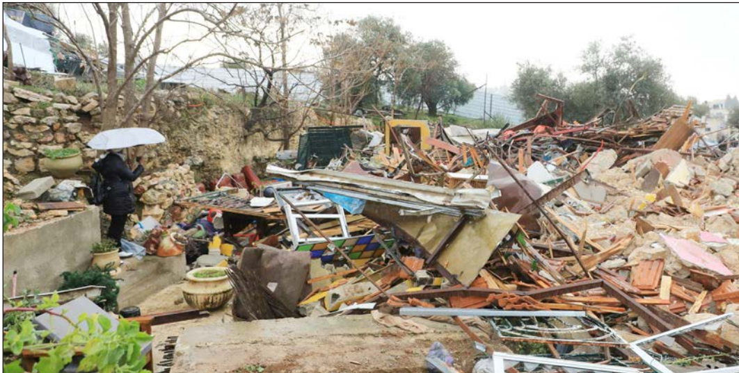
منزل عائلة صالحية بعد أن قامت قوات الاحتلال الإسرائيلي يهدمه

وقال مدير برنامج العدالة الدولية في المركز كريسيين بلانت، "إن القضايا في حي الشيخ جراح تسلط الضوء على قرن من الظلم التاريخي الذي تعرض له الشعب الفلسطيني فردياً وجماعياً". وأضاف بلانت أنه: "من أجل إنسانيتنا، يجب أن تكون قضية الشيخ جراح نقطة تحول، حيث تبدأ العدالة وإنسانيتنا المشتركة في الاعتبار أكثر من مخاوف الناس مدفوعة بالخوف".