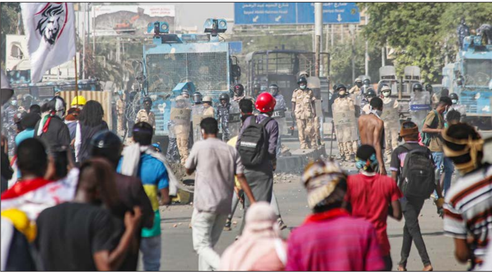
اشتباك بين قوات الأمن السوداني والمتظاهرين

المعتقلين السياسيين. لكن في 2 يناير/كانون الثاني الجاري، استقال حمدوك من منصبه، في ظل احتجاجات رافضة لاتفاقه مع البرهان ومطالبة بحكم مدني كامل.