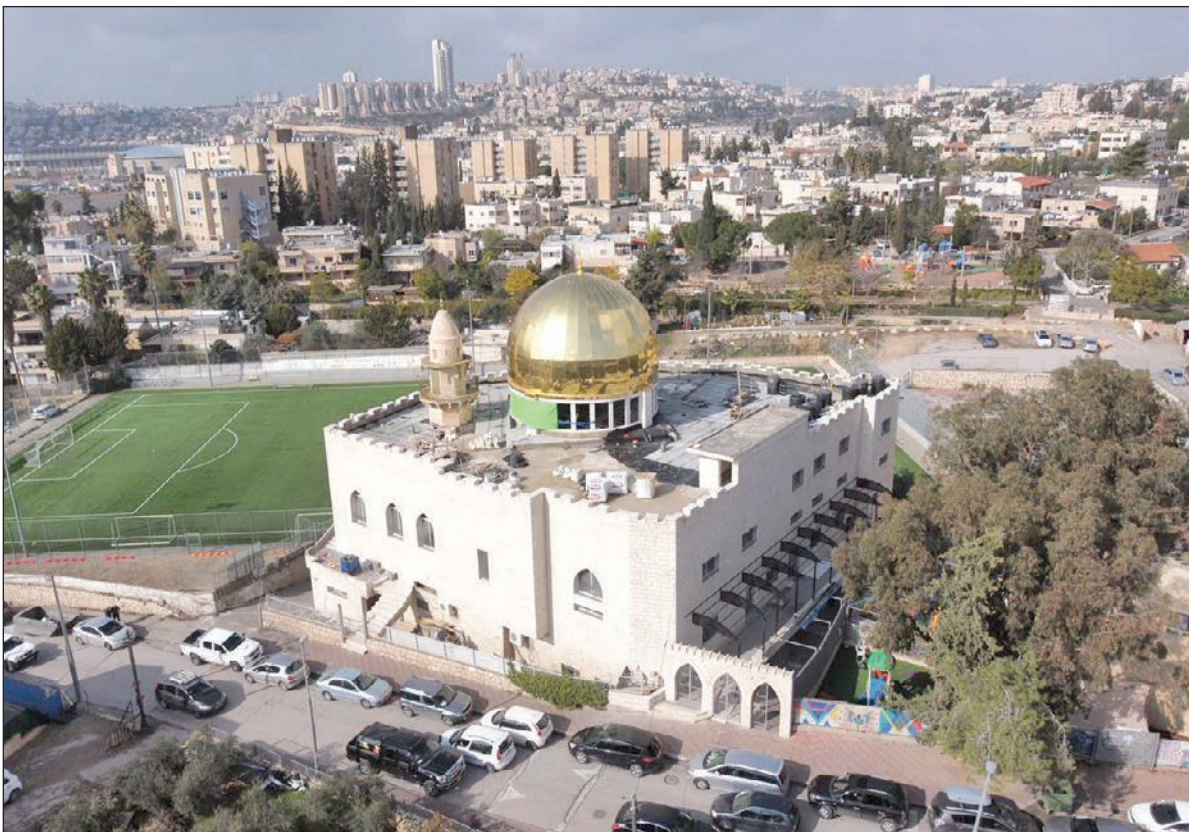
القبة الذهبية المقامة حديثاً في مسجد الرحمن ببيت صفافا بالقدس والتي أصدر الاحتلال قراراً بهدمها

وشهدت الحملة منذ انطلاقتها تفاعلاً على منصات التواصل، إضافة إلى المشاركات على صفحات العديد من النشطاء عبر منصة "الفيسبوك".