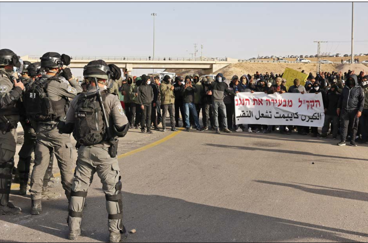
تظاهرة شعبية حاشدة في النقب تنديدًا بأعمال تجريف الأراضي

محافظات/ عبد الله التركماني: أصيب العشرات بالرصاص المعدني المغلف بالمطاط وبالاختناق، أمس، خلال قمع شرطة الاحتلال تظاهرة شعبية حاشدة في منطقة النقب