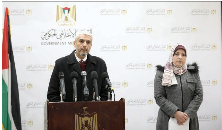
جانب من المؤتمر الصحفي أمس