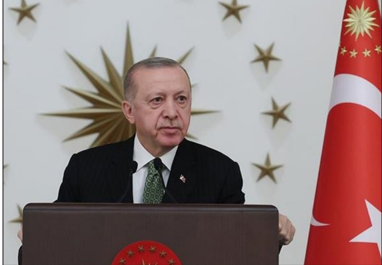
الرئيس رجب طيب أردوغان

وأكد على أن تركيا ساهمت في إحلال الأمن والاستقرار شمالي سوريا من خلال عملياتها العسكرية ضد تنظيمي "الدولة" و"ي ب ك". وأشار إلى أن المناطق المحررة شمالي سوريا تحتضن حوالي 4 ملايين سوري، رغم استمرار هجمات النظام السوري وتنظيم "ي ب ك/ بي كا كا" الإرهابي على المناطق المدنية. وأضاف أن التواجد التركي في شمال سوريا ساهم من جهة في الحفاظ على وحدة هجرة جديدة من جهة أخرى. وأردف أن جهود بلاده ساهمت أيضا في الجبلولة دون تكرار حوادث غرق الأطفال في البحر مثل الطفل أيلان، فضلا عن توفيرها البيئة المناسبة لعودة حوالي 500 ألف سوري إلى بلادهم بشكل طوعي. وتابع قائلا: "رغم كل هذه الحقائق، فإن تركيا لم تتلق الدعم المناسب من الاتحاد الأوروبي خلال مكافحة أزمة الهجرة". وزاد: "الاتحاد الأوروبي لم ينفذ حتى الآن برنامج القبول الإنساني الطوعي الذي يفتح باب الهجرة القانونية للسوريين، كما لم يدعم جهود تركيا في إنشاء المشاريع السكنية والبنية التحتية في المناطق