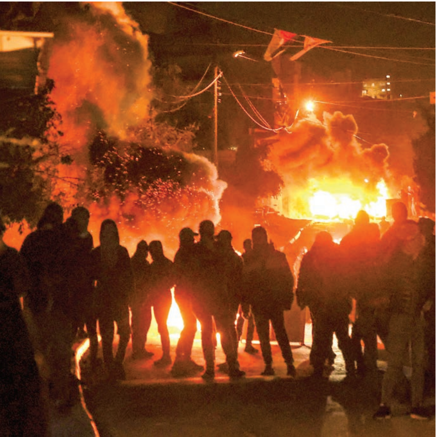
مواجهات بين الفلسطينيين وجنود الاحتلال في النقب أمس

وبين أن حكومة بينيت مرتبكة جداً تجاه ما يحدث في النقب، وهناك أوساط تدعو لإجراء خطط الحكومة هناك، وليس التوقف النهائي، إلى حين إعادة الحكومة ترتيباتها وحساباتها. واستدرك عرابي: أن "ثمة أوساط في الحكومة تعارض عملية التأجيل، والمعارضة تترصدهم بحكومة بينيت المكونة من أوساط سياسية منابها متعددة ومختلفة ومتباينة، وأي حدث يؤثر في هذه الحكومة، لكن في ذات الوقت أطراف الحكومة معنية بعدم انهيارها مهما بلغت الخلافات بينهم من أجل عدم عودة بنيامين نتنياهو الذي يترصد بهذه الحكومة". وقال إن "حكومة بينيت مرتبكة لن تستطيع التعامل مع الكثير من الملفات بمرونة وأريحية بسبب طبيعتها الهشة".