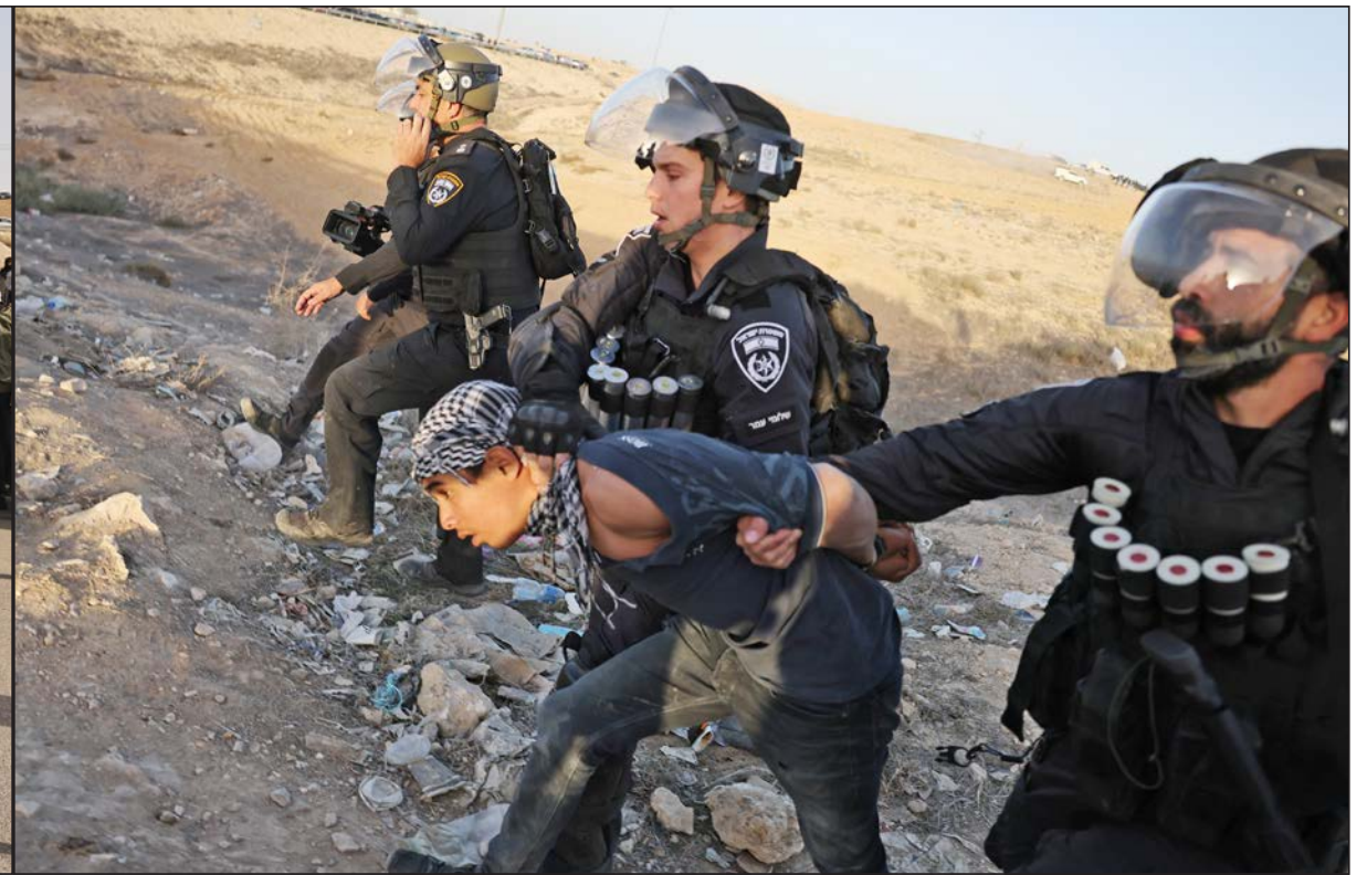
قوات الاحتلال تعتقل شابًا خلال المواجهات في النقب المحتل

المفتي يحث المواطنين على الدفاع عن مساجدهم "التقوى" و"الرحمن".. مسجدان مقدسيان يواجهان خطر الهدم الإسرائيلي