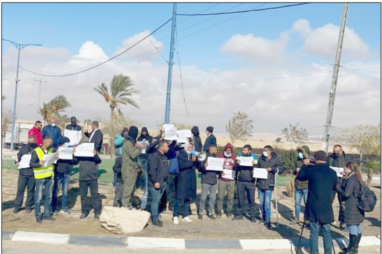
مشاركون في وقفة احتجاجية في قرية عرعة النقب أمس (فلسطين)

وذكرت شبكة "آي 24" العبرية في تقرير لها أمس، أنه منذ توقيع اتفاقية التطبيع