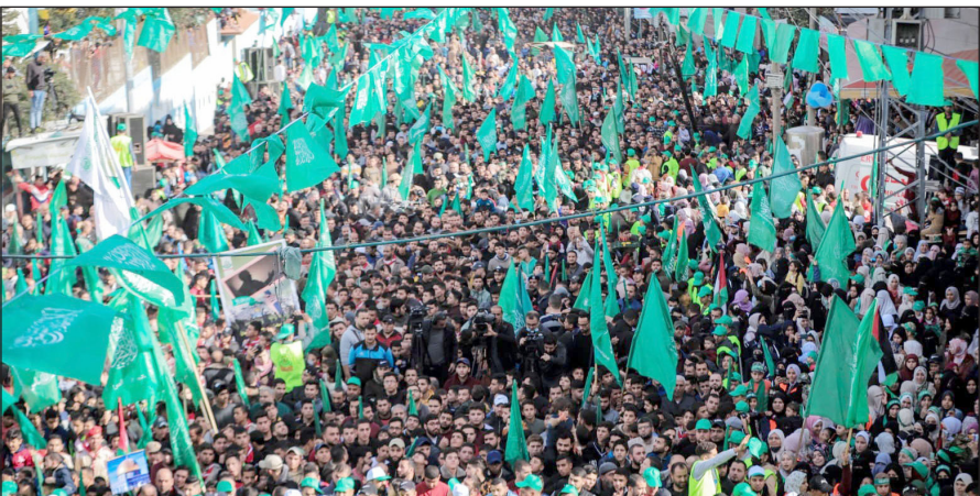
مشاركون في مهرجان جماهيري لحركة حماس (أرشيف)

وكالة أمنية للاحتلال وأكد النائب عن كتلة التغبى والإصلاح