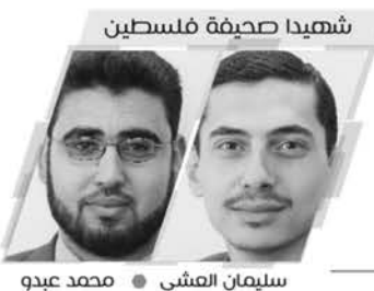
شهيذا صحفية فلسطين

بريد عام info@felesteen.ps أخبار edit@felesteen.ps Fax : 2886127 إعلانات adv@felesteen.ps Fax : 2886285