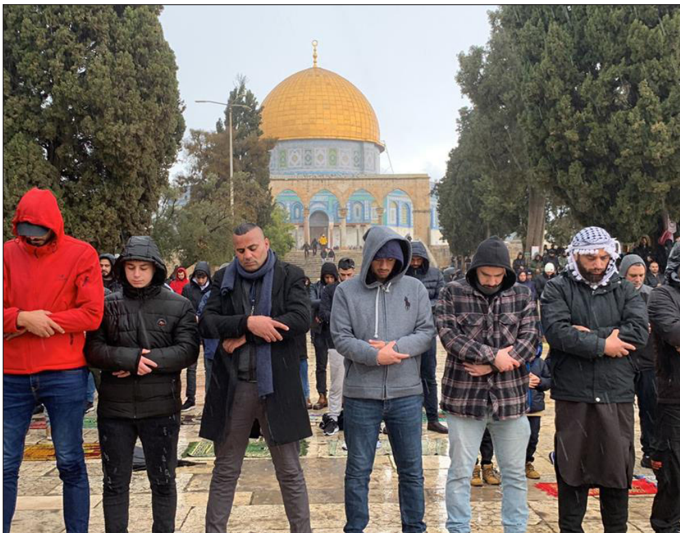
أداء صلاة الجمعة في باحات المسجد الأقصى ( فلسطين )