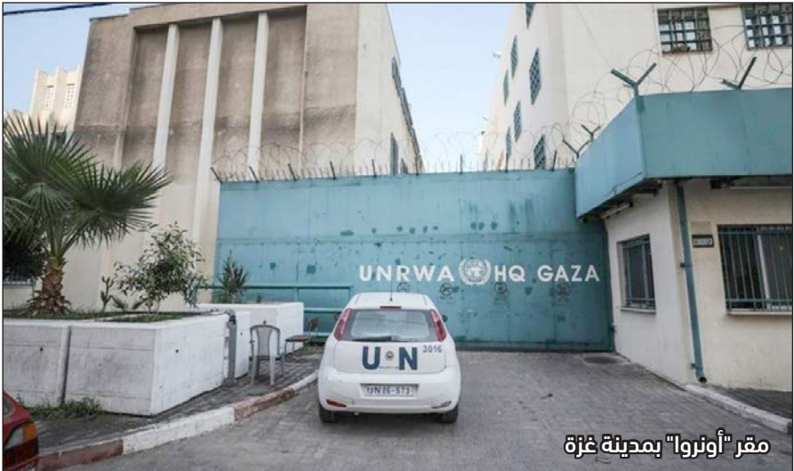
مقر "أونروا" بمدينة غزة

أخرى. وأضاف الأعرج لصحيفة "فلسطين" أن قرار المقاطعة يستند إلى ماطلة وكالة الغوث في تعويض المقاولين في المشاريع القائمة تحت التنفيذ عن الارتفاع غير المسبوق في أسعار المواد والانخفاض الحاد في سعر صرف عملة الدولار مقابل الشقيل. وعذّر رئيس الاتحاد أن القرار جاء أيضاً بعد تراجع الوكالة عن التفاهمات التي يتم التوافق عليها في الاجتماعات المشتركة؛ ما اضطر الاتحاد إلى مقاطعة الدخول في أي عطاءات تطرحها "أونروا" حتى حل كل الإشكالات المتراكمة في هذا الخصوص.