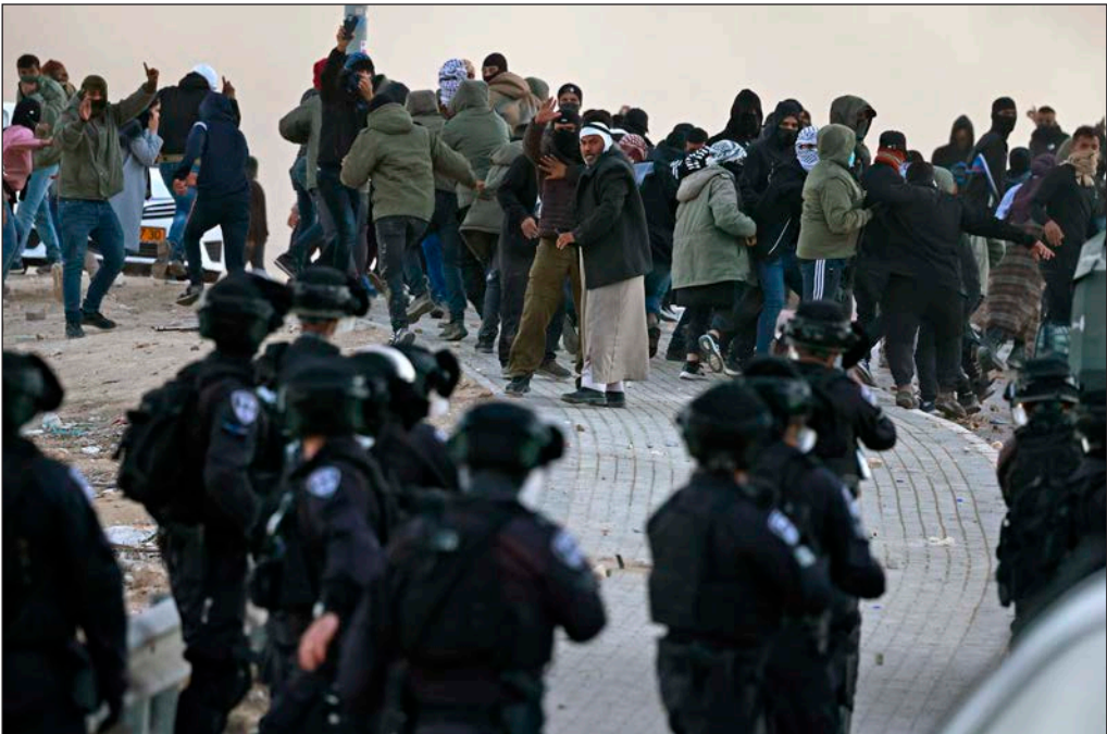
قوات الاحتلال تقمع تظاهرة في النقب أمس

"الجهاد": كما انتفض شعبنا في "سيف القدس" سينتفض للنقب