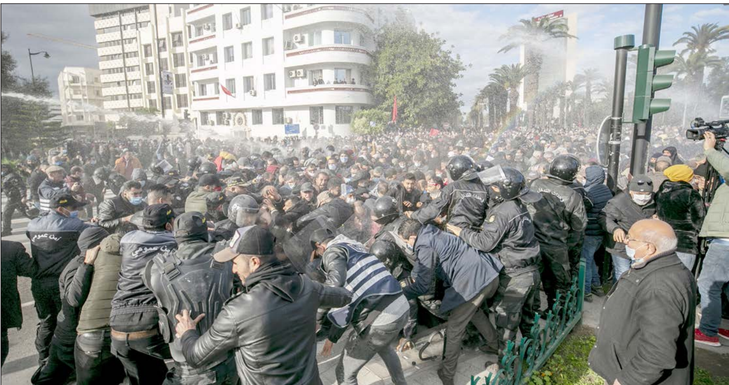
اعتداء قوى الأمن التونسية على المتظاهرين في أثناء فعاليات إحياء ذكرى الثورة أمس

في قضايا الشغالين"، و"نرفض بيع البلاد والارتها