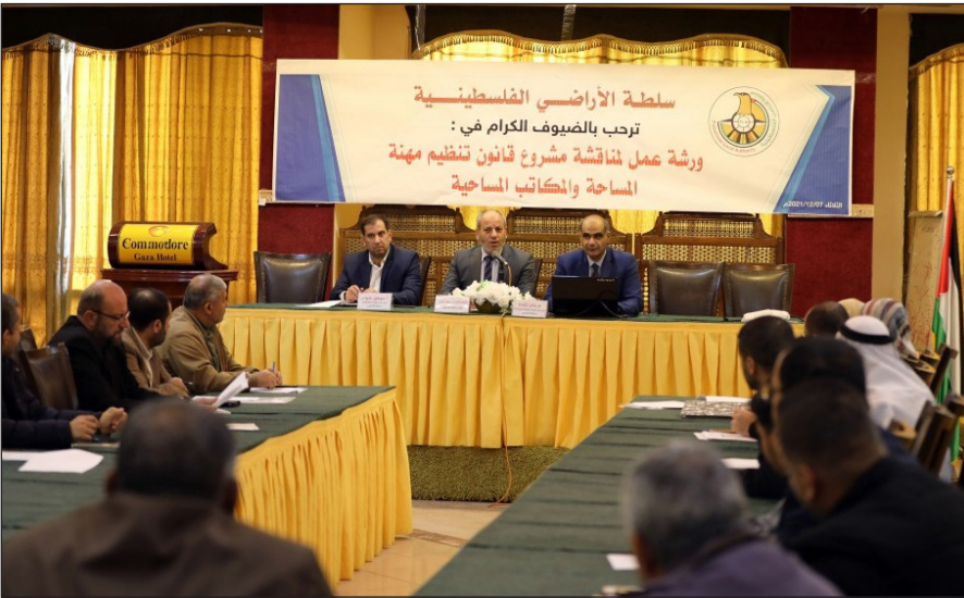
جانب من ورشة العمل في غزة أمس (فلسطين)

ينظم العلاقة ما بين المساحين ومكاتب المساحة والإدارة العامة للمساحة، للتسهيل على المواطنين، وحتى يعرف كل جانب ما الصلاحيات التي تخصه. وذكر أن العمل جاء تحديثاً لقانون المساحة القديم، حيث جرت تطورات تطلبت التعديل