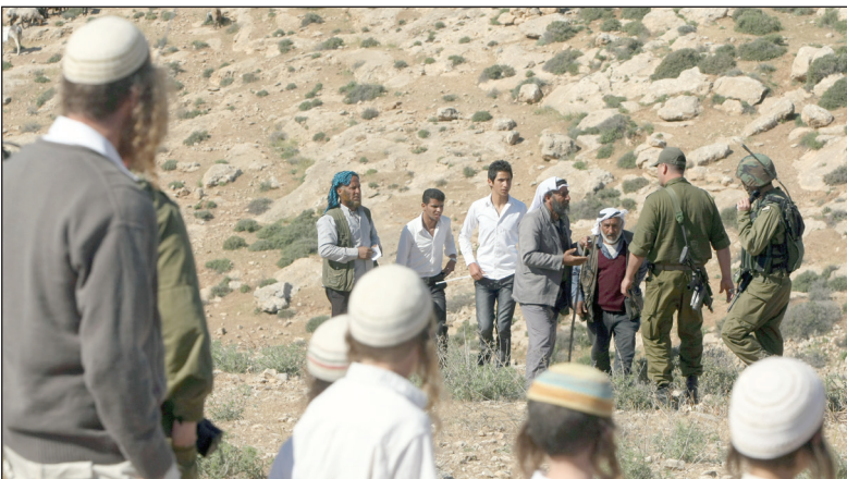
مستوطنون بحماية قوات الاحتلال يعتدون على أهالي مسافر يطا