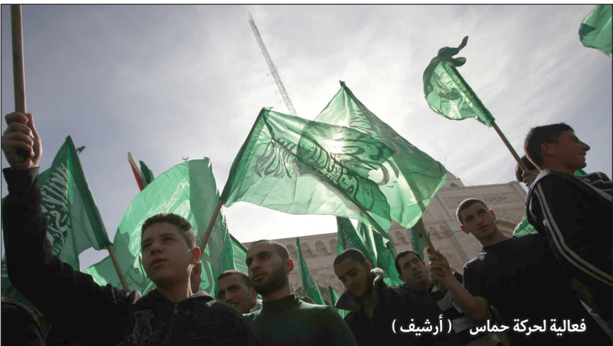
فعالية لحركة حماس (أرشف)