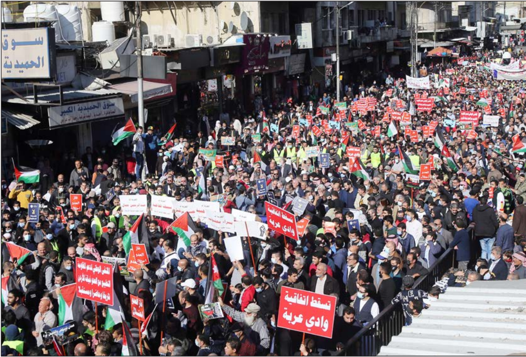
جانب من المسيرة

يمثل عدواناً على الشعب الأردني، مطالباً بـ"ضرورة دعم صمود الشعب الفلسطيني بمختلف الوسائل في التصدي للمشروع الصهيوني الخطير الذي يستهدف الأمة". وعدّ موقف الشعب الأردني الرفض لكل أشكال التطبيع مع الاحتلال بما فيها اتفاقية الغاز والمياه، يمثل موقفاً رصيناً وثابتاً لديه، لأن الأردنيين يرفضون بيع مقدراتهم وبيع وطنهم للاحتلال. وحث على توحيد الجهود وتجنيد