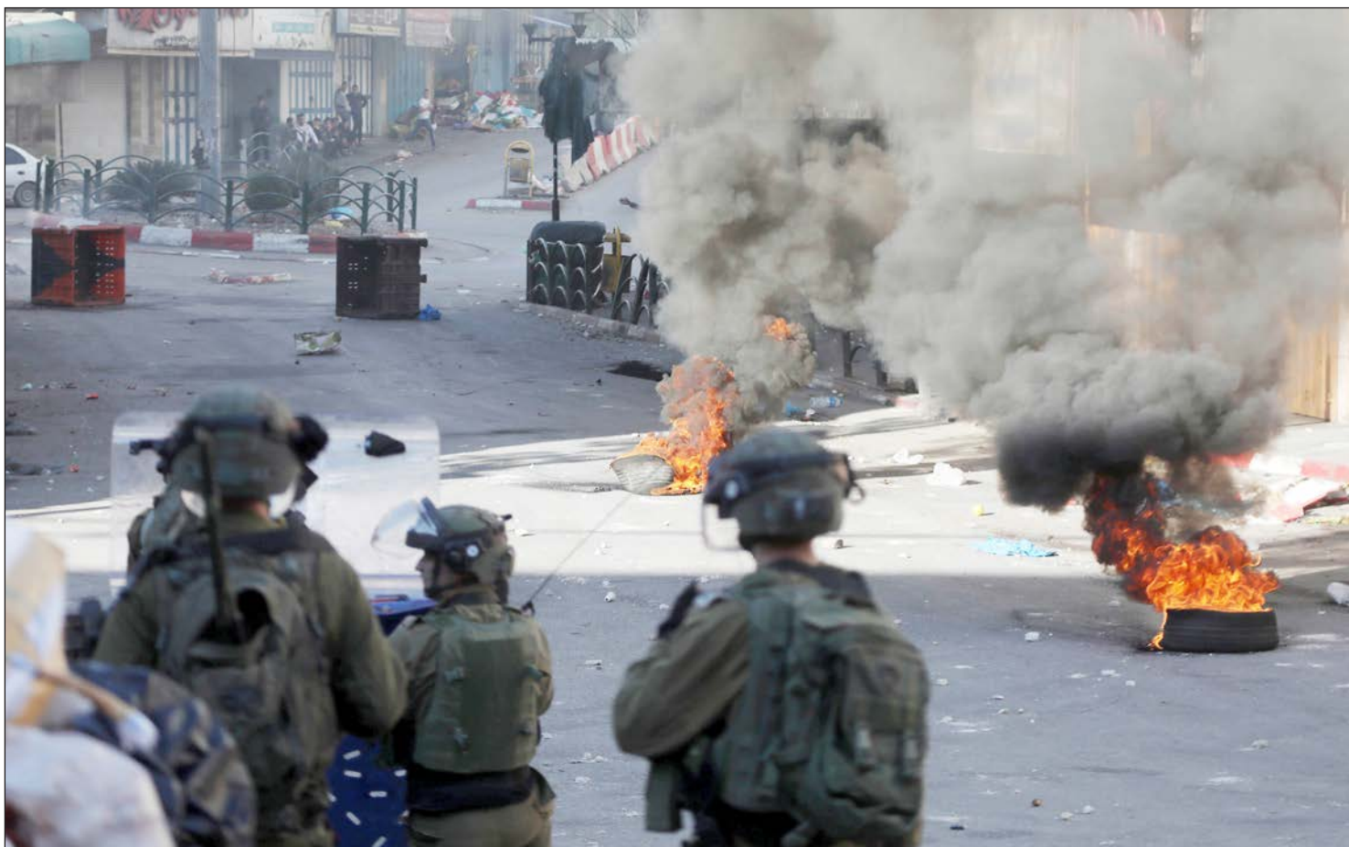
مواجهات بين شبان فلسطينيين وقوات الاحتلال في مدينة الخليل أمس