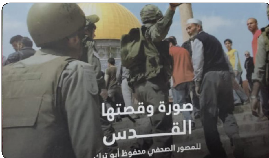
صورة وقصتها القدس للمصور الصحفي محفوظ أبو ترك

يقول لصحيفة "فلسطين": "أمتلك الكثير من الصور التي تعد ولا تحصى، تحمل جميعها في طياتها رسالة عن القمع الإسرائيلي وممارساته بحق أبناء شعبي، ودفاع الشعب الفلسطيني عن أرضه بشتى أشكال النضال".