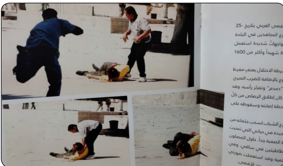
قصص الفري بتاريخ 25- بازع المهادين في البلدة مواجهات شديدة استعمل 66 شهيداً وأكثر من 1600 شرطة الاحتلال بعنف مفرط بوع بالإصابة للصرب المبرج "دمدم" وتفتّر رأسه، وقد كان يطلق الرصاص من كل لحظة إصابته وسقوطه على مرع الشباب لسحب جثثه من اليد في حياته التي تمت به الصعقة دحاً. حاول المصلون فلسطينيين في ساقه، وفي المنطقة وقد استعملت صورتي المنطقة

شعور التخمّة صعب ومؤلم، ولكنه ليس كما تبادر إلى ذهن الكثيرين، بل تخمته من نوع آخر، إذ إنه متخّم بالصور التي تحتوي على قصص ذات أبعاد إنسانية ونضالية، وتظهر مدى تشبث الفلسطيني بأرضه للدفاع عنها وعن مسجد الأقصى، كان