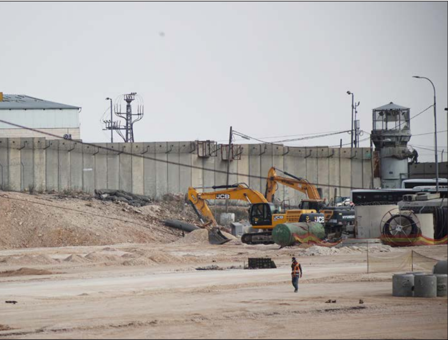
قوات الاحتلال تقوم بأعمال بناء استيطاني على أراضي مطار قلنديا