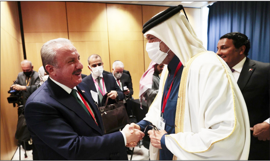
جانب من لقاء رئيس البرلمان التركي رئيس مجلس الشورى القطري أمس