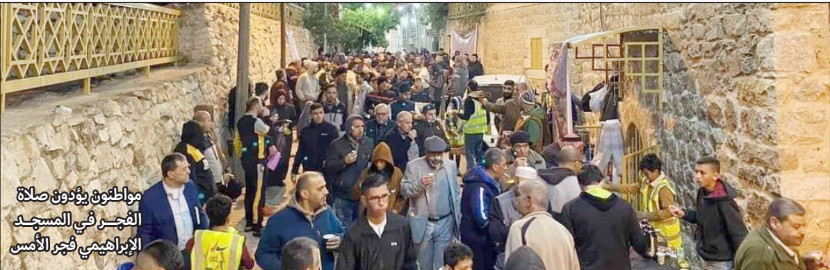
مواطنون يؤدون صلاة الفجر في المسجد الإبراهيمي فجر الأضيق