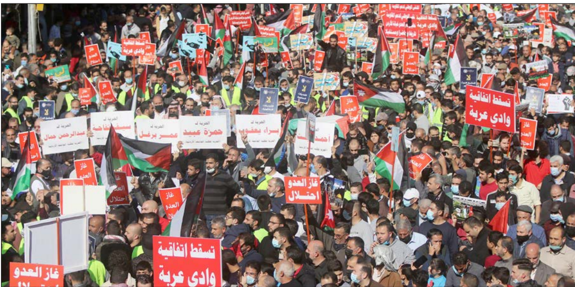
مشاركون في تظاهرة احتجاجية ضد اتفاق الغاز في العاصمة الأردنية أمس